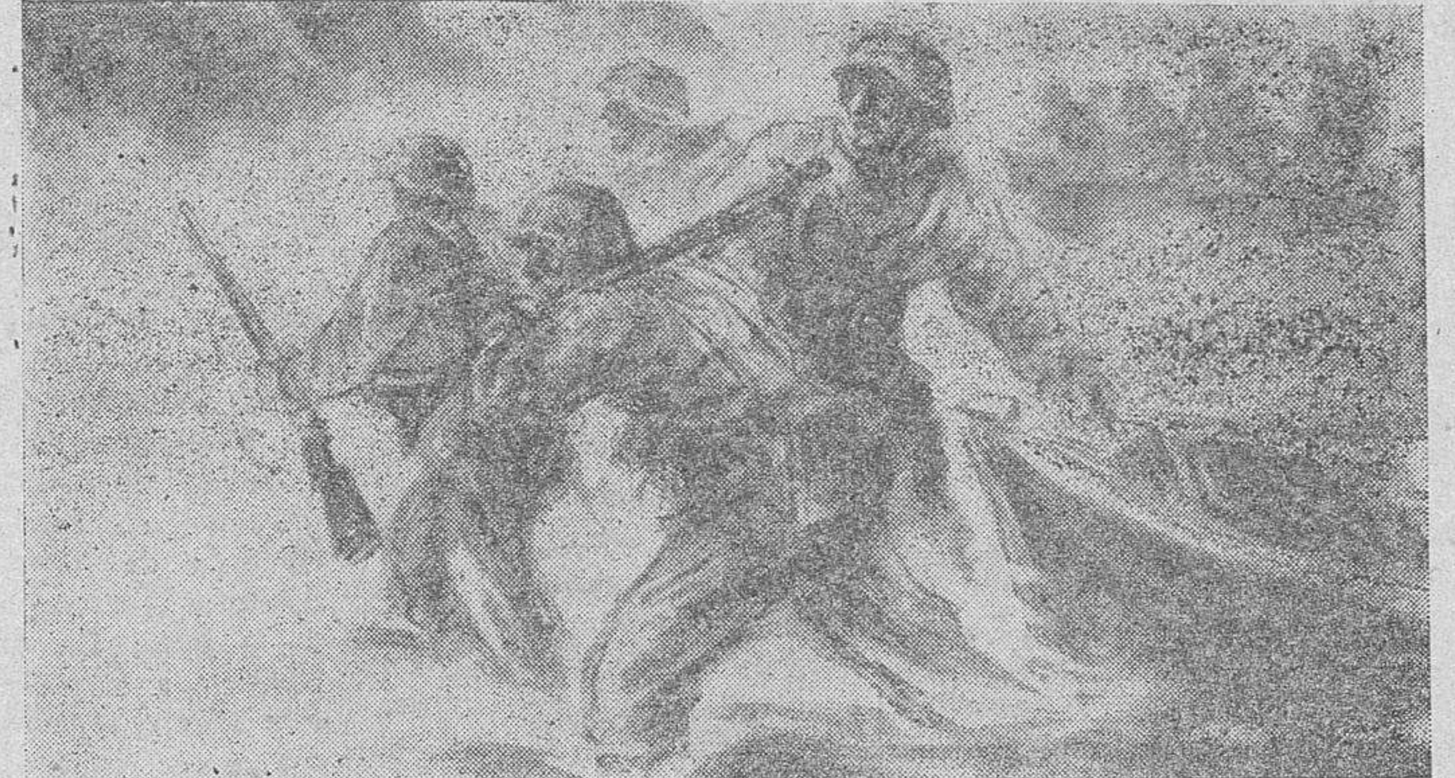
Este dibujo de un corresponsal de guerra alemán nos hace ver el dramatismo del cruce de un río en el frente oriental