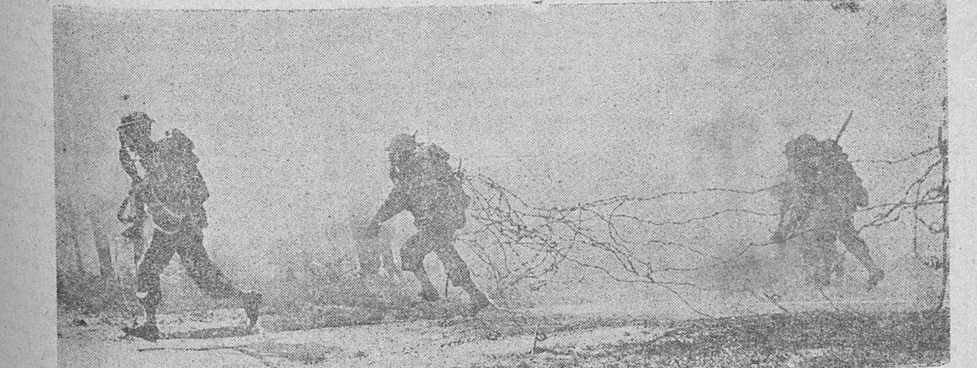
En uno de los sectores del frente francés, donde se ha combatido con dureza hace unos días, los soldados norteamericanos, después de haber sido rotas las defensas, se dirigen hacia una posición enemiga

El Adelanto en la capital y provincia es el diario más antiguo