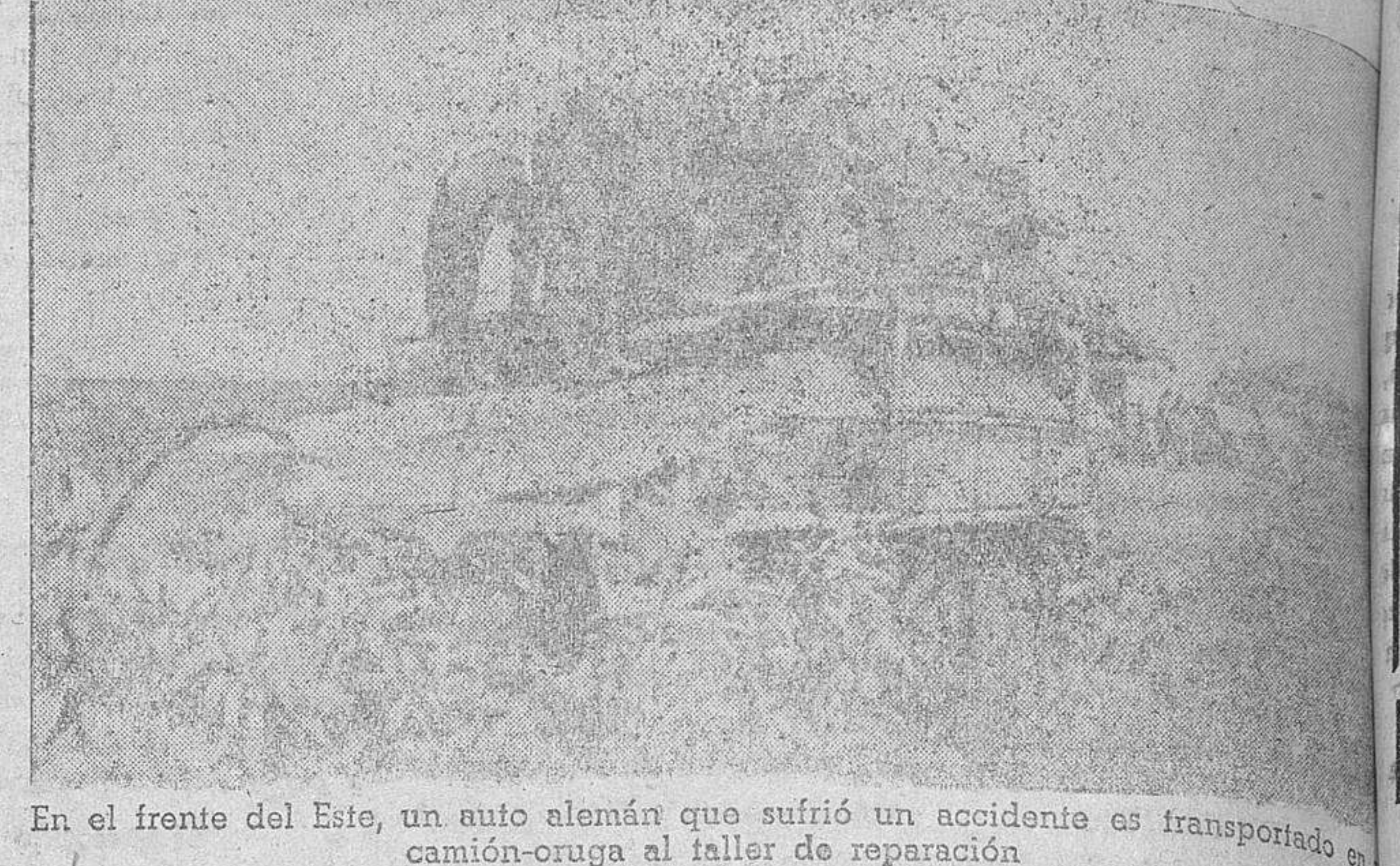
En el frente del Este, un auto alemán que sufrió un accidente es transportado en camión-outra al taller de reparación