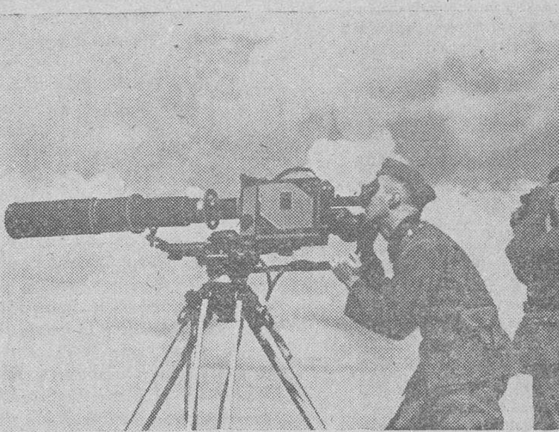
Mientras las baterías alemanas disparan contra las líneas soviéticas, se observa la precisión del tiro por medio de estos potentes aparatos.