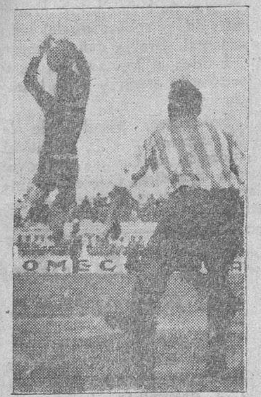
El portero del Alavés bloca con seguridad, bien respaldado por Ubis II.

cal, que no contrastó su valía por la escasa del contrario. Dolidos en el trío defensivo, gran construcción de juego en la línea media, con la consabida base de Marbán, y ello por dos razones: una, que jugó muy retrasado en la primera parte, y otra, que Marbán juega cohibido en Salamanca; el público le exige mucho; no le pasa nada y le abronca por fallos que cualquiera otro tiene y le absuelve; de todos modos, a fin de temporada, con falta de entrenamiento adecuado, nada puede hacer más el discutido Marbán; no creemos que esté en condiciones de salir en Baracaldo. Dámaso no es un delantero centro, pero es un jugador que practica el juego con inteligencia y eso le bastó para defenderse y hasta marcar su gol; no desentonó, por tanto, de los cuatro restantes, que estuvieron francamente bien cada uno en su estilo, desde aquellas filigranas de Juanete, que hicieron exclamar a un espectador: "¡Eres el Manolete del fútbol!", pasando por el juego reposado de Pastor, la impetuosidad de Nano y la alegría y solera de Manolo. No somos capaces de explicarlos, después de cotejar las allanaciones del Alavés en su campo y aquí, cómo no pudieron tirarse los dos puntos de Mendizorroza.