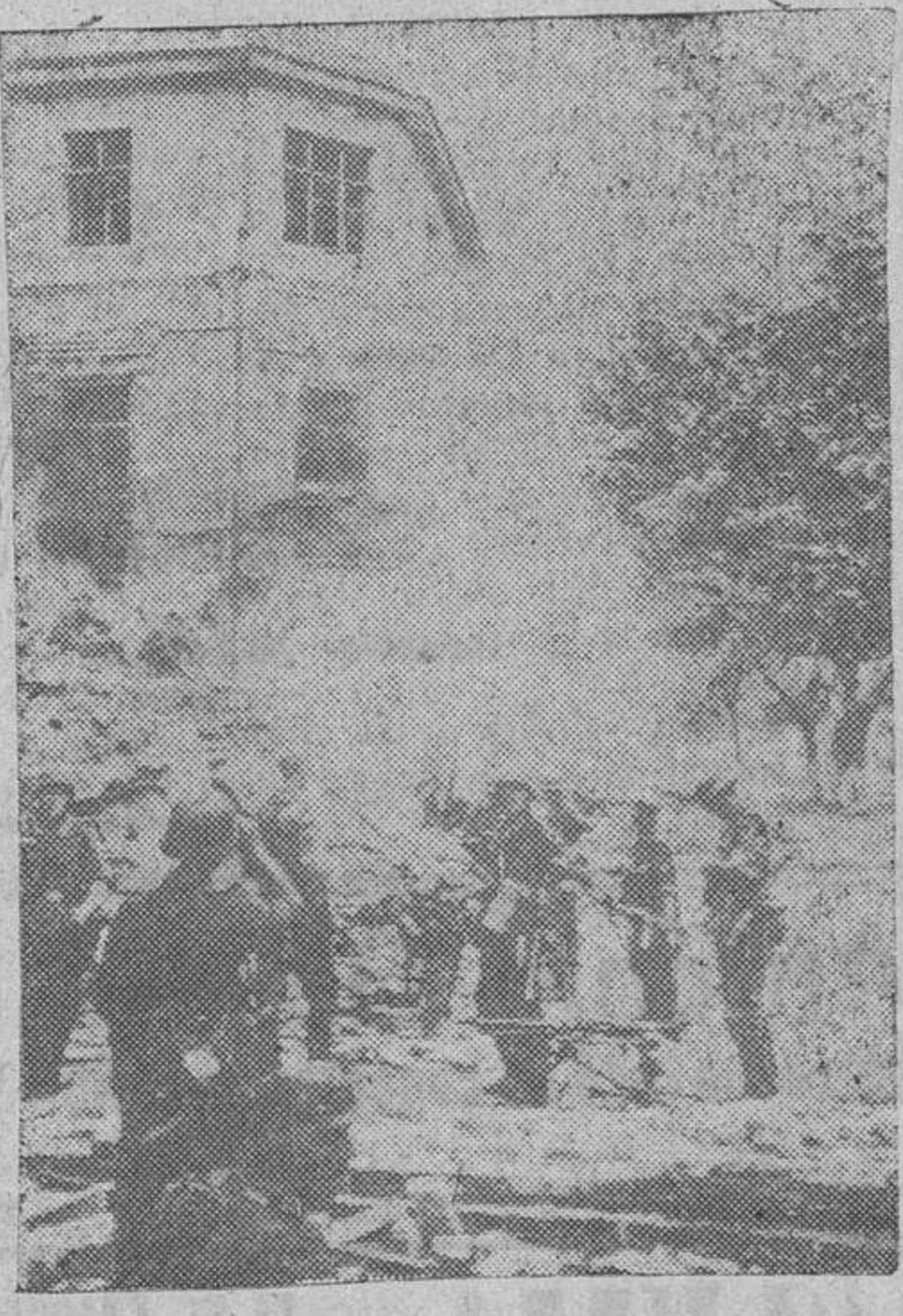
Los soldados alemanos, al conquistar el asalto a una ciudad rusa del Este...