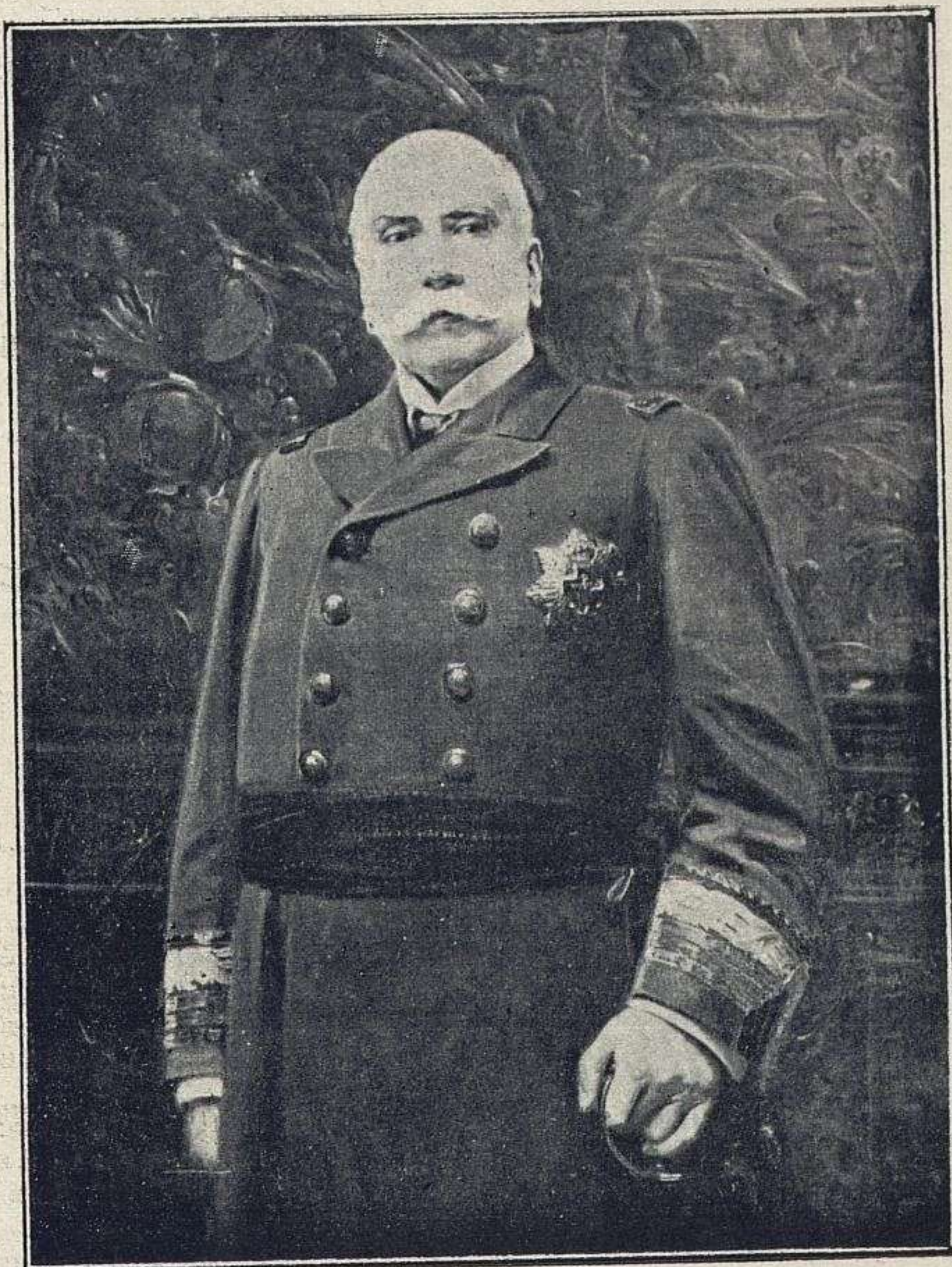
RETRATO DEL GENERAL CONCAS, POR JULIO BORRELL