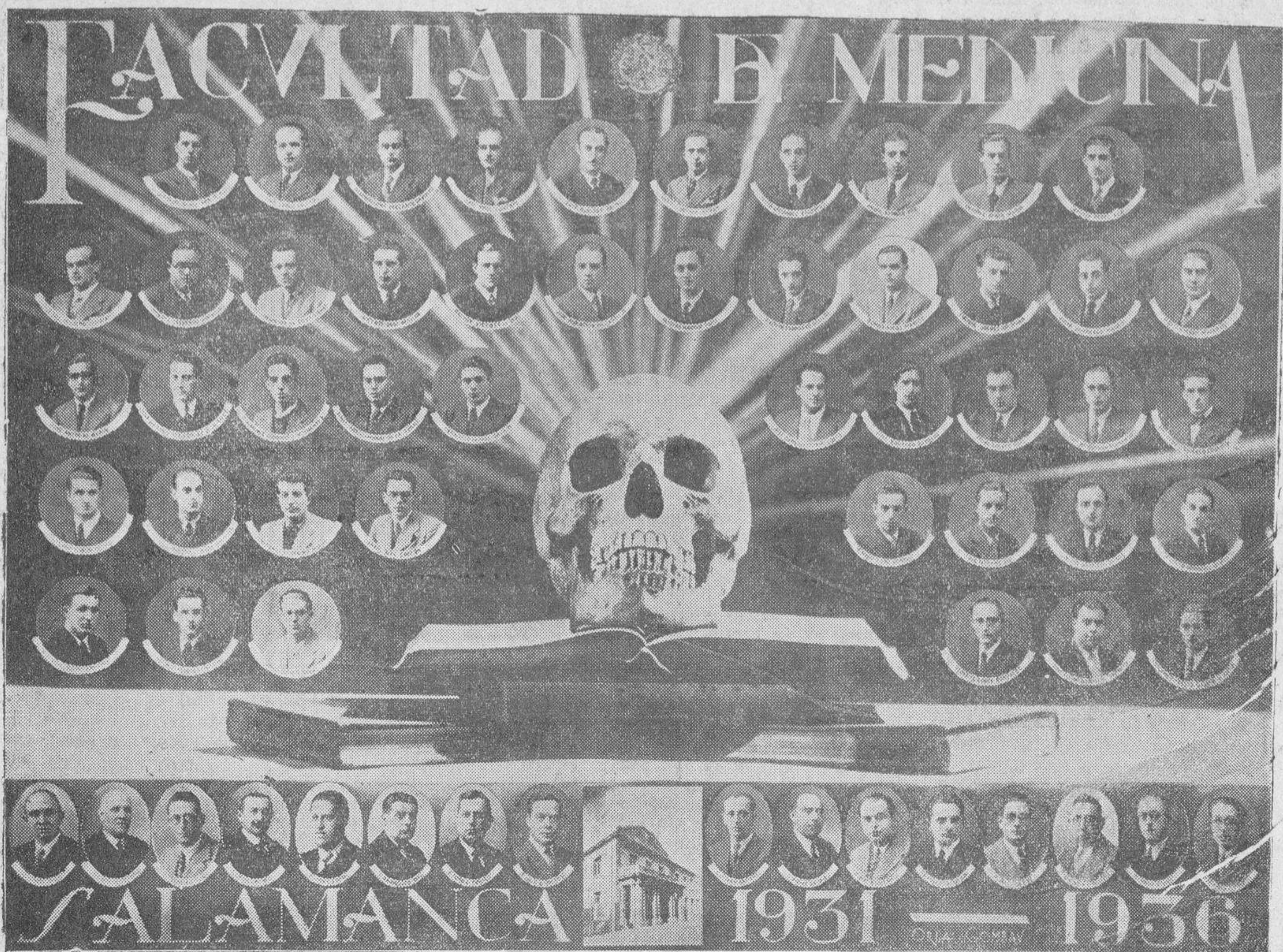
Los nuevos médicos y sus profesores. Orla confeccionada en los talleres fotográficos de la Señora Viuda de Gombau

LA TEMPERATURA QUE HIZO AYER Barómetro, 691,6 Sombra, 18,0 Mínima, 1,9. Seco, 14,6. Húmedo, 11,0. Viento, E. — fuerza, 1. Cielo, algo nuboso. Tiempo, variable. Lluvia de ayer, 0,0