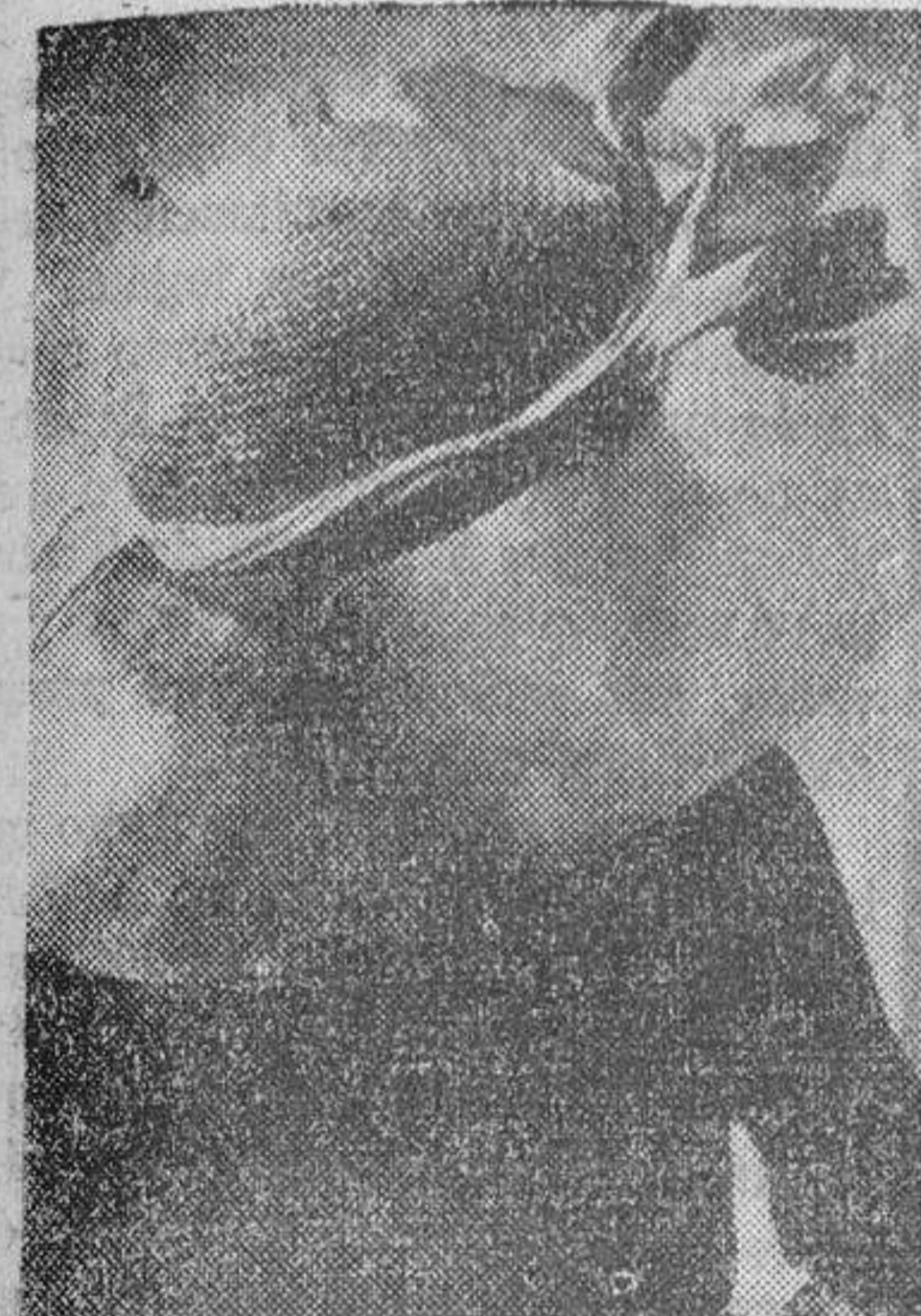
Sombrero de cristal azul con casco de paja de seda del mismo tono, hecho con ganchillo. Adornos de tulipanes.

Sombreros de cristal El sombrero de cristal, al constituir una especie de aureola en torno a la cabeza, tiene la ventaja de crear un marco casi irreal para el rostro, un marco inesperado del que irradia un centelleo de luz singular que produce infalible una impresión de grata sorpresa en quienes lo contemplan. La lozania de un rostro bien cuidado se halla así idealmente realzada la belleza femenina colocada en plena luz ha encontrado al fin lo que necesitaba: el sombrero de cristal, en vez de sombrear el rostro, derrama en él la cantidad de luz necesaria. Por lo que atañe a la fabricación de esta curiosa novedad,