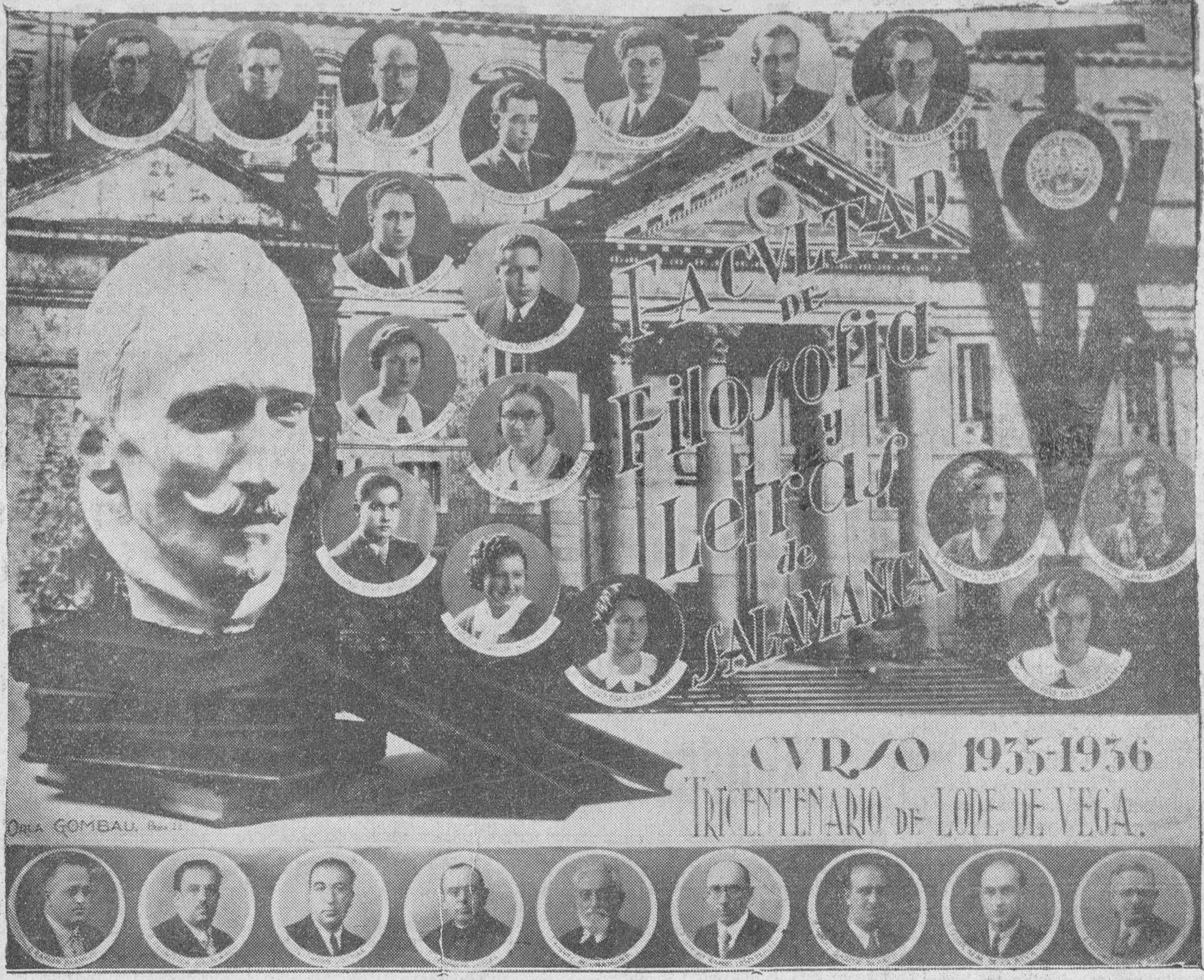
El tricentenario de Lope de Vega, ha dado a la casa Gombau espléndido motivo para la confección de la orla de Filosofía y Letras