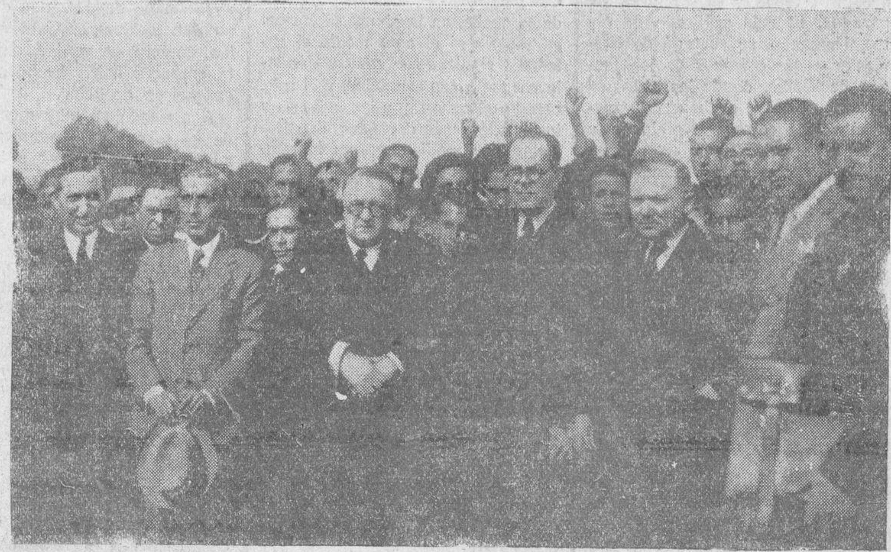
Las autoridades locales y provinciales con el personal técnico de la Compañía de los Ferrocarriles del Oeste de España en el acto de inaugurar las obras de desviación del ramal de Salamanca a Tejares

Las autoridades e invitados se trasladaron a la villa. En el salón de actos del Ayuntamiento fueron obsequiados con un "lunch".