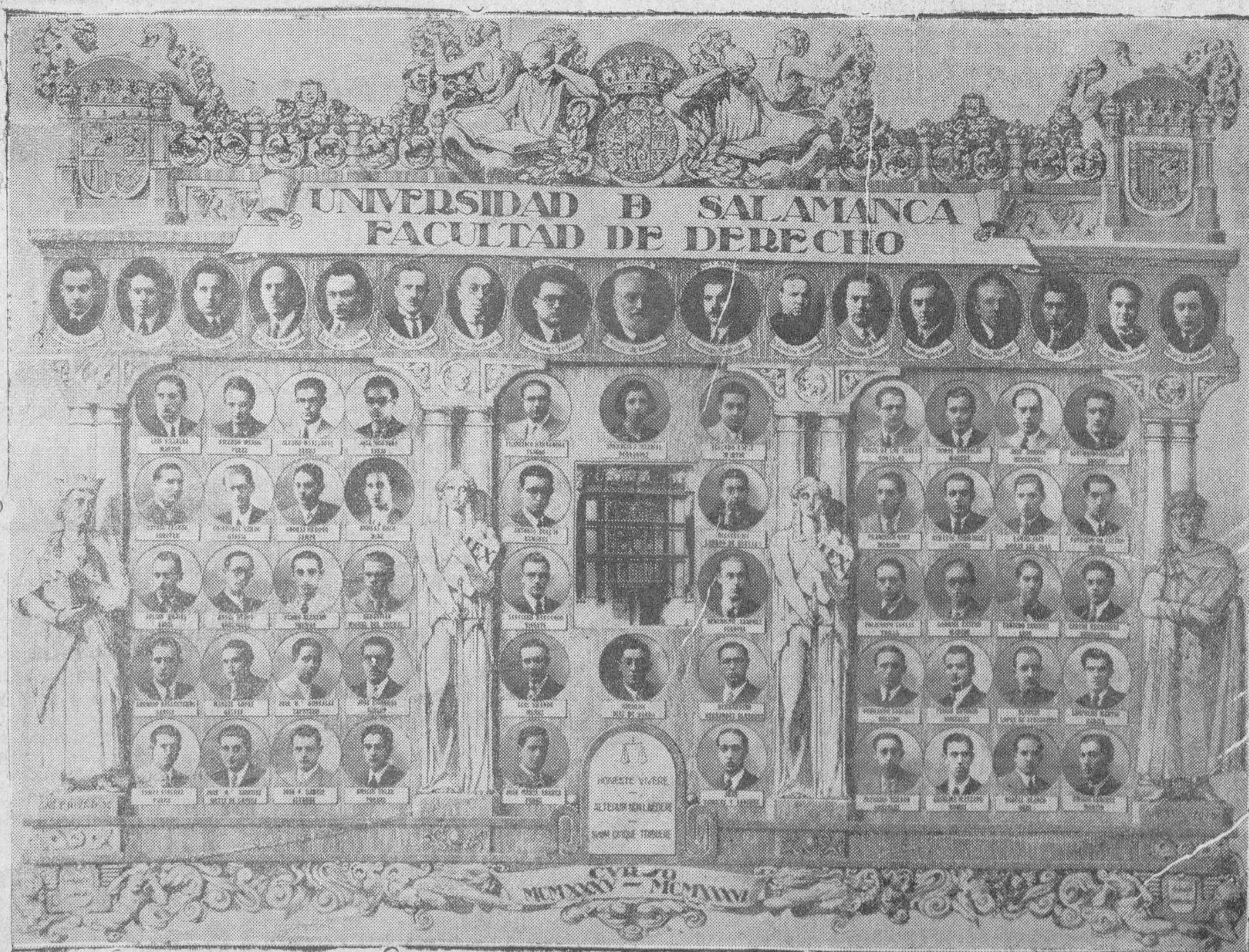
Artística orla de la Facultad de Derecho, dibujada por Pepe Herrero y confeccionada por los Talleres Gombau

Estos vecinos estiman como un peligro el tránsito por dicha vía, y por lo tanto creemos que el Ayuntamiento acogerá el ruego que le dejamos hecho.