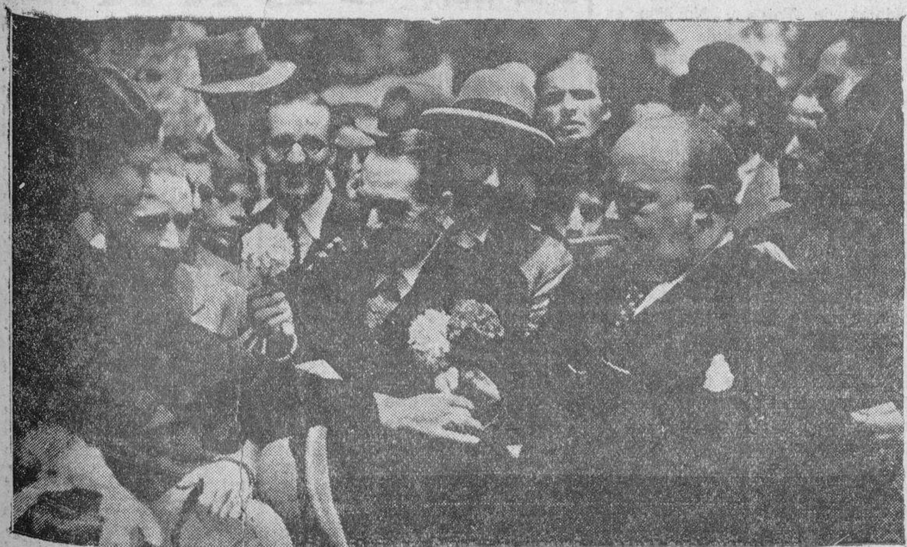
En el Paseo de Recoletos, de Madrid, se ha inaugurado la II Feria de Flores. He aquí una bella escena ofreciendo flores desde un "stand" al alcalde y concejales madrileños.