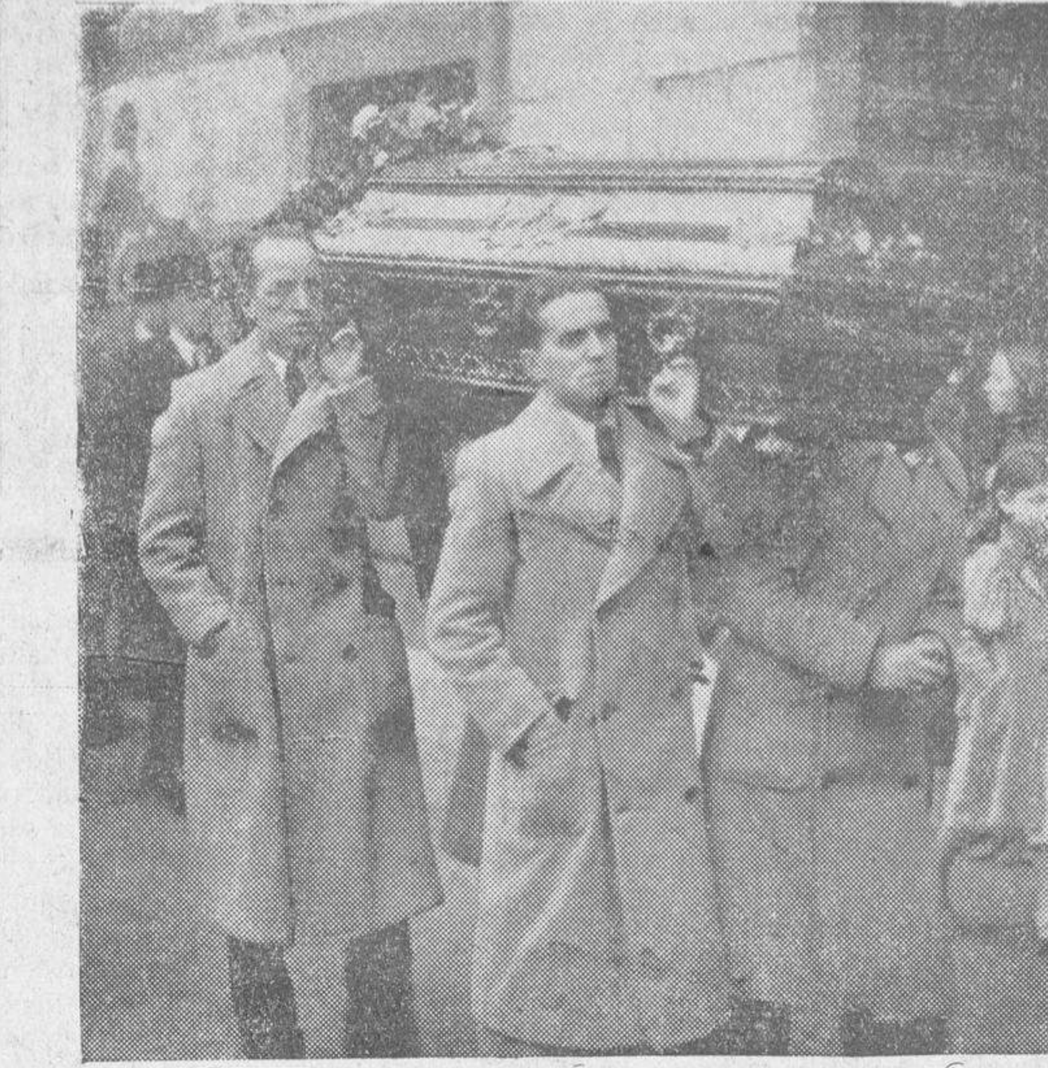
Dos momentos del entiero del cadáver de la distinguida dama salmantina doña Vicenta Bande Nacar, viuda de Pérez-Moneo. A la izquierda: el féretro conducido por empleados de la Casa Moneo Hijo. A la derecha: la presidencia del duelo, en la que figura el ministro de Instrucción Pública, don Filiberto Villalobos, con los familiares de la finada

AMA DE CRÍA , se ofrece para criar en casa de los padres, de veintidós años, leche fresca y primaveriza. Informará: Isabel Machado, calle de la Cuesta, Villarino de los Aires.