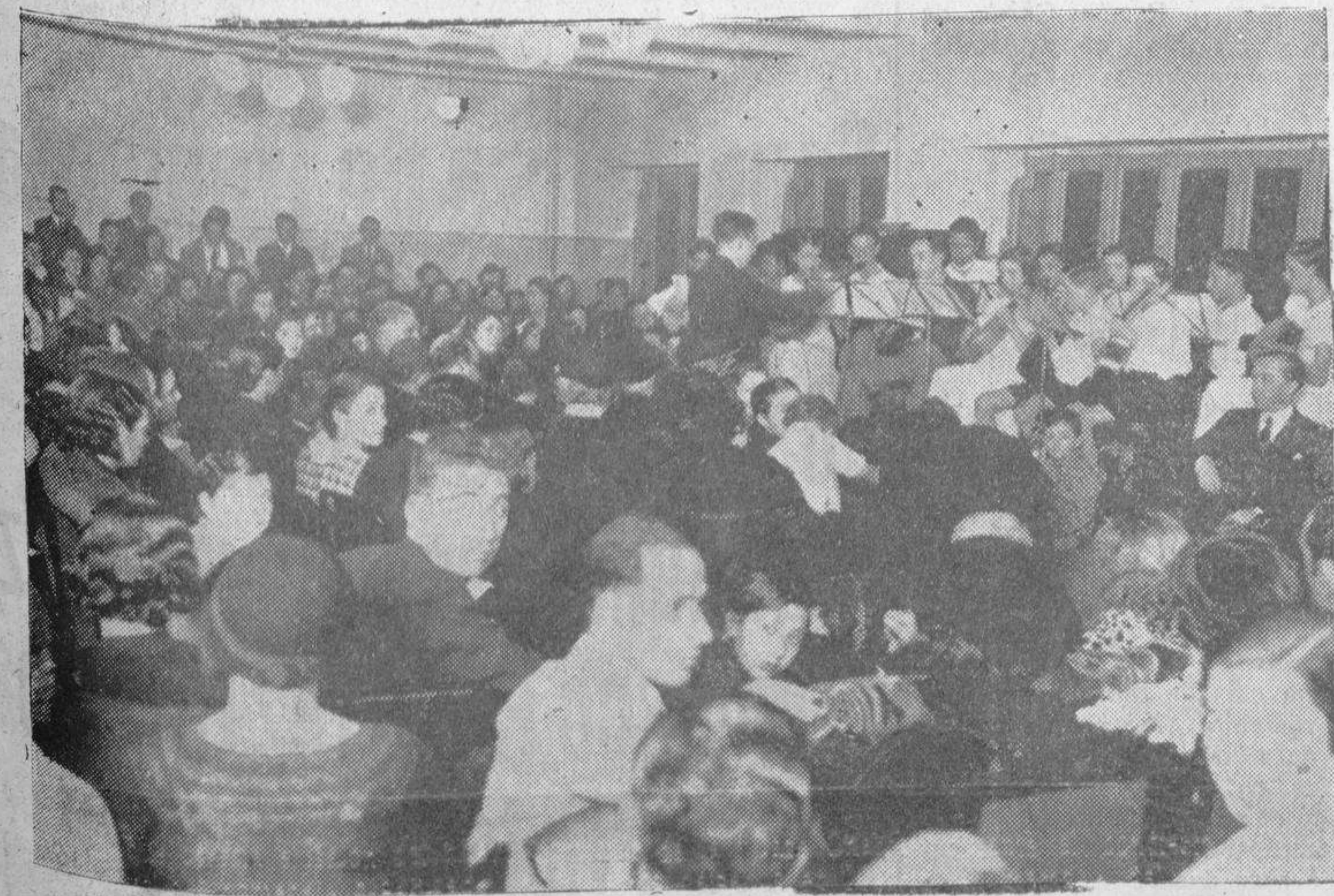
Aspecto que ofrecía el salón del nuevo domicilio de la "Casa Charra" durante el concierto celebrado con motivo del homenaje organizado por nuestros paisanos en Madrid, en memoria del ilustre músico salmantino don Tomás Bretón