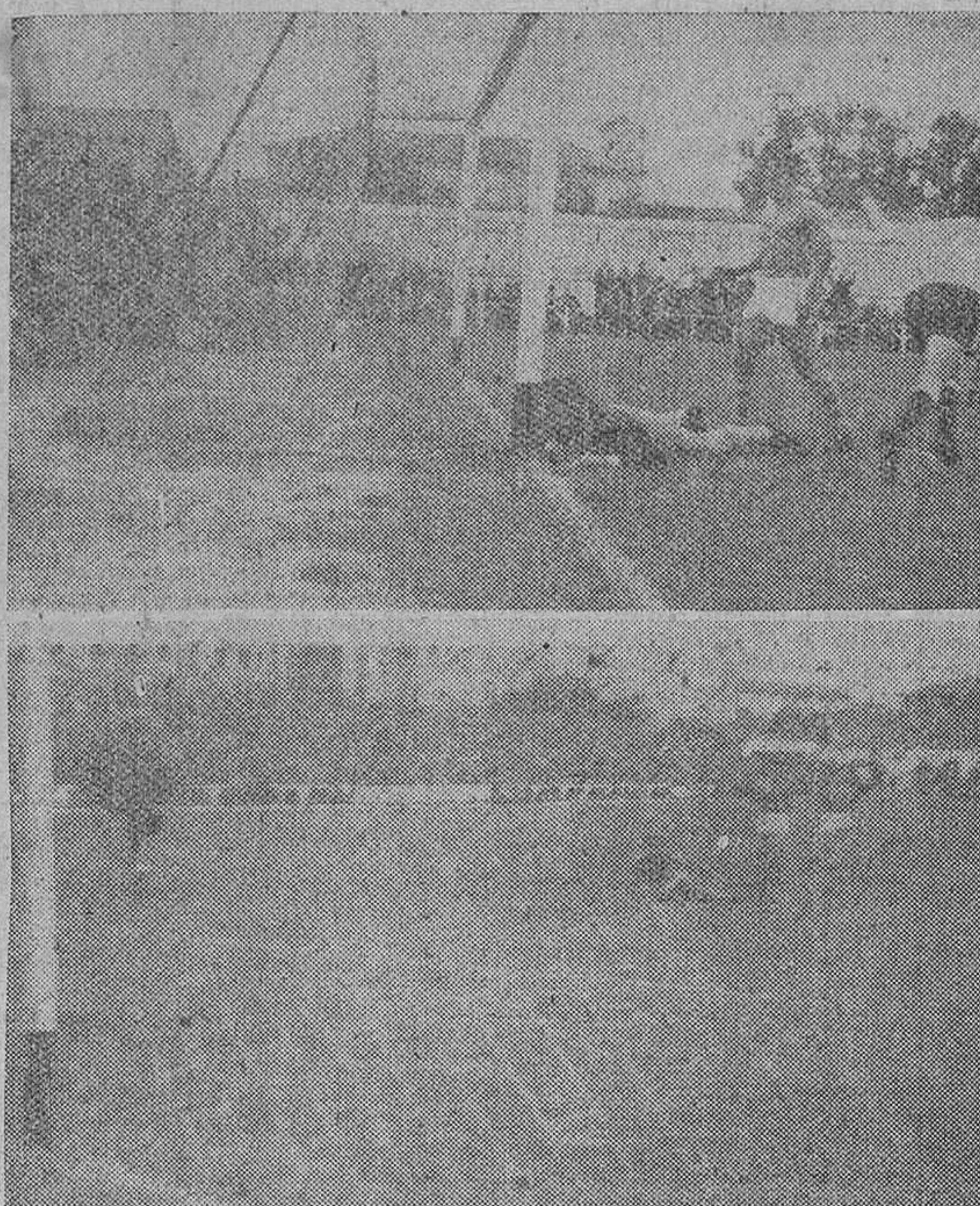
LOS TRES GOLES DEL BURGOS, EN EL PARTIDO DEL DOMINGO ULTIMO, CAPTADOS POR «FEDE».