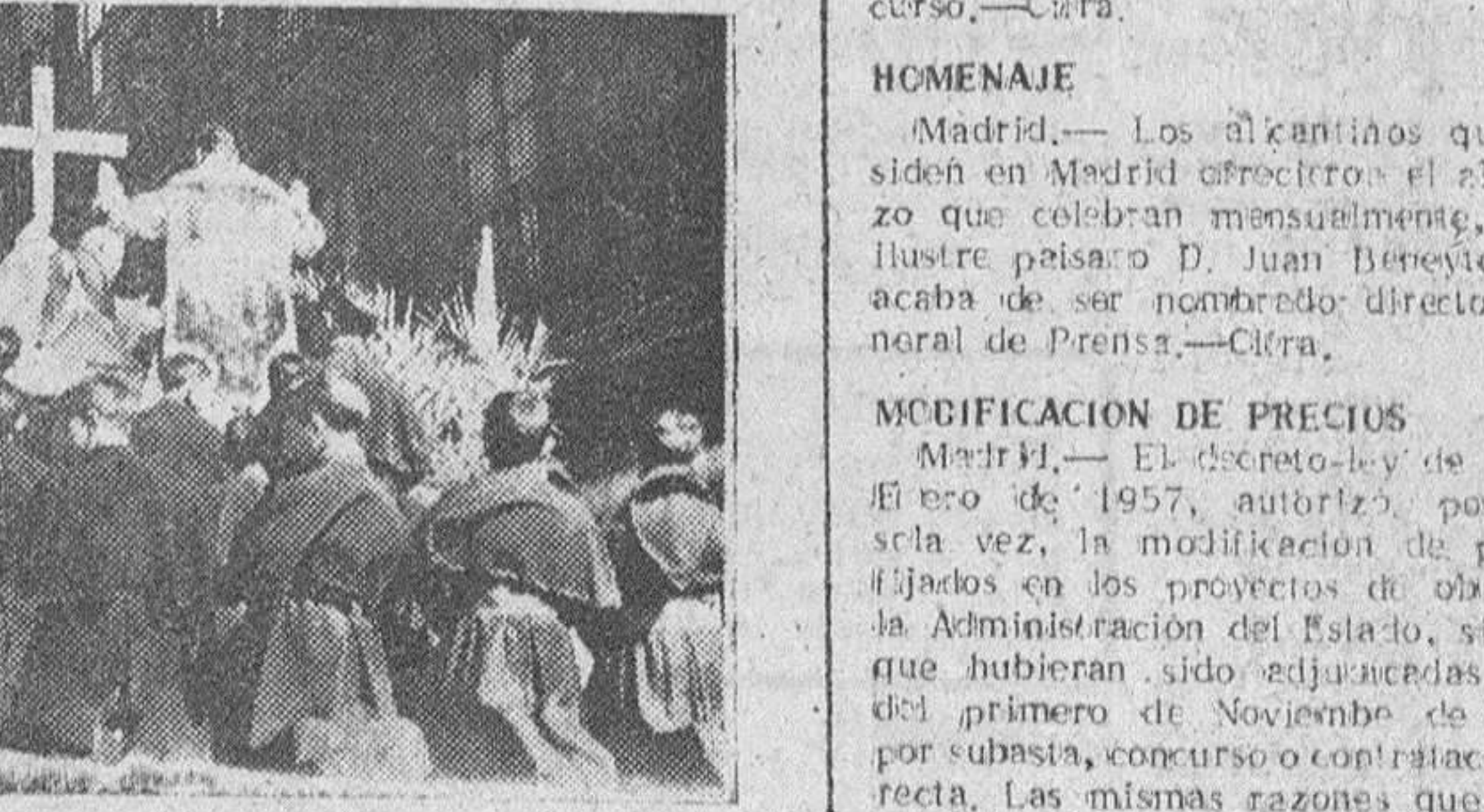
Una de las novedades que ofreció en Burgos el "Día del Seminario", celebrado ayer con gran entusiasmo, fue el desfile de una cabalgata en la que sobresalía la carroza representativa del sacerdocio. "Fede" captó el paso de la carroza por la calle de la Pañoma.