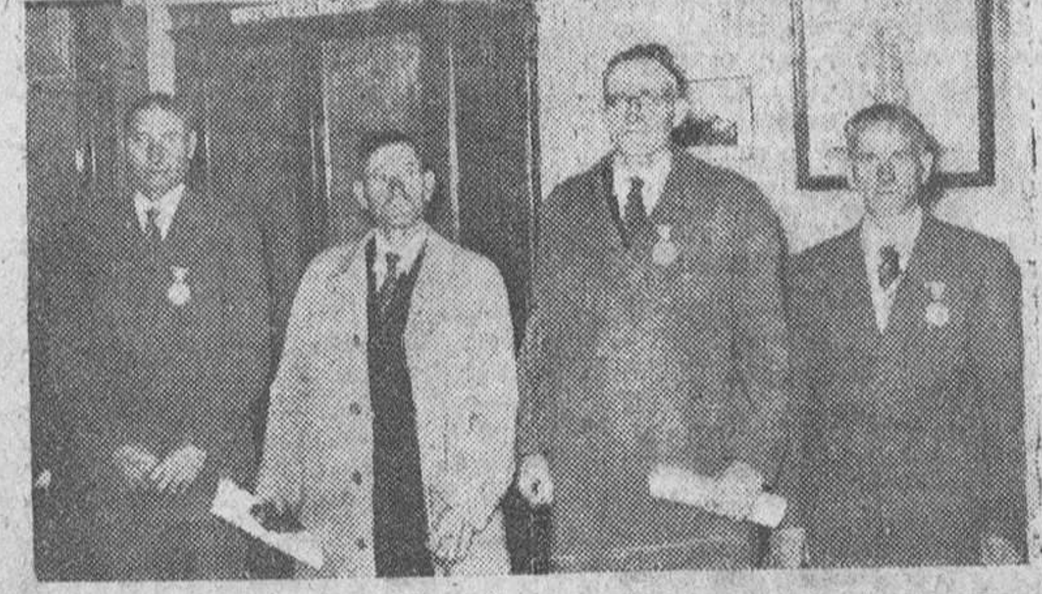
Dentro de los actos que tuvieron lugar ayer en Burgos con motivo de la festividad de San José, destacó, por su interés social, el tradicional homenaje a los matrimonios de la provincia distinguidos en el presente año con los Premios de Natalidad. En nuestro grabado, el instante en que el gobernador civil interino impone uno de los galardones y un grupo en que figuran los cuatro campesinos premiados.