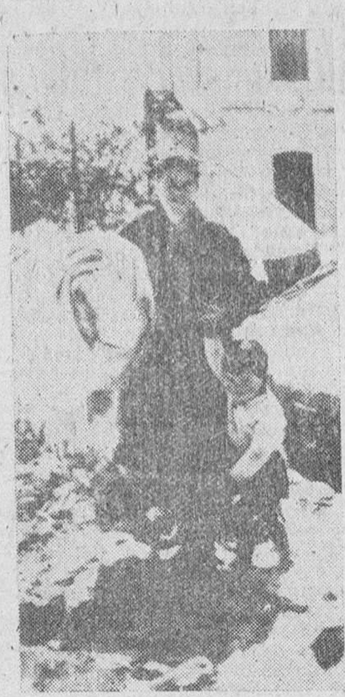
Velos. -- Una madre y su hijo abandonan su casa que fue destruida a causa de los temblores de tierra habidos en las zonas de Tesalia y Farsala...