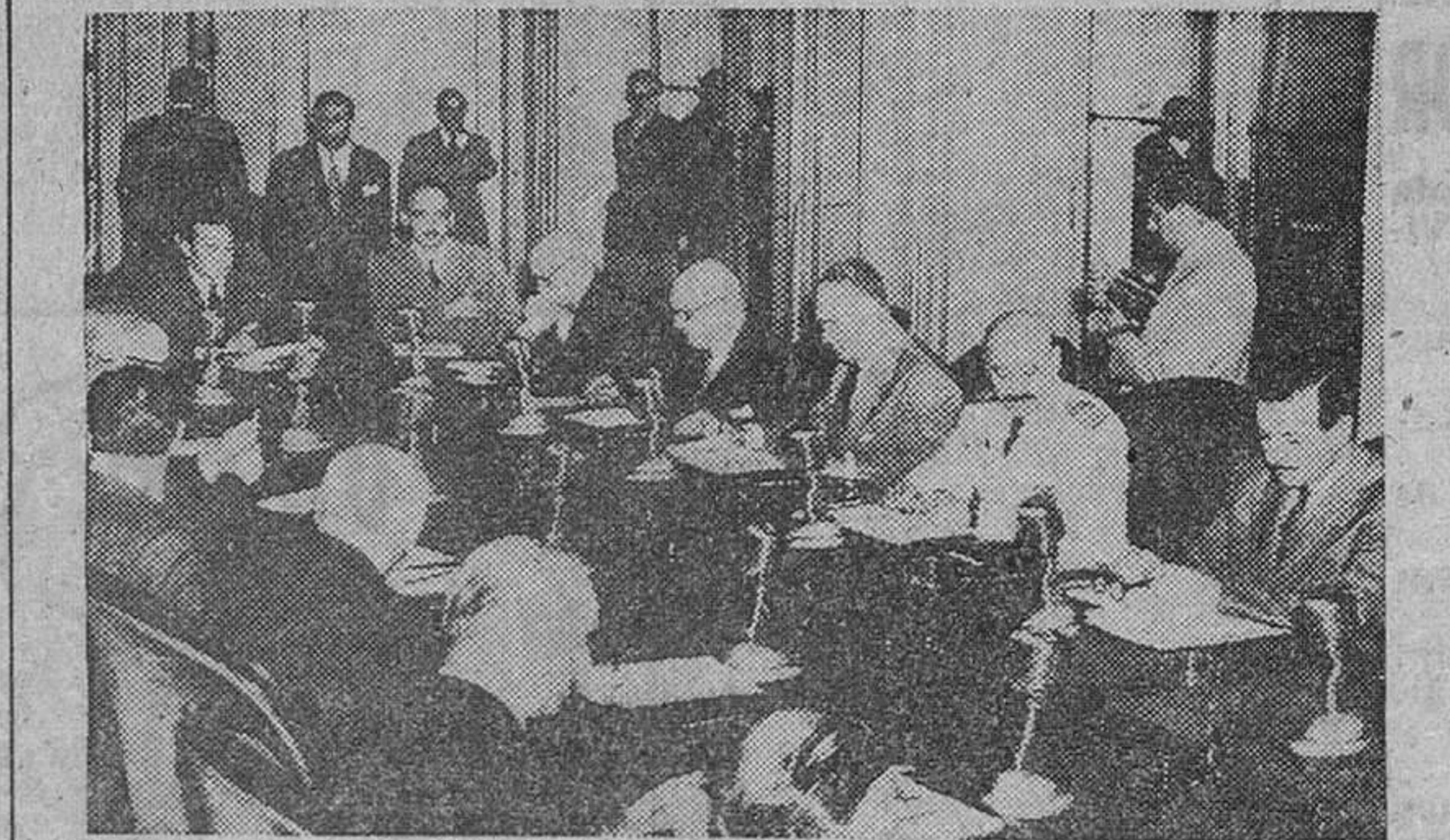
Buenos Aires. — Un momento de la primera reunión plenaria del nuevo Gobierno de la Argentina presidido por el general Pedro Eugenio Aramburo.

Buenos Aires. — Los Ministerios del Ejército, Trabajo y Transportes apremian a los trabajadores para que permanezcan en sus puestos de trabajo. El Ministerio del Ejército dice que "las fuerzas armadas garantizan la libertad de trabajo". URANGA HA SIDO DETENIDO Buenos Aires.—En fuentes dignas de crédito se dice que el general Juan José Uranga, exministro de Transportes en el Gobierno Lonardi, ha sido detenido. Se desmienten los rumores sobre un levantamiento militar.—Efe. FIDE LA EXTRADICION DE PERON Buenos Aires.—Un tribunal federal argentino ha recomendado al Gobierno que pida la extradición del destituido presidente Perón, a fin de que pueda contestar "a las acusaciones que se le hacen de traición y asociación ilegal".—Efe. CAFE FILHO ESTA VIRTUALMENTE DETENIDO Río de Janeiro. — La Cámara de diputados ha aprobado una moción por 179 votos contra 94, en virtud de la cual se declara