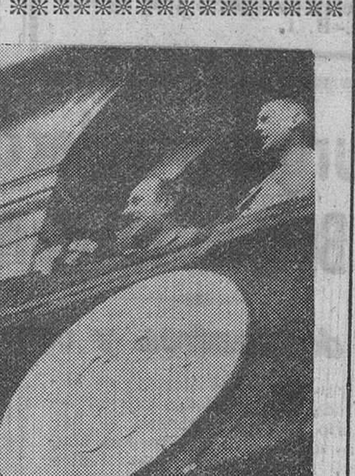
IMPOSICION DE UNA CONDECORACION AL P. LEGISIMA

todos los terrenos y dicen que el marqués de Santa Cruz se le reserva la acogida que se da a los representantes de las naciones más amigas.