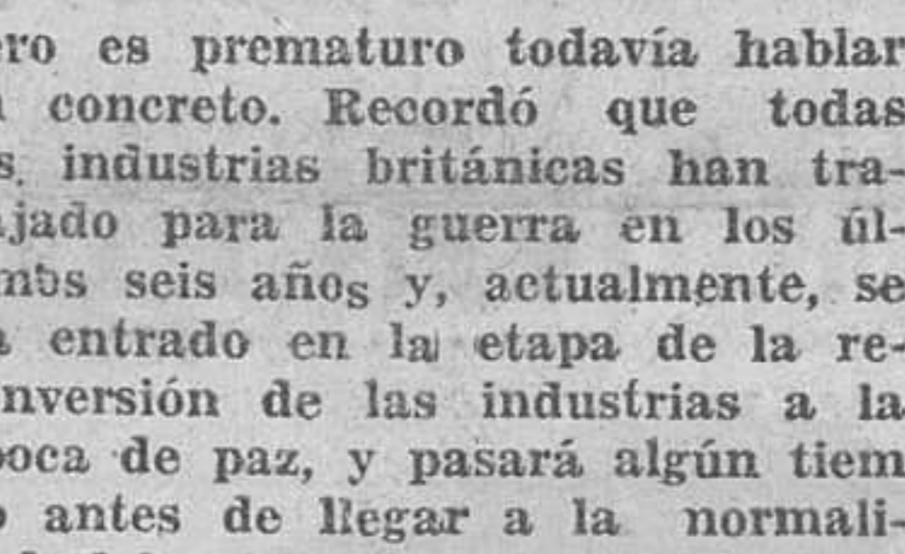
(Continúa en última página)

Con unas frases afectuosas para la Prensa, se ha despedido el embajador de los periodistas, obsequiándoles con un lunch.