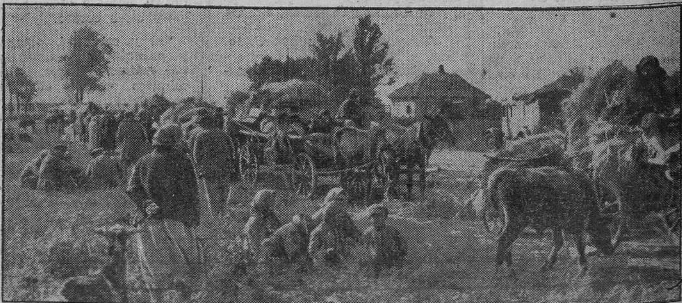
Una caravana de campesinos rusos que no quieren volver a ser víctimas de los soviets y abandonan sus hogares con las tropas alemanas