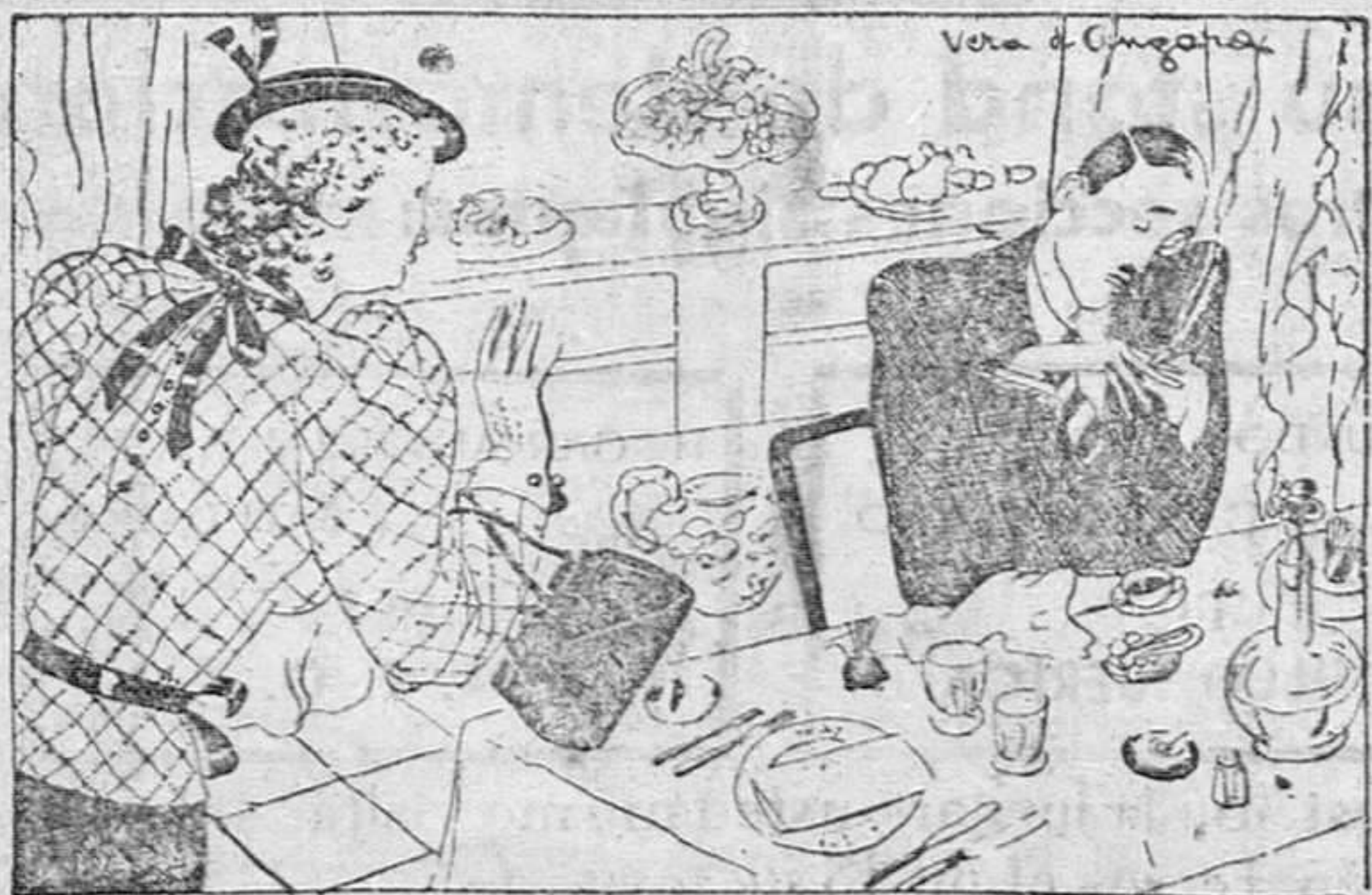
—Perdóname, querido, si vuelvo a estas horas a casa. Se me ha hecho tarde por... porque... Está bien; te creo.