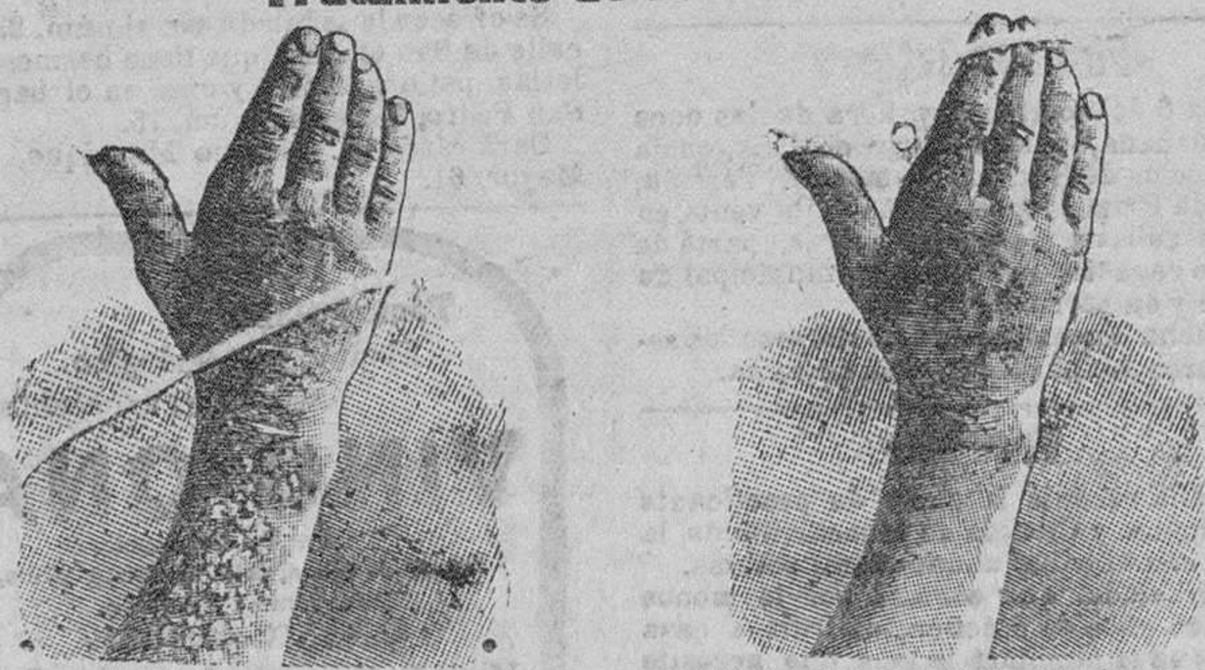
Antes de la curación.

Curación radical de todas las enfermedades de la piel, de las llagas de las piernas y del artrismo, reumatismo, gota, dolores, etc., por medio del Tratamiento de L. RICHELET