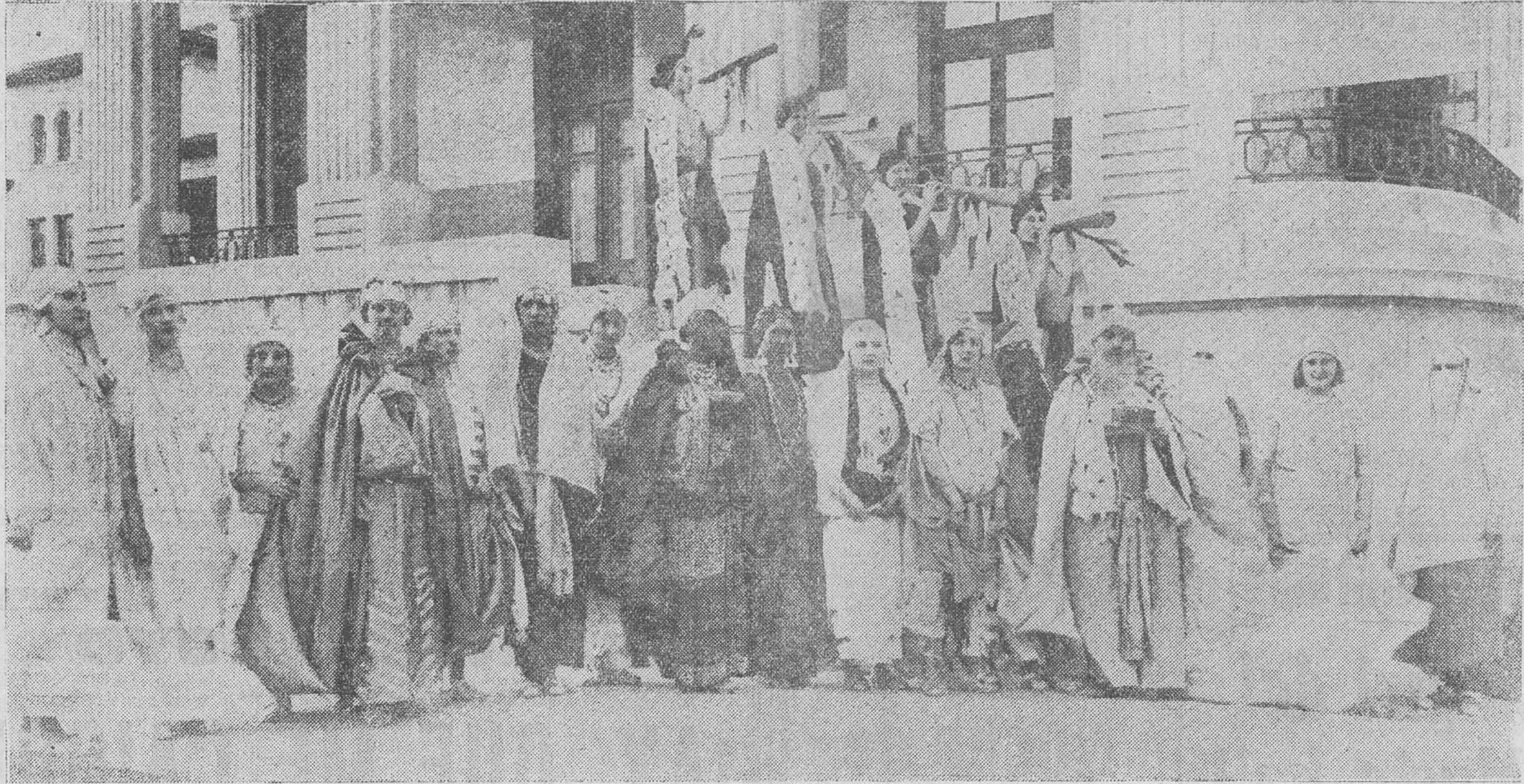
LOS REYES MAGOS, EN VALDECILLA. — He aquí a las bellas enfermeras de Valdecilla convertidas en los Magos de Oriente, y en su comitiva para llevar a los niños hospitalizados preciosos juguetes. La llegada de este precioso cortejo a los pabellones donde los niños enfermos soñaban despiertos con los regalos de los Reyes Magos, fué acogida con aplausos infantiles inapreciable premio a la bondad de estas distinguidas señoritas enfermeras, que han querido hacer dichosas las horas de ayer a los pequeños huéspedes de la Institución creada por el marqués de Valdecilla.

EL DOS DE MAYO ha recibido los mejores calzados de invierno, y obsequio con un regalo.— PUERTA LA SIERRA, 2