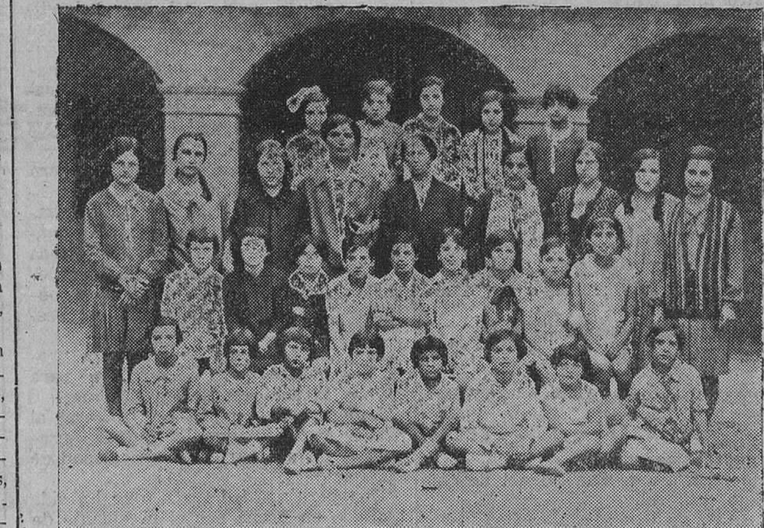
TORRELAVEGA.—Un grupo de niñas y profesoras de las escuelas nacionales de Torrelavega, que, merced al donativo del señor alcalde, han hecho una agradable excursión a Suances.