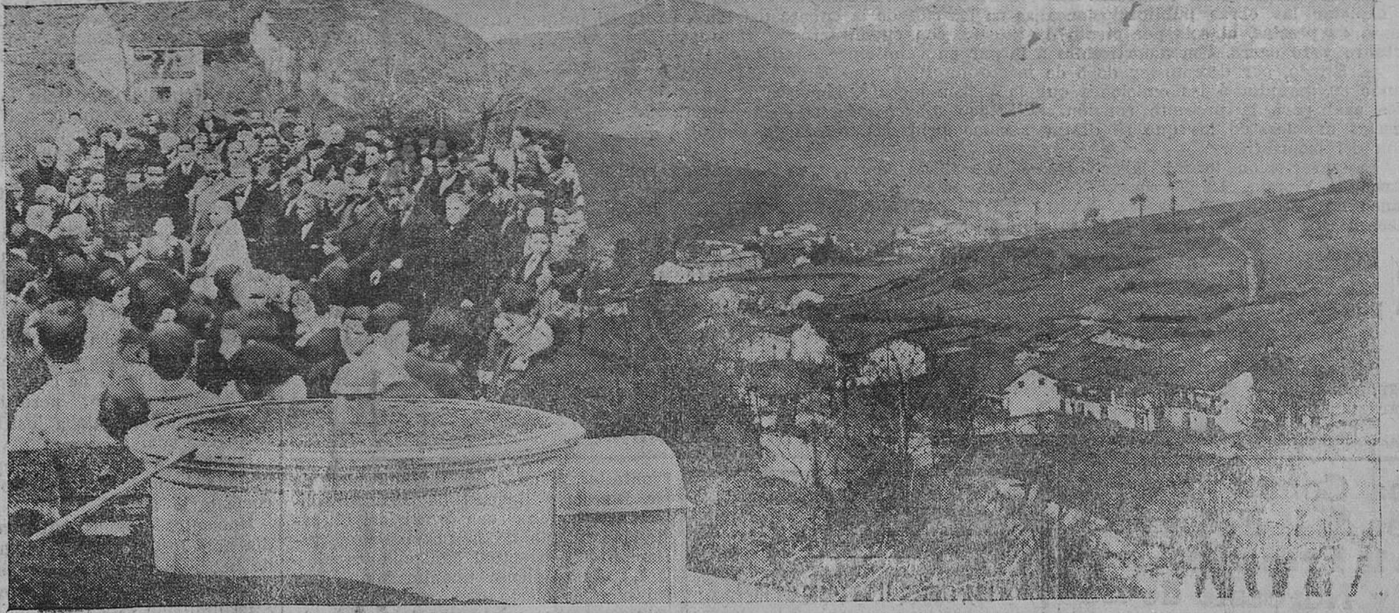
SIMPÁTICA FIESTA — PUERO.—Bendición e inauguración de la nueva traida de aguas á la importante villa.