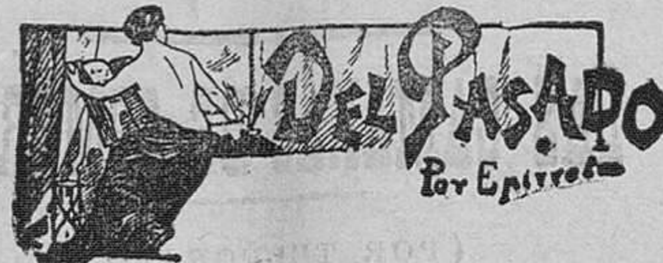
Batalla de los campos cataláunicos

Con algo que quizás sea progreso, en cierto orden de cosas, ha venido á la montaña esa corrupción moral que hace manuduen esos crímenes como el de ayer que antes aquí apenas se conocían.