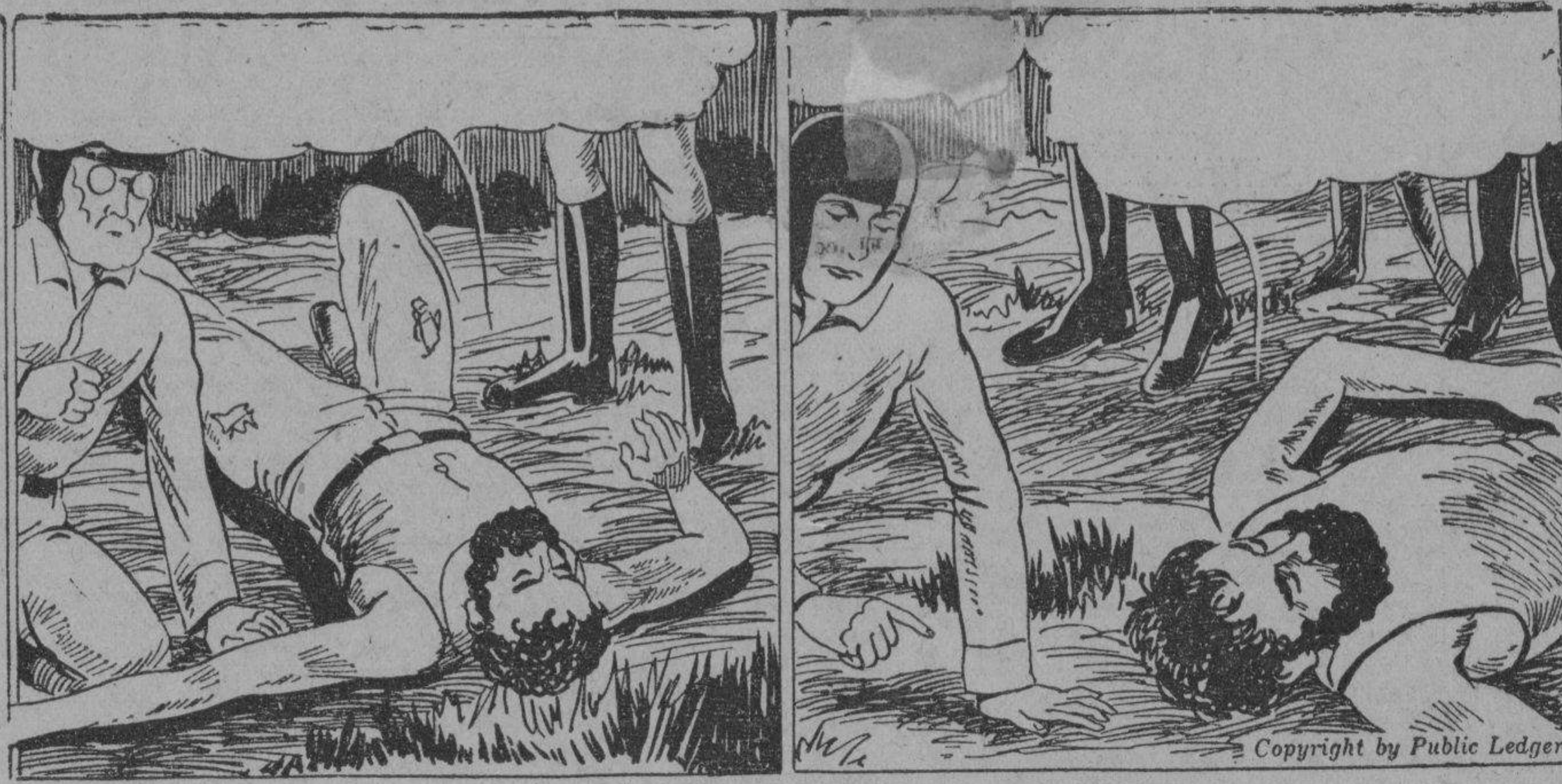
EL CAUTIVO: Era un tripulante en el avion pirata de Red Rogers. Pero condenado sea él, me abandonó en esta luna porque traté de armar un amotinamiento.

MIENTRAS EL PROFESOR LUCHA PARA SALVAR SU VIDA, EL EXCAUTIVO MISTERIOSO DE LOS HOMBRES-ANFIBIOS RELATA SU HISTORIA.