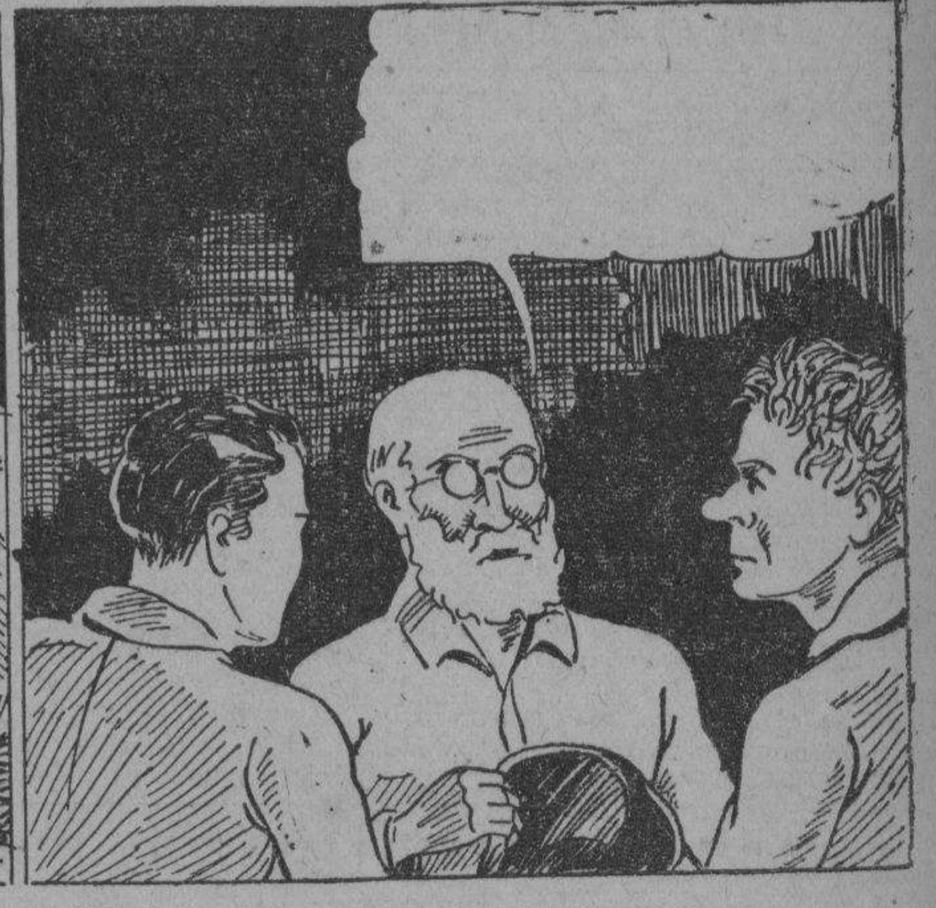
PROFESOR: Pobre chico! Se ha muerto. Pero que historia mas sorprendente. Otro pirata del espacio. Este Red Roger me temo que sea un buen aliado para el conde Don.