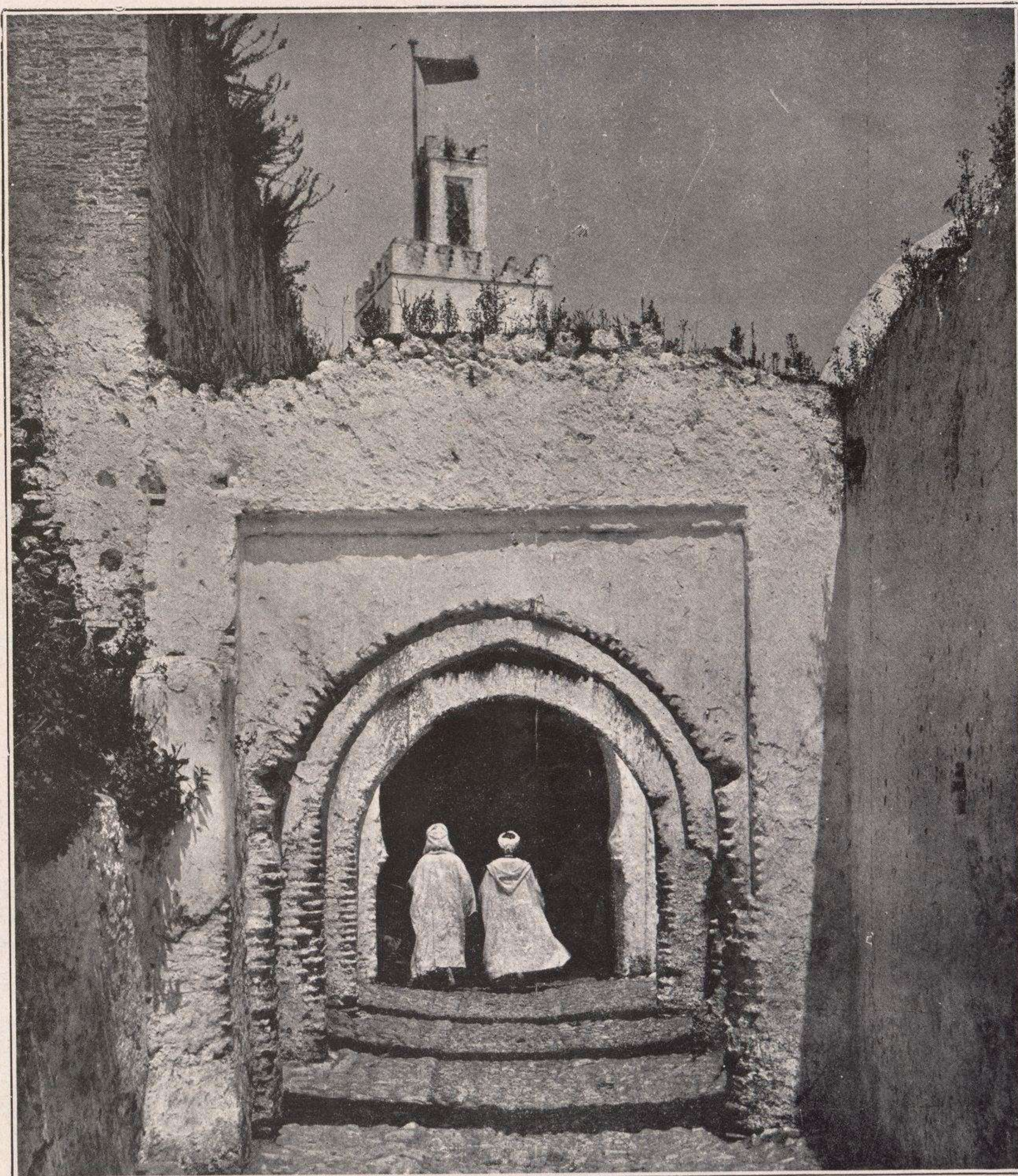
TETUAN (Marruecos español).— Mezquita de Sidi-Seidi