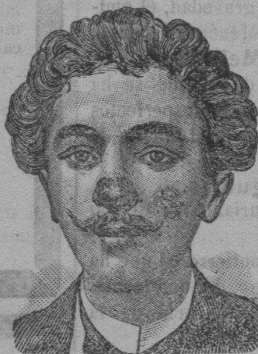
Antes de la curación.