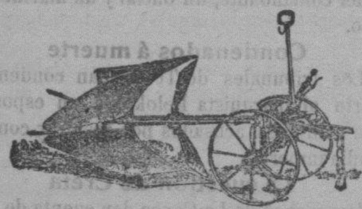
Arado Brabant doble Meteor