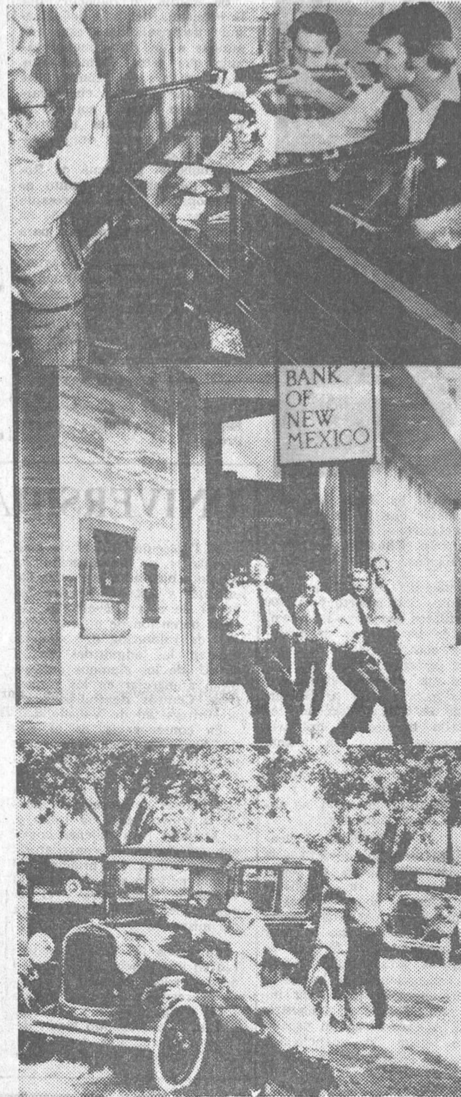
Trés escenas de películas cuyo denominador común es la violencia.

—Repartir panfletos donde están escritas las películas que resultan negativas para los niños y los jóvenes. Tenemos un programa en la radio que dura media hora. Este abarca todo el país, pues se transmite por distantes emisoras. En él se exponen los casos más tristes que suceden. Así logramos