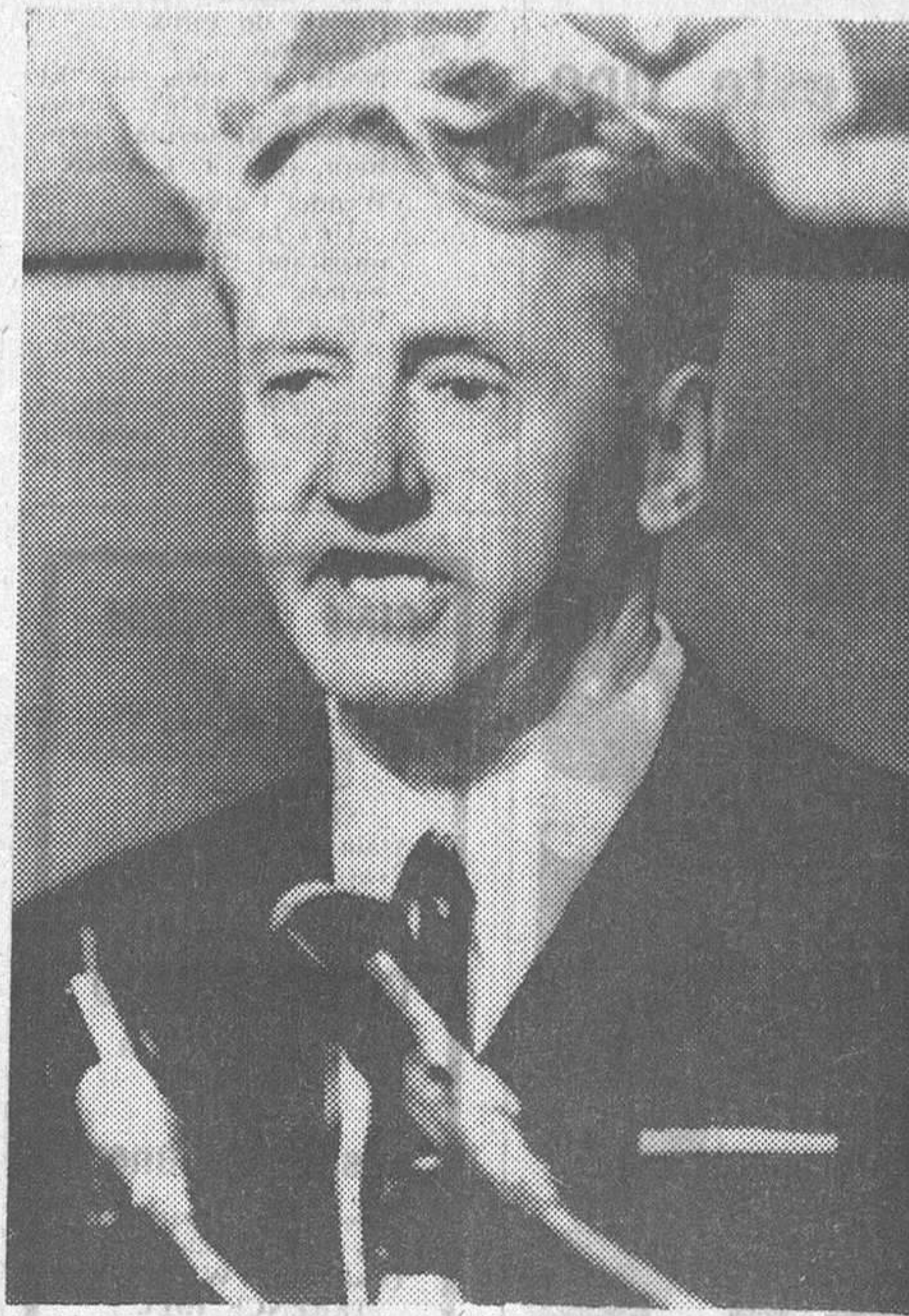
Ian Smith, primer ministro de Rodesia ha dicho que la situación actual del país es mucho mejor que la de ciertos países occidentales —y en especial Inglaterra— afectados por las consecuencias de la crisis del petróleo. Rodesia está solicitando un millón de inmigrantes blancos.

El ministro ha admitido que en Rodesia falta la mano de obra especializada, debido sobre todo, a la movilización en el Ejército y en Policía de numerosos reservistas, para asegurar la «seguridad interior» del país amenazada por los guerrilleros nacionalistas. Las estadísticas del Servicio de Inmigración dan cuenta además de que, en el pasado mes de Noviembre, las entradas de inmigrantes blancos sólo superaron en 64 a las «salidas».