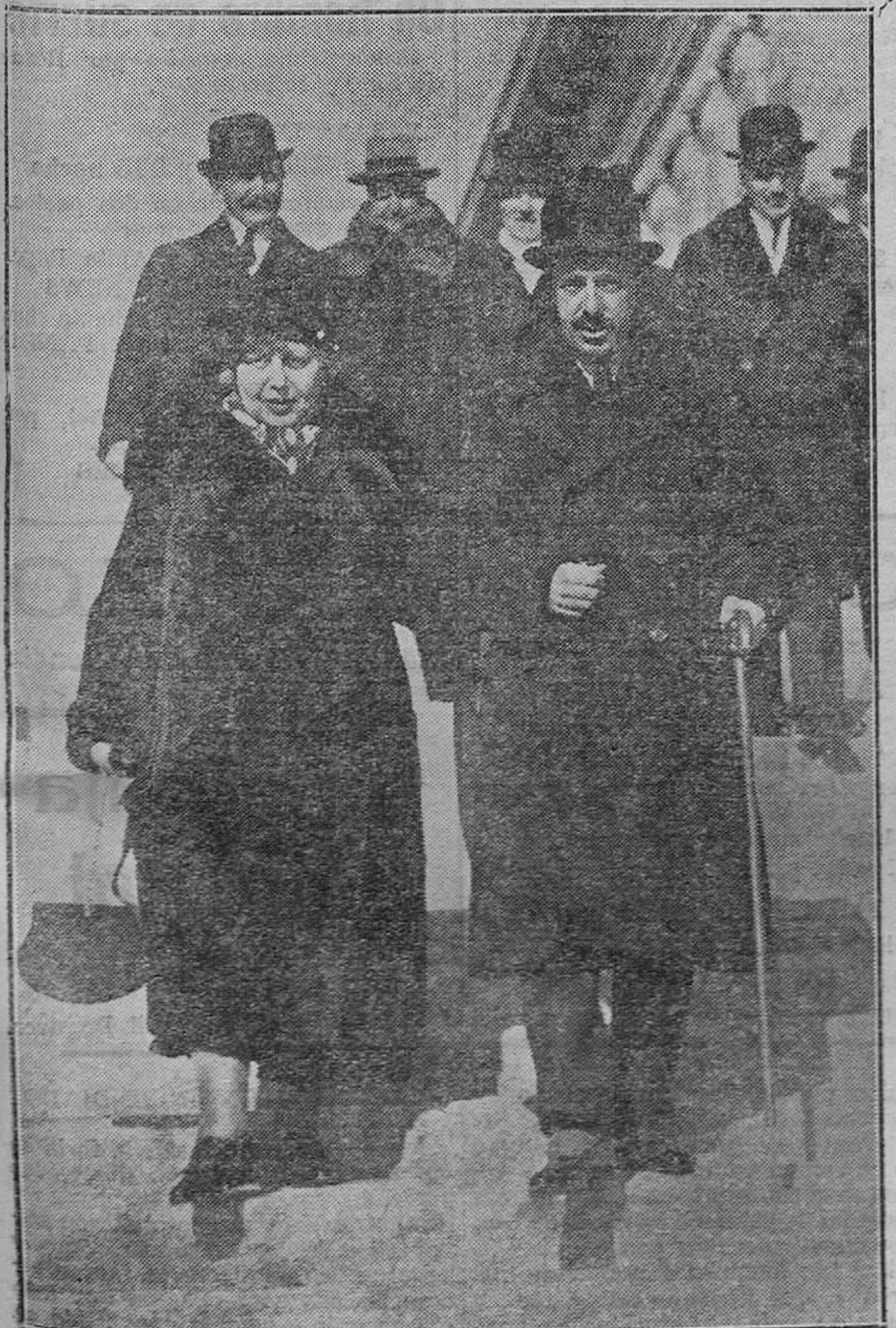
Su Majestad el Rey acompañando a la condesa en su visita a la Ciudad Universitaria en construcción (Pol, Contreras y Vilaseca, Madrid.)

El año 1930 no terminó bajo el emblema del olivo. La pacificación de los espíritus que se esperaba de la evacuación de la Rhenania no se ha logrado. Dos crisis confundidas, enlazadas—la crisis económica, la crisis política—gravitan sobre los pueblos de Europa y su gravedad es evidente. ¿Qué dará de sí, en estas condiciones la próxima reunión en Ginebra de sus principales representantes, a los que singularmente corresponderá la preparación de la última comisión del desarme?