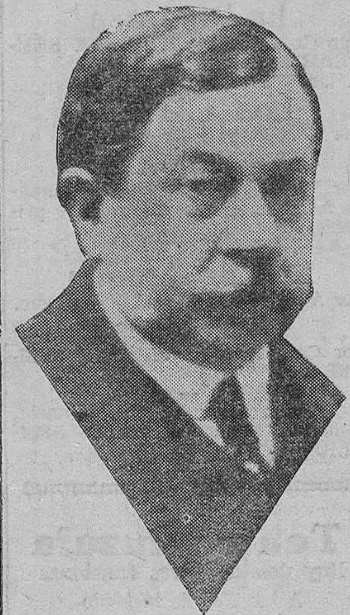
M. Paul Painlevé

herentes y regidos por la casualidad. Esto explica bastante bien el esfuerzo intelectual impuesto a los que quieren preparar eficazmente el porvenir. ¿Qué enseñanza para un humano cerebro si pudiera ver sucederse en una hora, con su fatal encadenamiento, los sucesos esen-