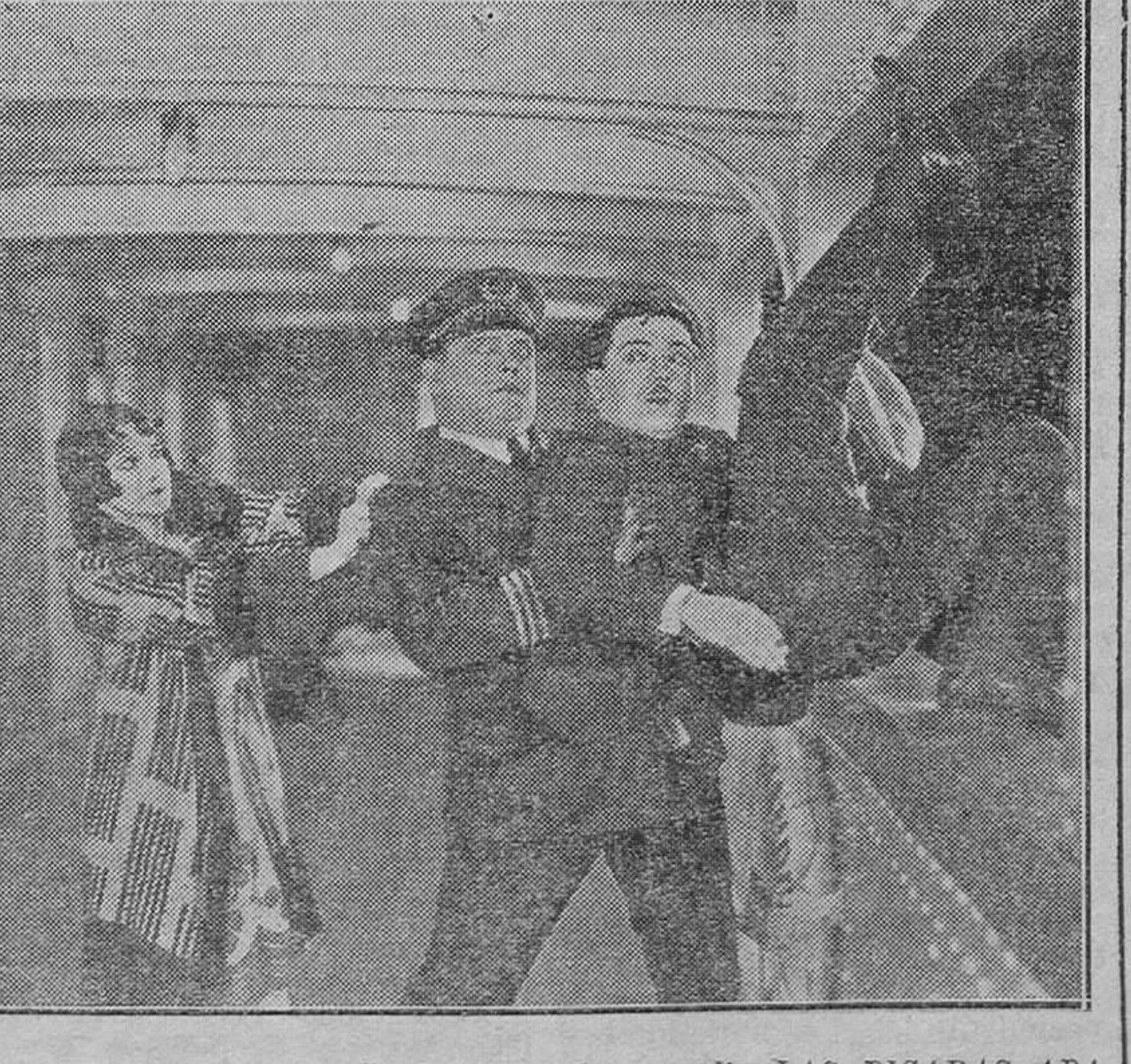
Una regocijante escena de la divertida comedia LAS PICARAS APARIENCIAS, en la que hacen las delicias del público los satúdsimos Monty Banks y Ruff Dwyer

"UNIVERSAL FILM" — la suprema narración bélica de — Erich María Remarque