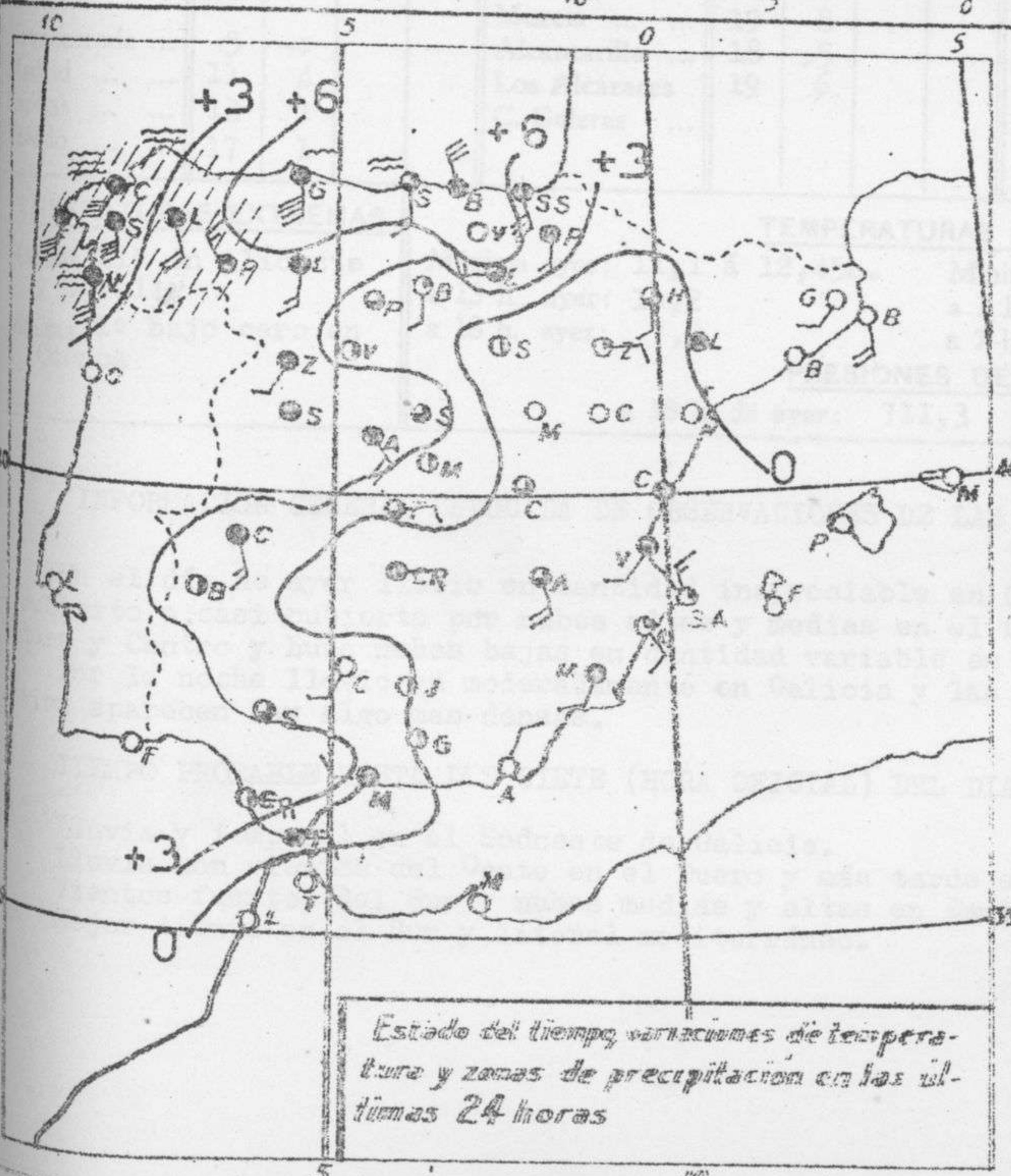
Estado del tiempo, variaciones de temperatura y zonas de precipitación en las últimas 24 horas