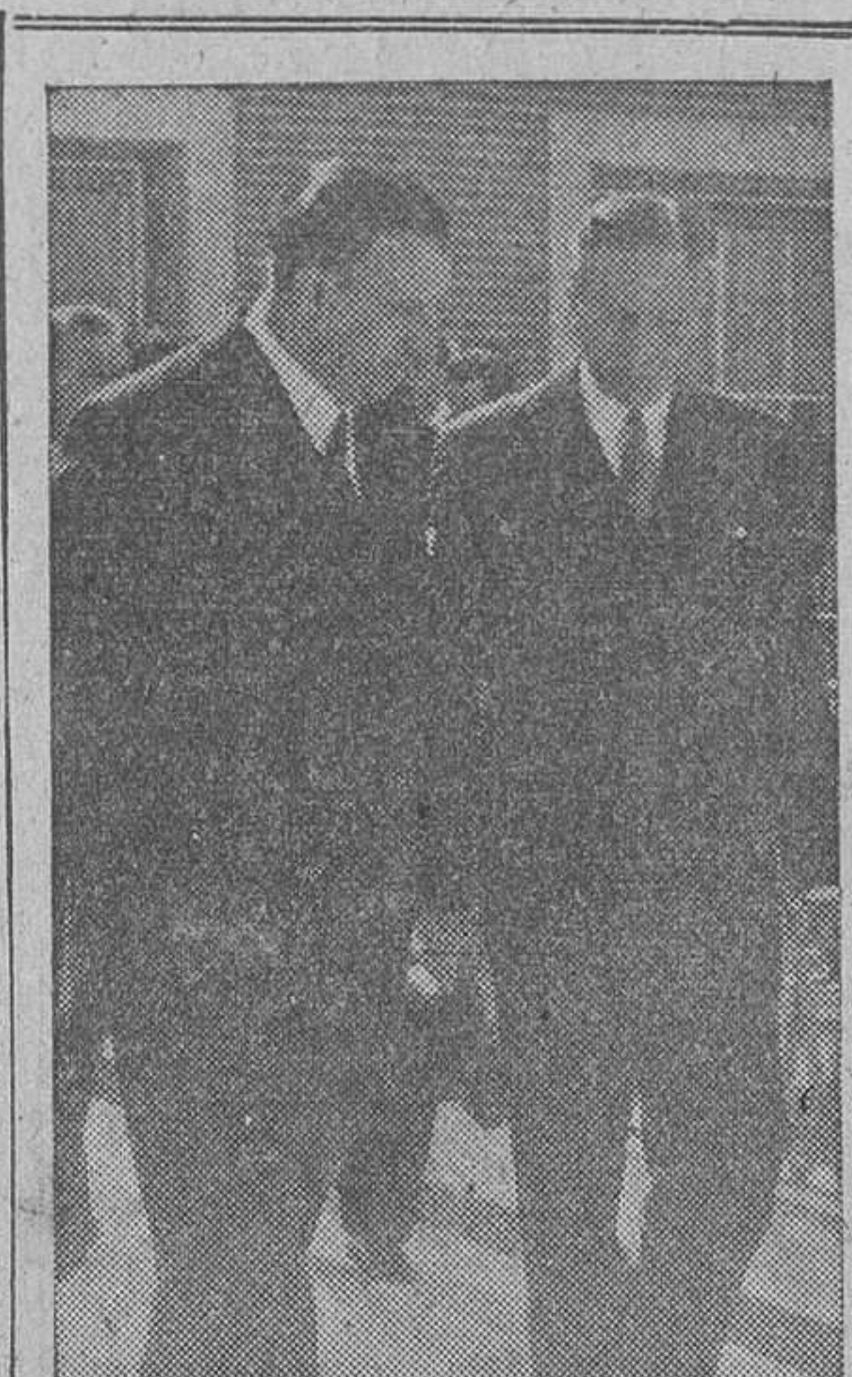
El ministro de Asuntos Exteriores y el embajador de los Estados Unidos, mister Norman Armour, recorren charlando las nuevas instalaciones de la Ciudad Universitaria inauguradas el Día de la Hispanidad. (Cifra.)

A las dos de la tarde se celebró en el palacio episcopal un almuerzo.—(Cifra.)