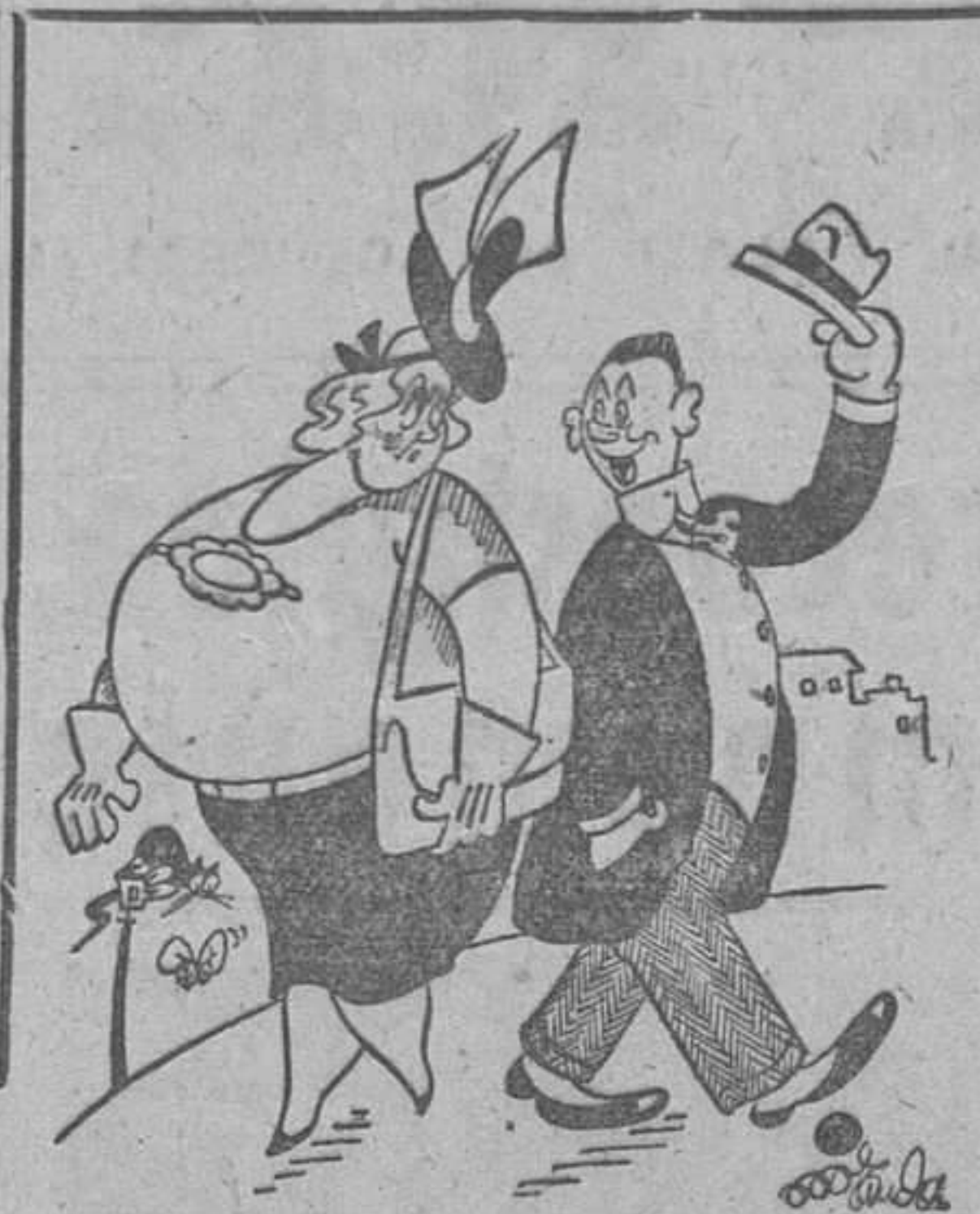
«DE PESO», por Miranda —Si... ¡no le conozco! ¿Por qué me saluda? —¡La veo tan «saludable».