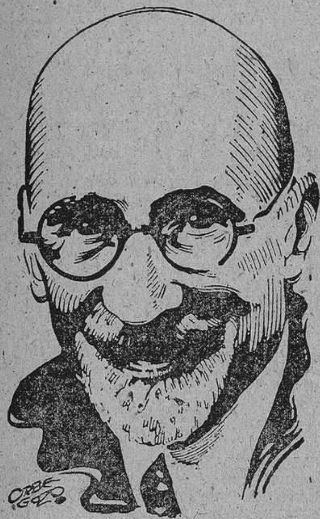
DON JACINTO BENAVENTE

La muchedumbre aclamó con extraordinario entusiasmo al insigne dramaturgo