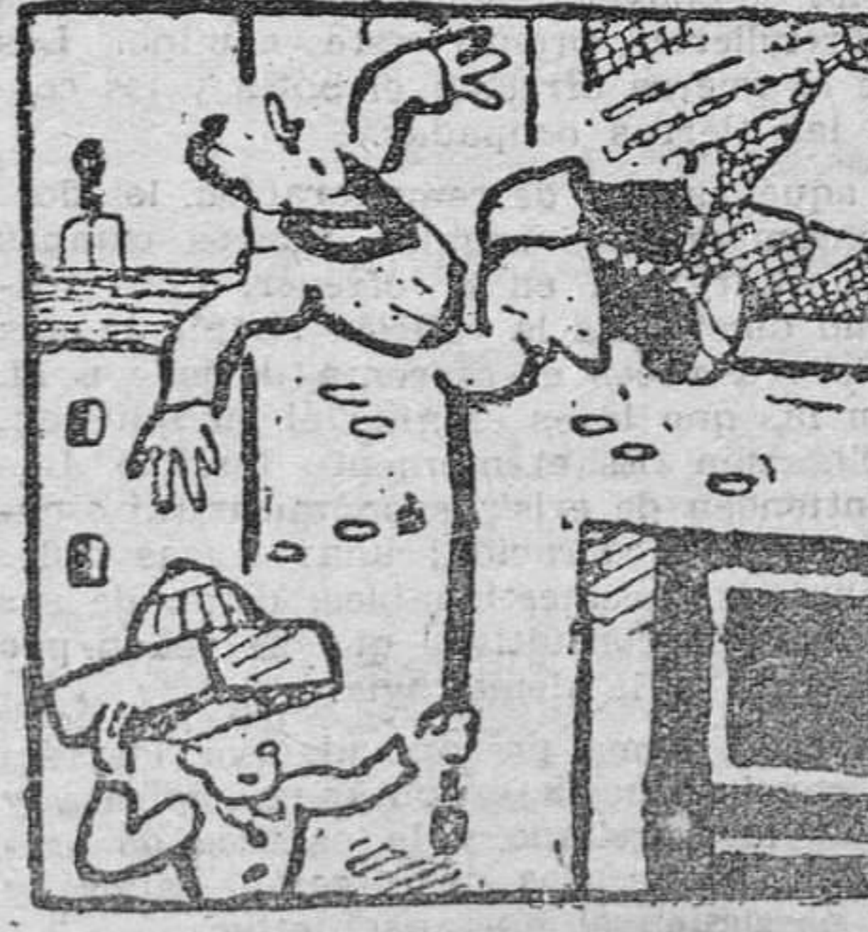
Que al ver colgando el cordón Le da un soberbio tirón.