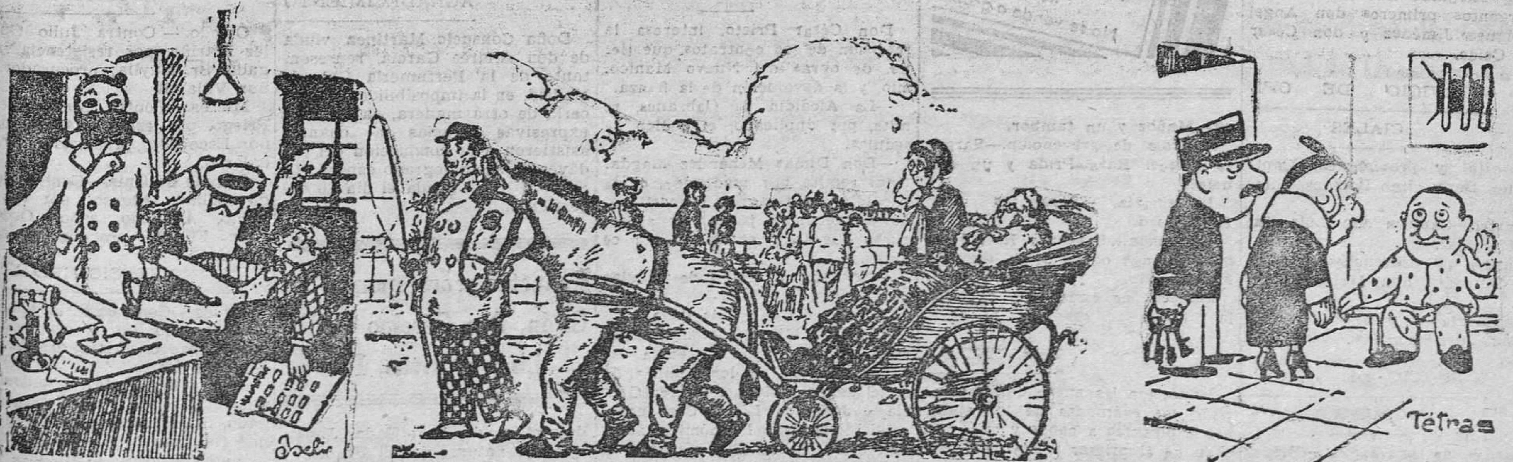
LA VISITA.—¿El principal, no está? EL BOTONES (fumando y tumado a la bartola).—Ya ve usted que no.

VEINTE MIL PESETAS importe de los diez títulos que tenía suscritos.