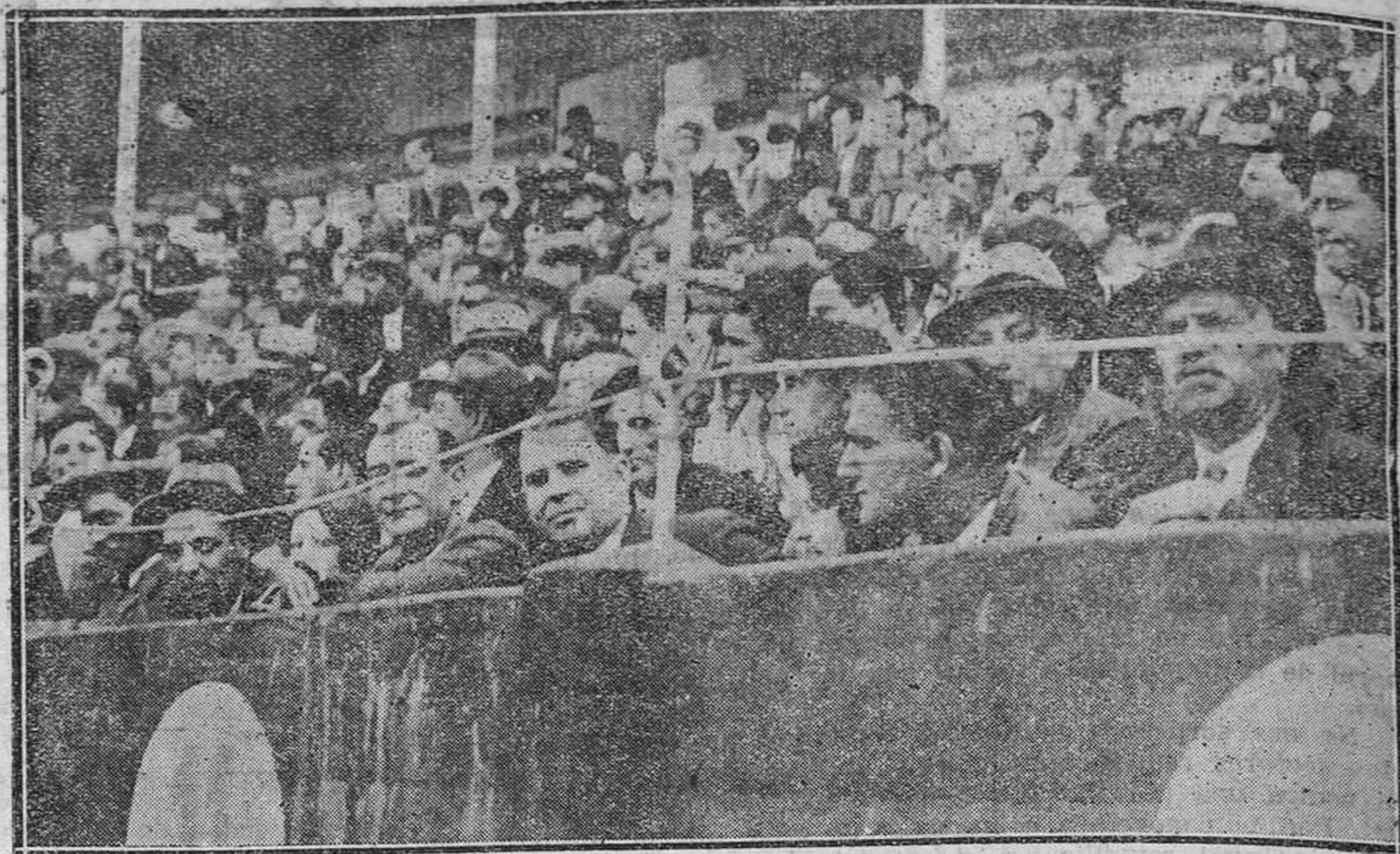
OVIEDO.—La novillada del pasado domingo. Un aspecto parcial de la plaza.

18,00 Festival Brigans. 19,30 Concerto variado. 19,45 "Miniaturas americanas". 21,20 Informaciones. 22,5 Música ligera.