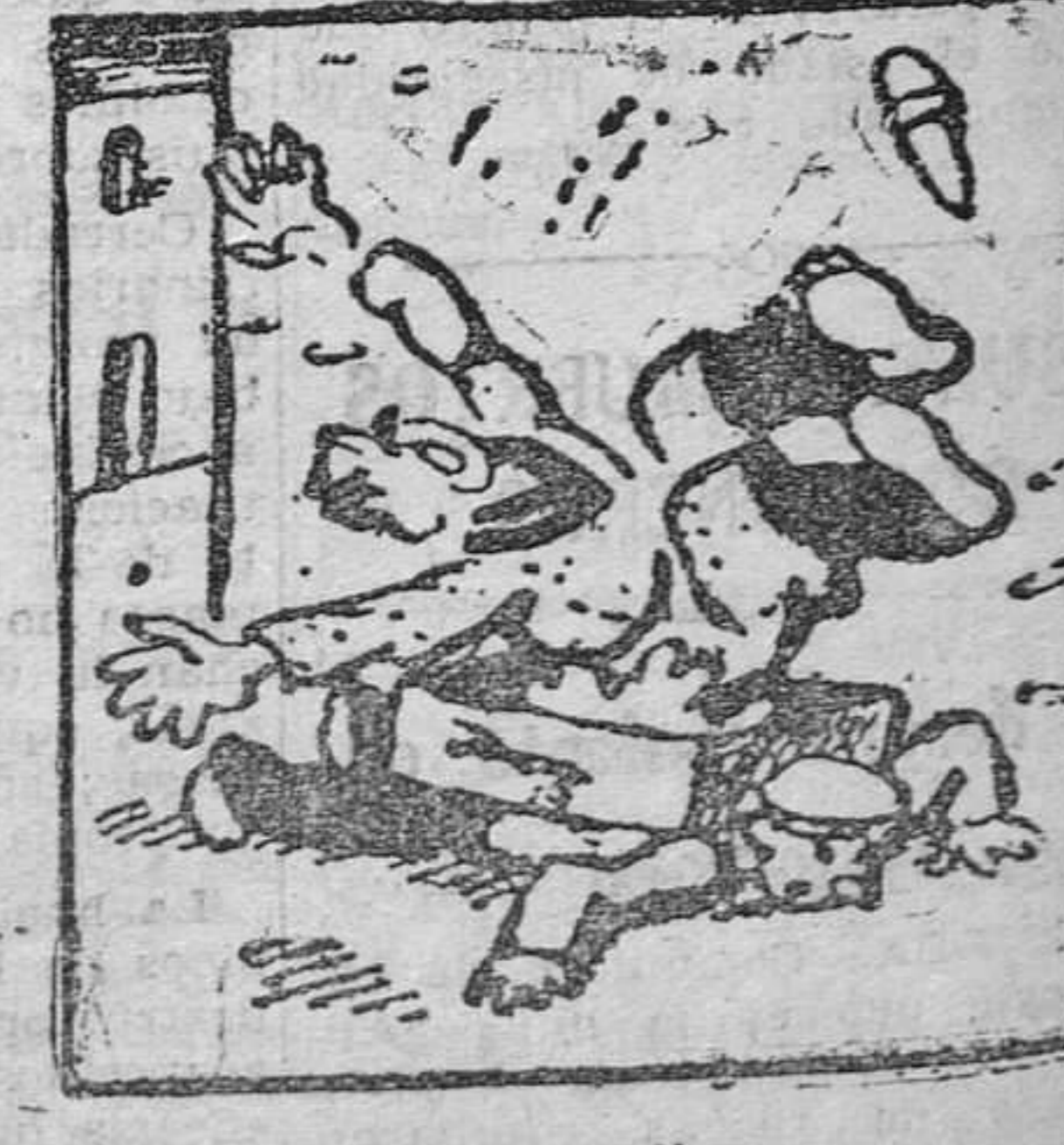
Y como justo castigo Le deja el otro echo un higo.