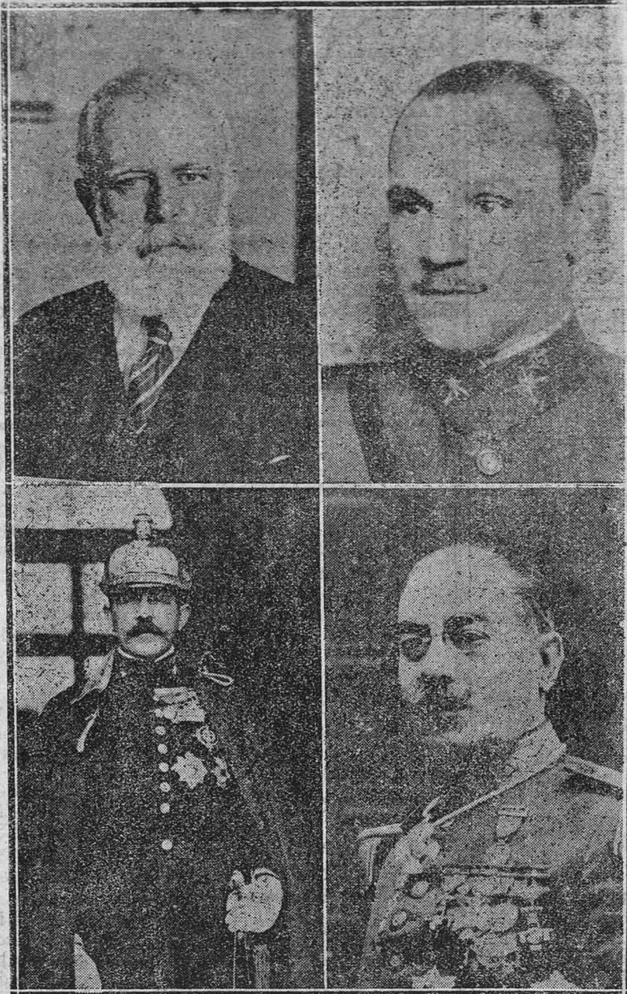
La actualidad está vinculada estos días a algunas figuras del Ejército. No se sabe lo que hay en el fondo de todo esto, pero lo cierto es que hay un general arrestado, un teniente coronel en Prisiones militares a causa de un incidente en un campamento de Madrid y tres generales destituidos. Por eso traemos hoy a esta sección las fotos de los generales Goded, Cabanellas, Villegas y Cavalcanti.