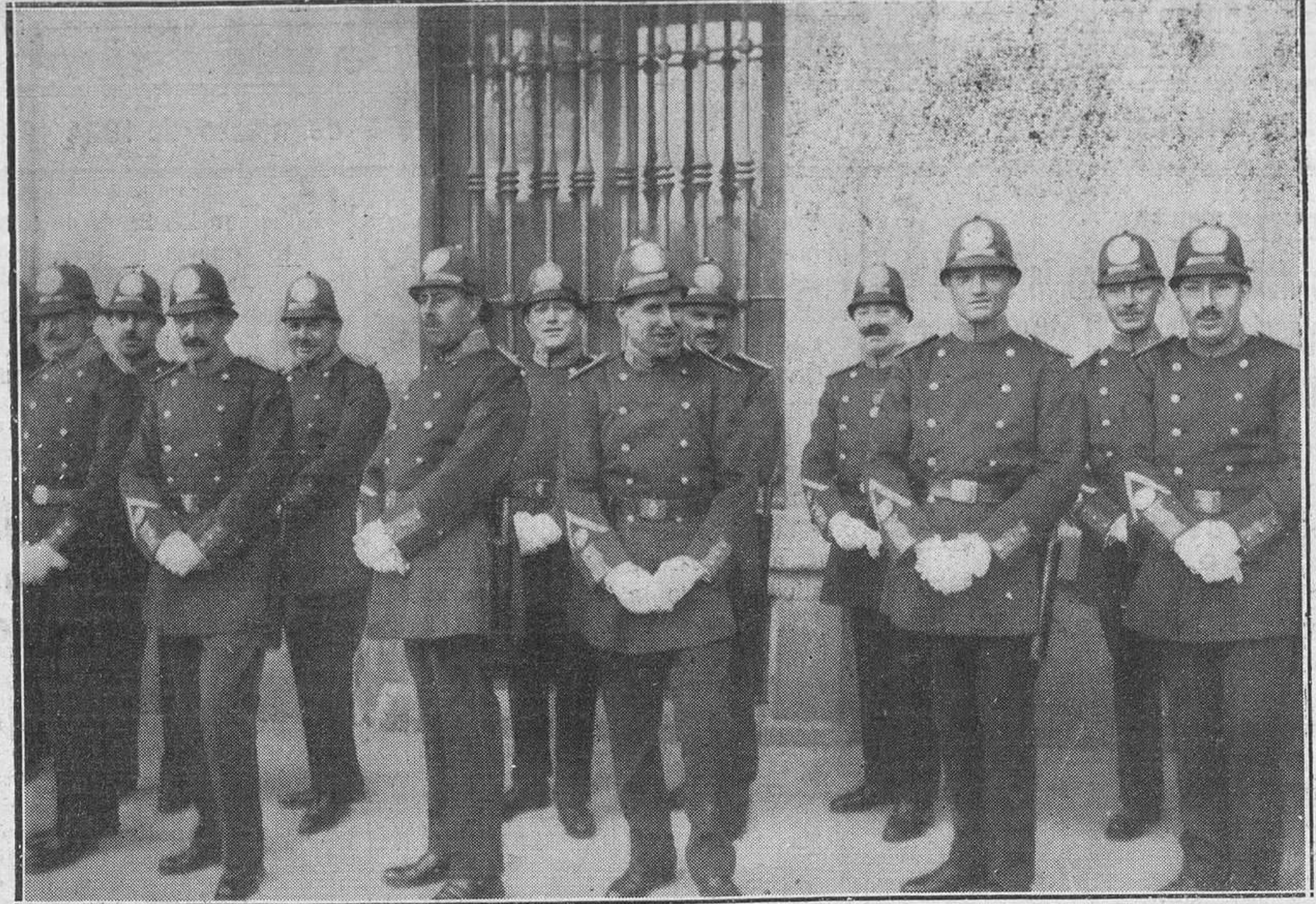
MADRID.--Grupo de la Guardia urbana con el nuevo uniforme.

***** El Progreso Fotográfico Optica medical, lentes, gafas, etc. Estandalera, 6 -- OVIEDO -- Teléfono 808