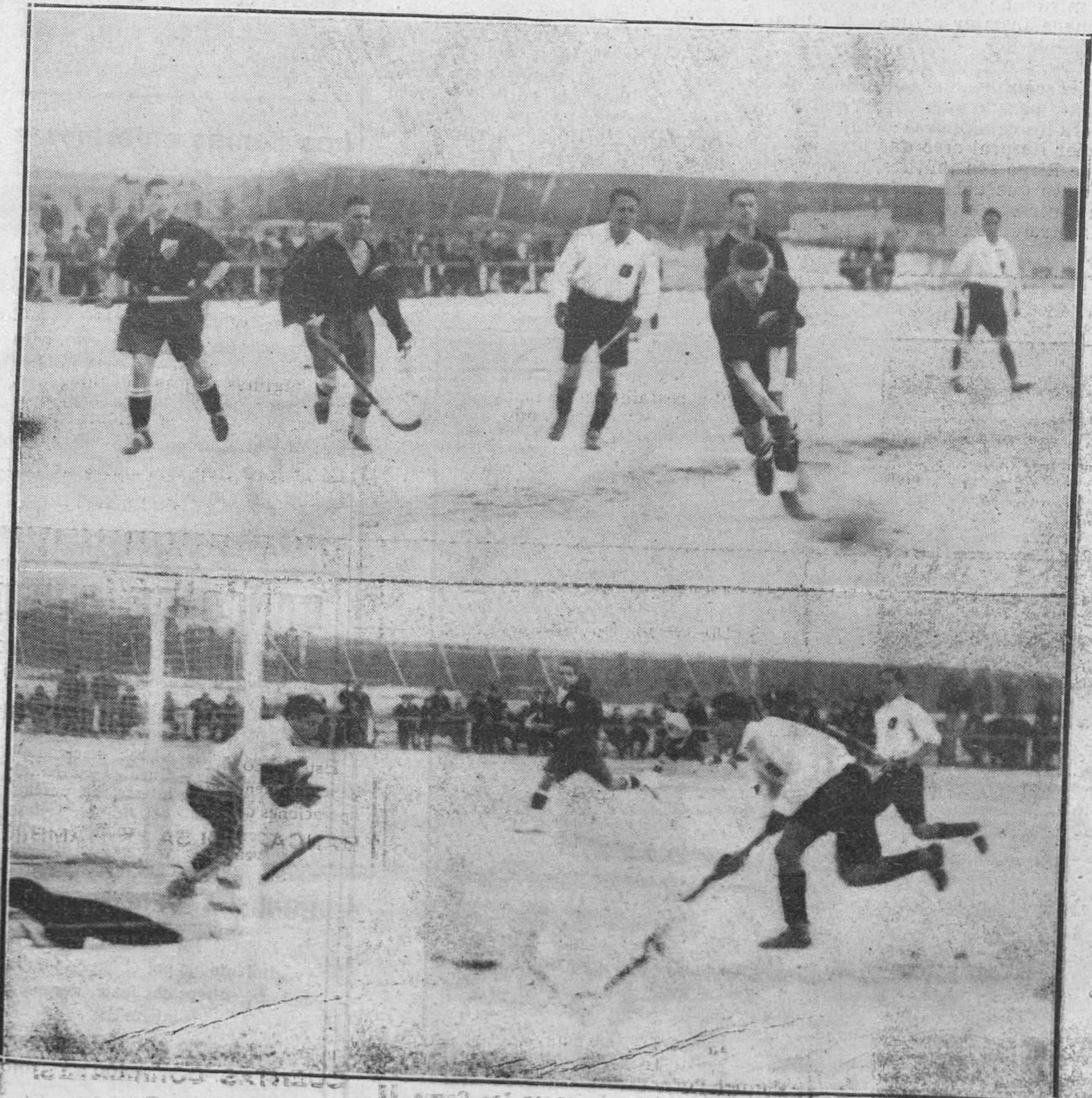
MADRID.—Dos momentos del partido de hockey, de campeonato de España, jugado entre "Alicante" y "Real Polo" de Barcelona