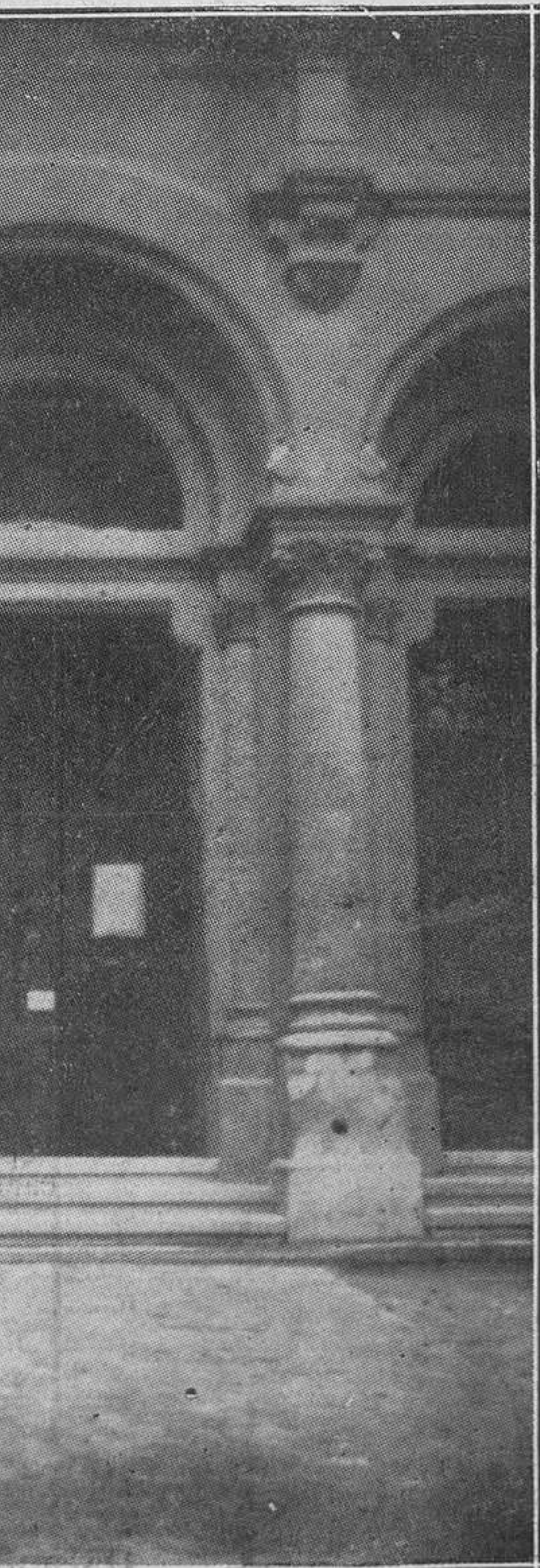
MEMENTO HOMO...--Después de haber tomado la ceniza en la iglesia de San Juan.--

◊ Pasó ayer el día en esta capital nuestro muy querido amigo el arcipreste de Luanco don Faustino Suárez.