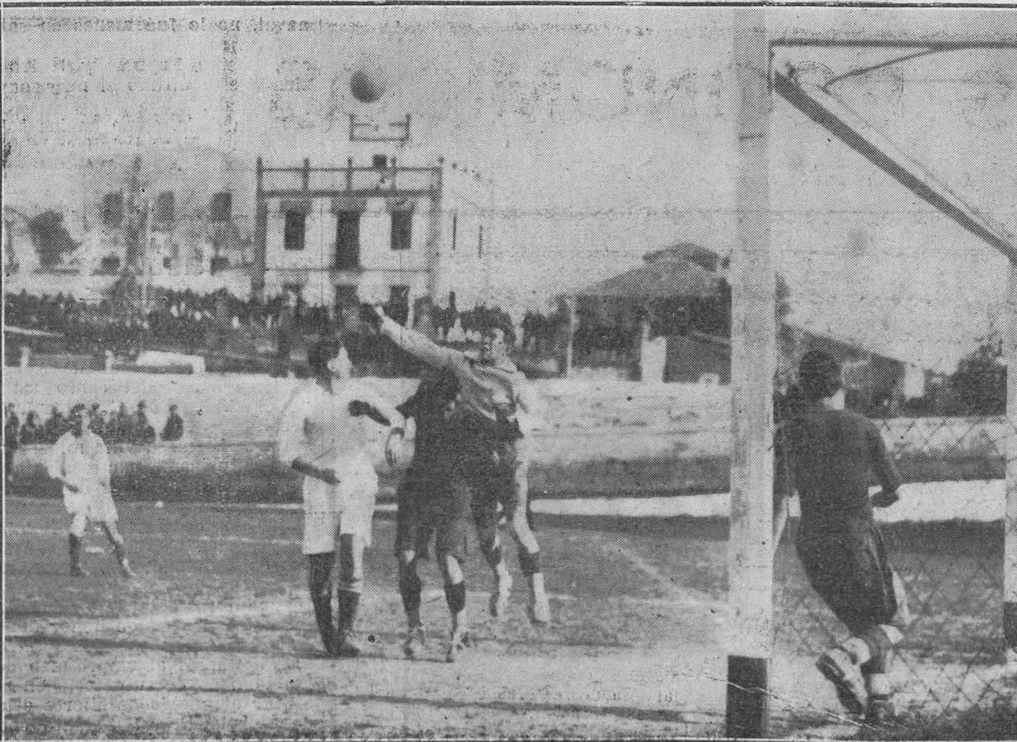
FUTBOL EN MADRID. Un momento del partido de campeonato jugado entre los equipos "Madrid" y "Unión".