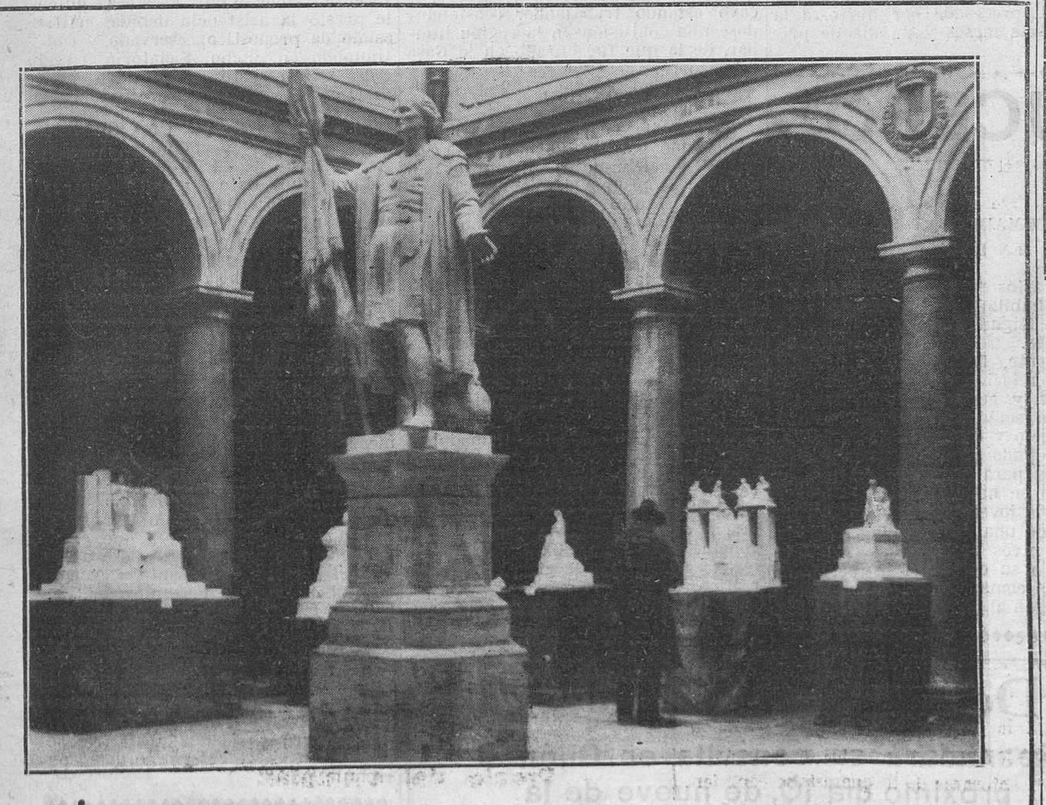
MADRID: EN EL MINISTERIO DE ESTADO. Aspecto de la Exposición de proyectos de monumento a la condesa de Pardo Bazán.