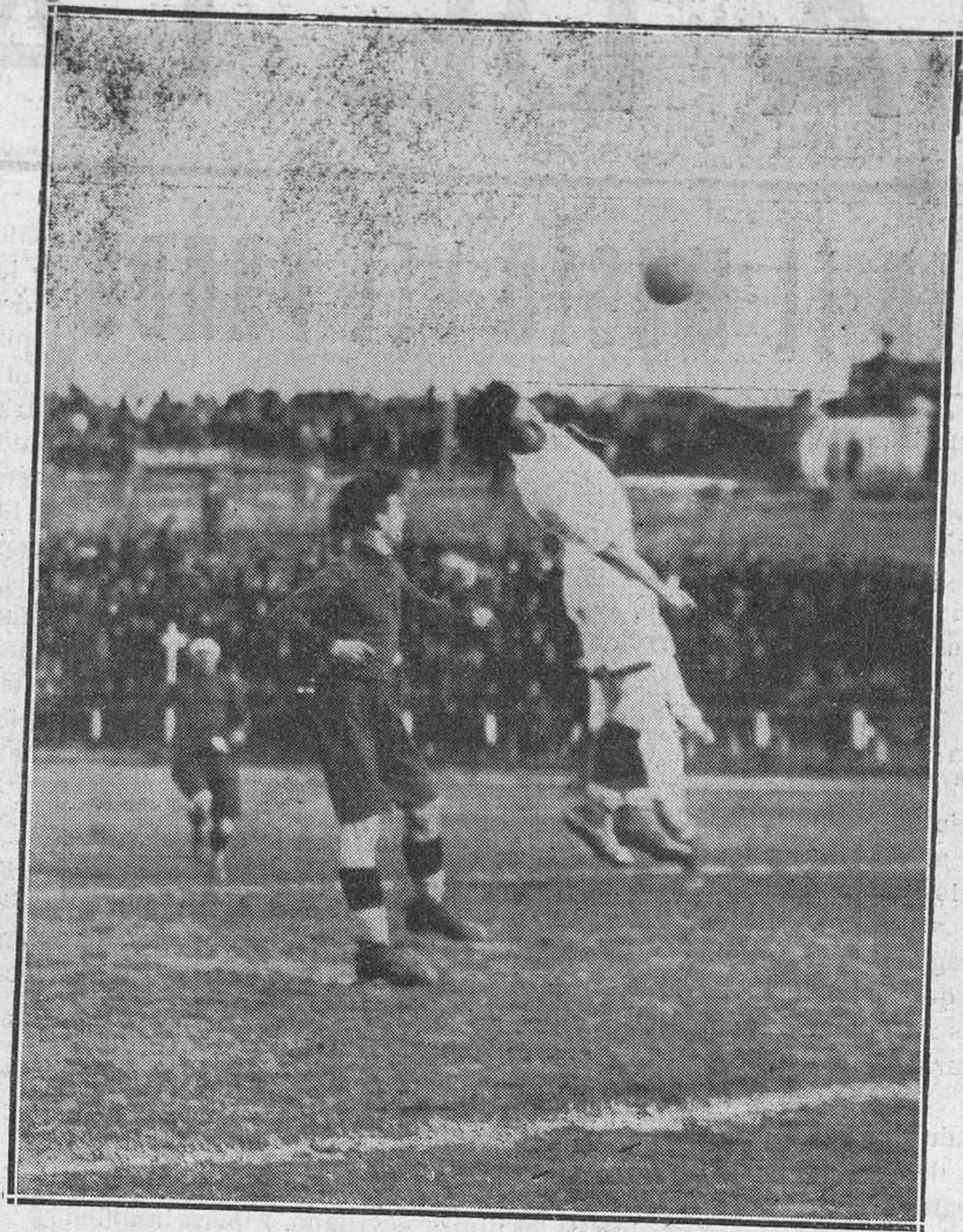
FUTBOL EN MADRID.—Un momento del partido de campeonato jugado entre los equipos "Madrid" y "Unión".