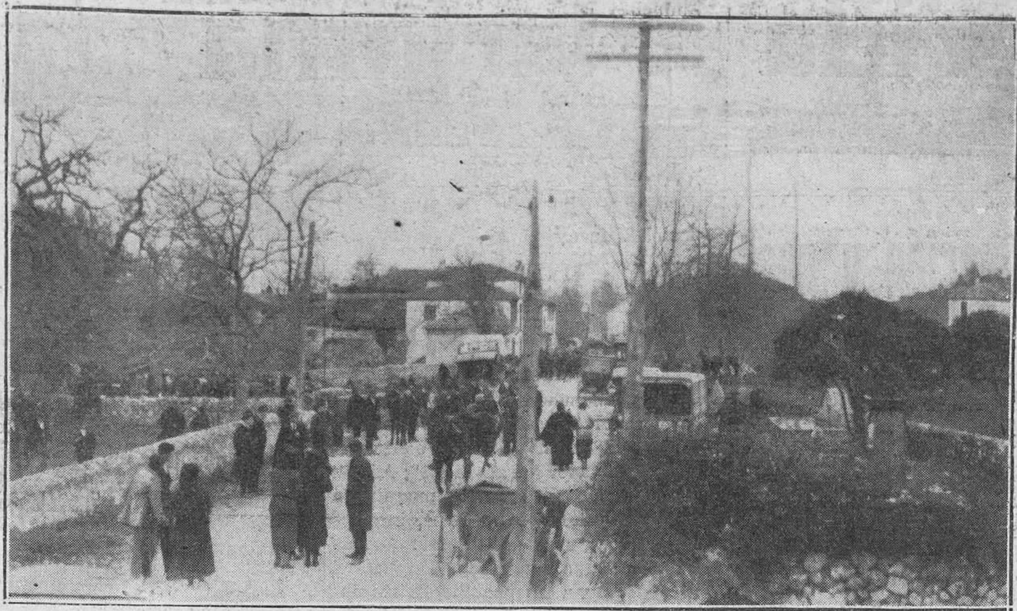
ASPECTOS ASTURIANOS: BALMORI (LLANES).—La principal calle del pueblo en día de feria

Segunda. Dicha declaración habrá de hacerse necesariamente a esta De-