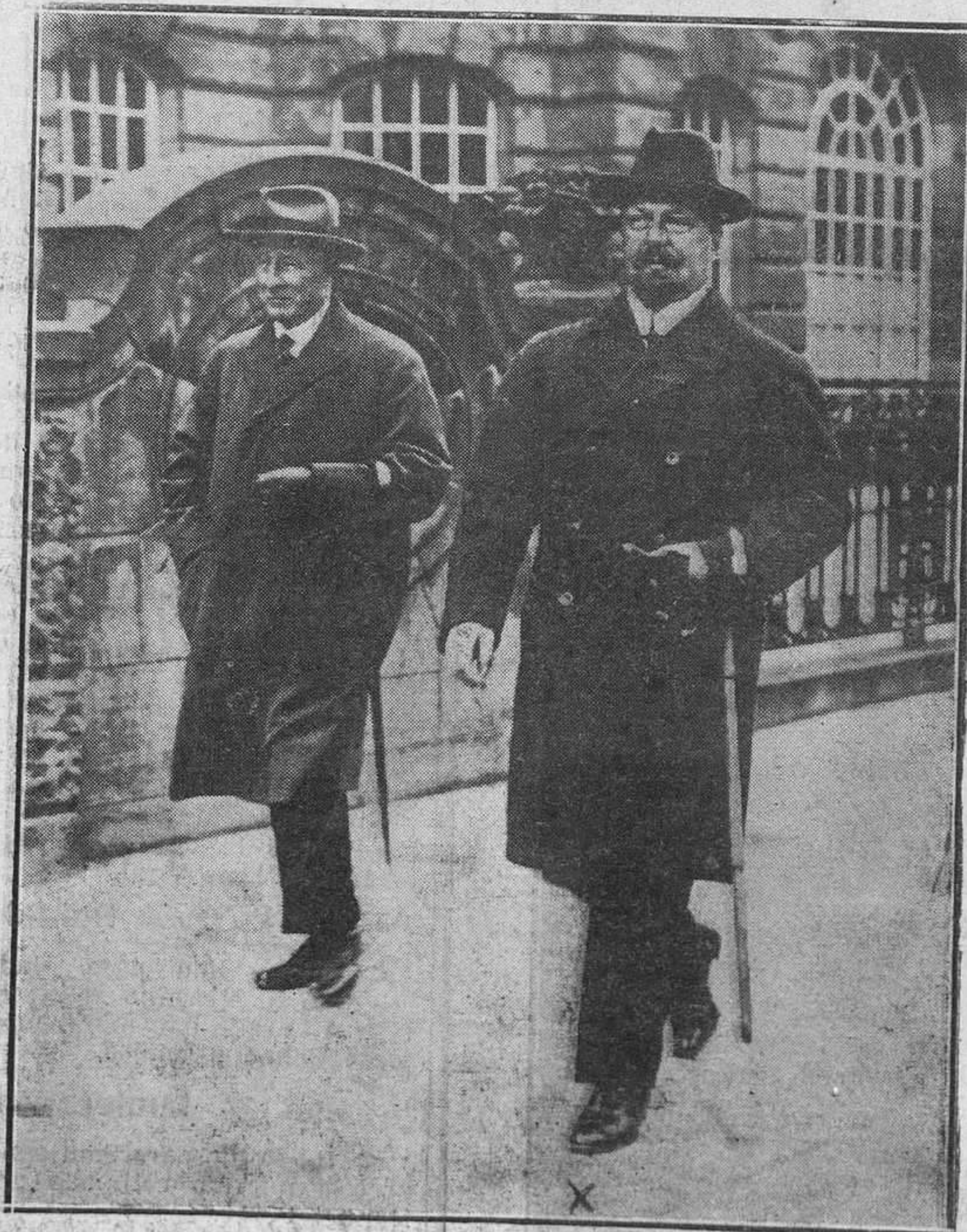
El príncipe Enrique (X), esposo de la Reina Guillermina de Holanda, que llegará a España hoy jueves

Si eres periodista, verdadero periodista, debes pedir a Dios, por tu propia conveniencia, que haya muchos periódicos y que todos ellos vivan lo mejor posible. Periodista que desea la muerte de un periódico se pondrá al nivel del albañil que descansa que no se construyeran casas.