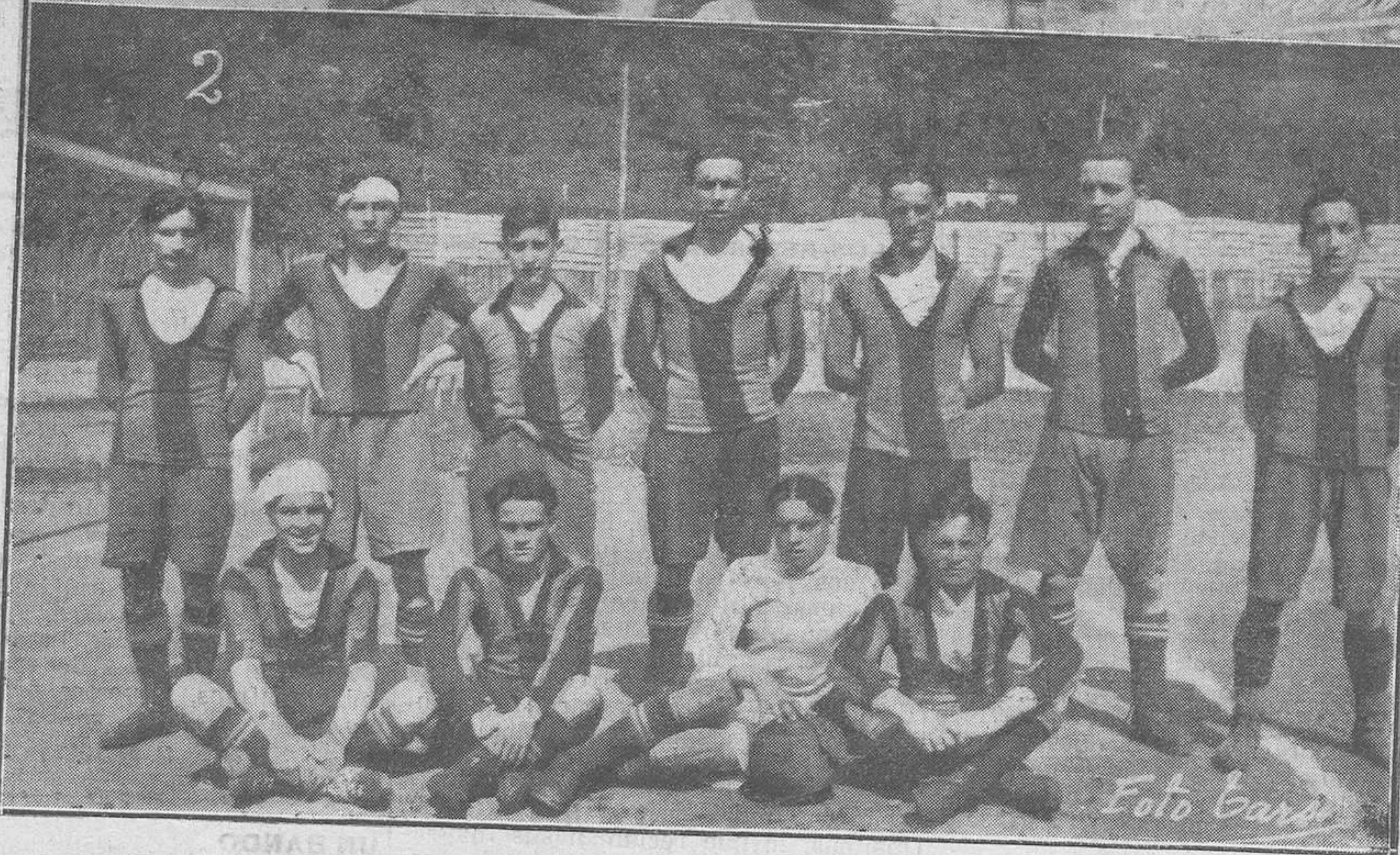
MIERES.--(1) Capitán del "Príncipe", señor Rivero, árbitro colegiado, y capitán del "Racing", de Mieres, en el partido del domingo último, al escoger campo.--(2) El "Príncipe de Asturias" (equipo de segunda categoría), futuro campeón del grupo D del campeonato de segunda categoría de 1924. Ambos equipos son de esta localidad.

las curvas, que parece que los montes se interponen y que no vamos a poder seguir adelante.