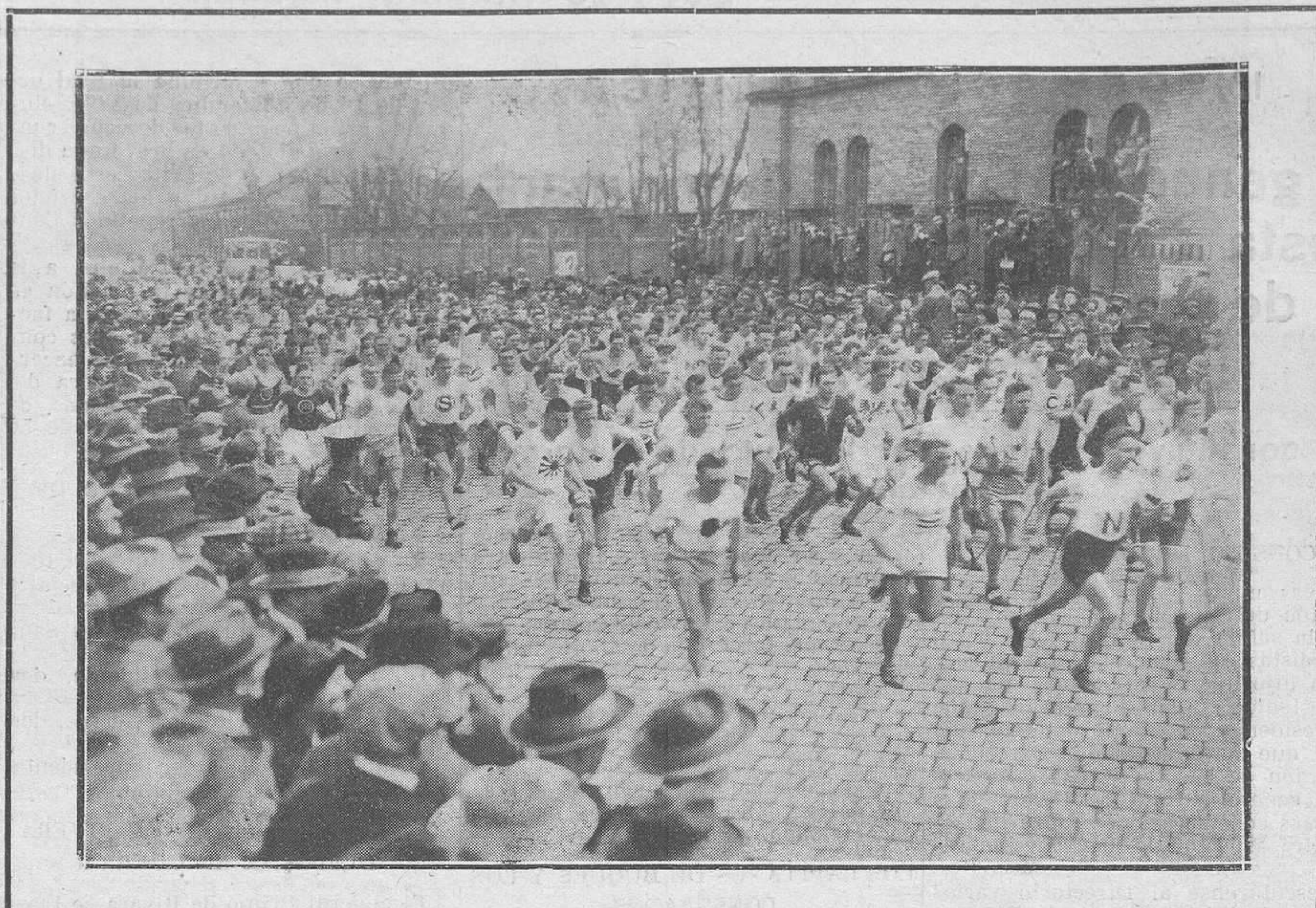
DEPORTES HIGIÉNICOS. --Durante una carrera de veinticinco kilómetros a pie, en Berlín.

El doctor me confía—dice—un cáncer de seno, y yo