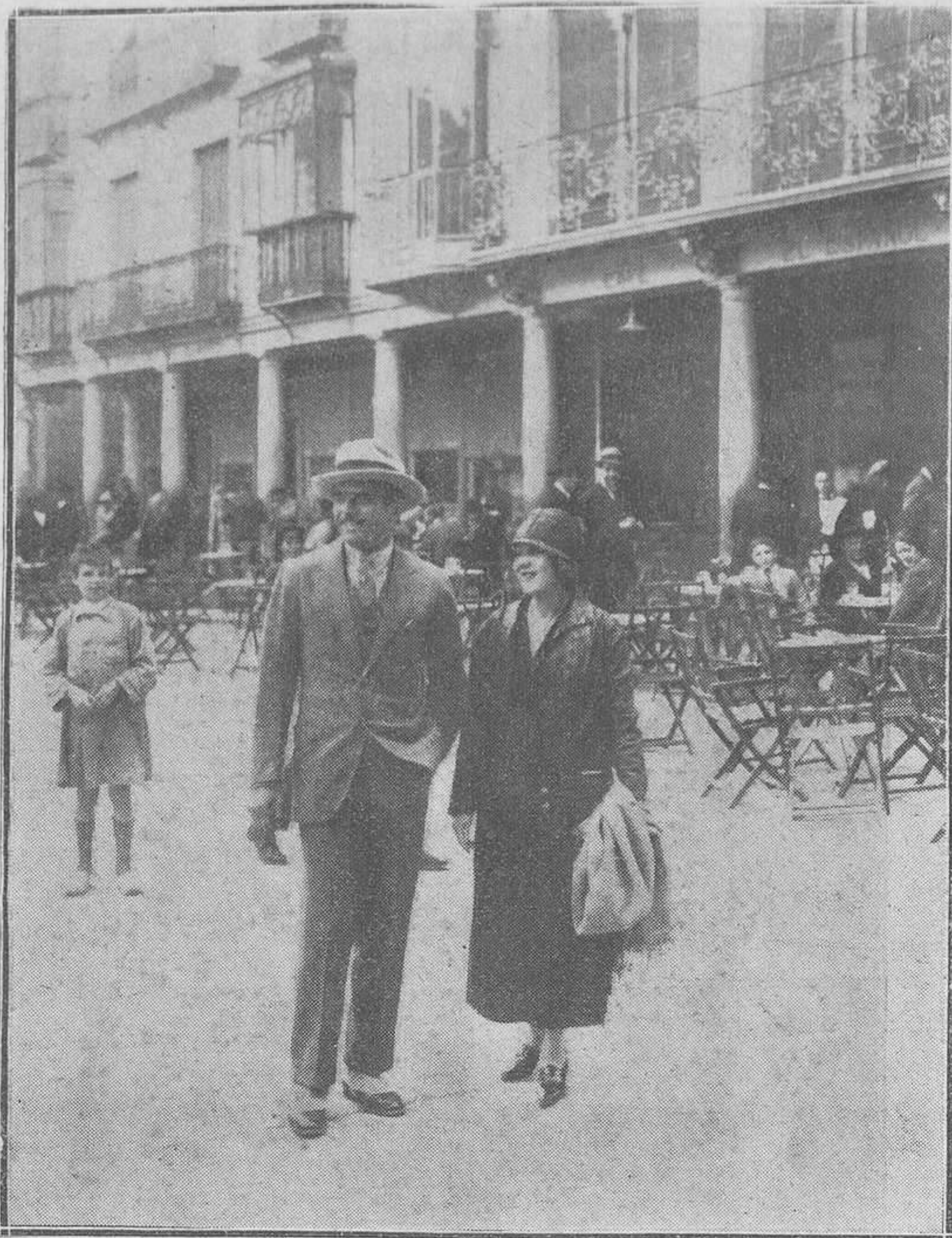
MARI PICKFORD Y DOUGLAS FAIRBANKS, EN TOLEDO.--En la plaza del Zocodover

Aprobado por el Ayuntamiento en pleno el presupuesto ordinario que ha de regir para el próximo ejercicio económico de 1924-25, queda expuesto al público, durante el plazo de quince días que determina el estatuto municipal, para que en ese tiempo, y en el de dos días más que para esta vez preceptúa la Real orden de 10 de abril del corriente año, puedan formularse legalmente las reclamaciones que se