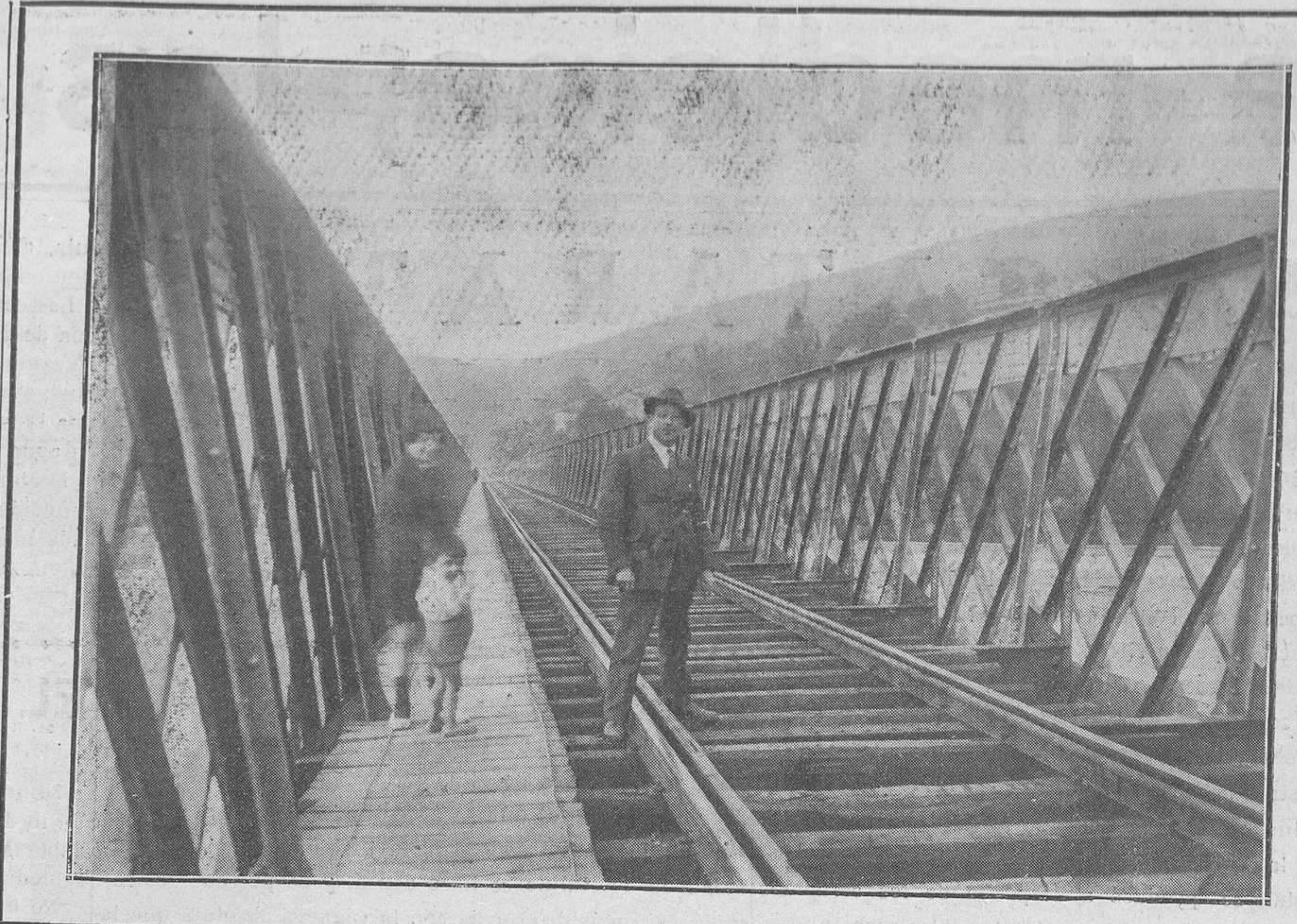
ASPECTOS ASTURIANOS: TRUBIA.--Puente del ferrocarril del Norte.

A las ocho y media, el Cuadro artístico pondrá en escena el chistosísimo