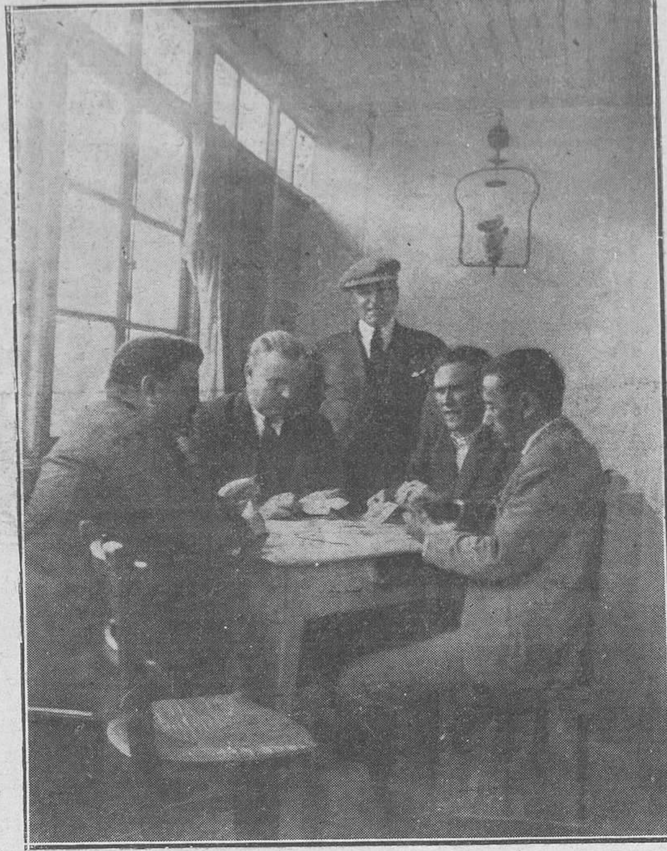
TURÓN: DE LA EXCURSIÓN DEL DOMINGO.—Después de la comida, la imprescindible partida de "mus".

ambos equipos, se verá el campo lleno de aficionados, pues hay que tener en cuenta que el Español es el campeón de su categoría en Gijón, y el Fortuna pocos serán los aficionados que no le conozcan por sus brillantes victorias.