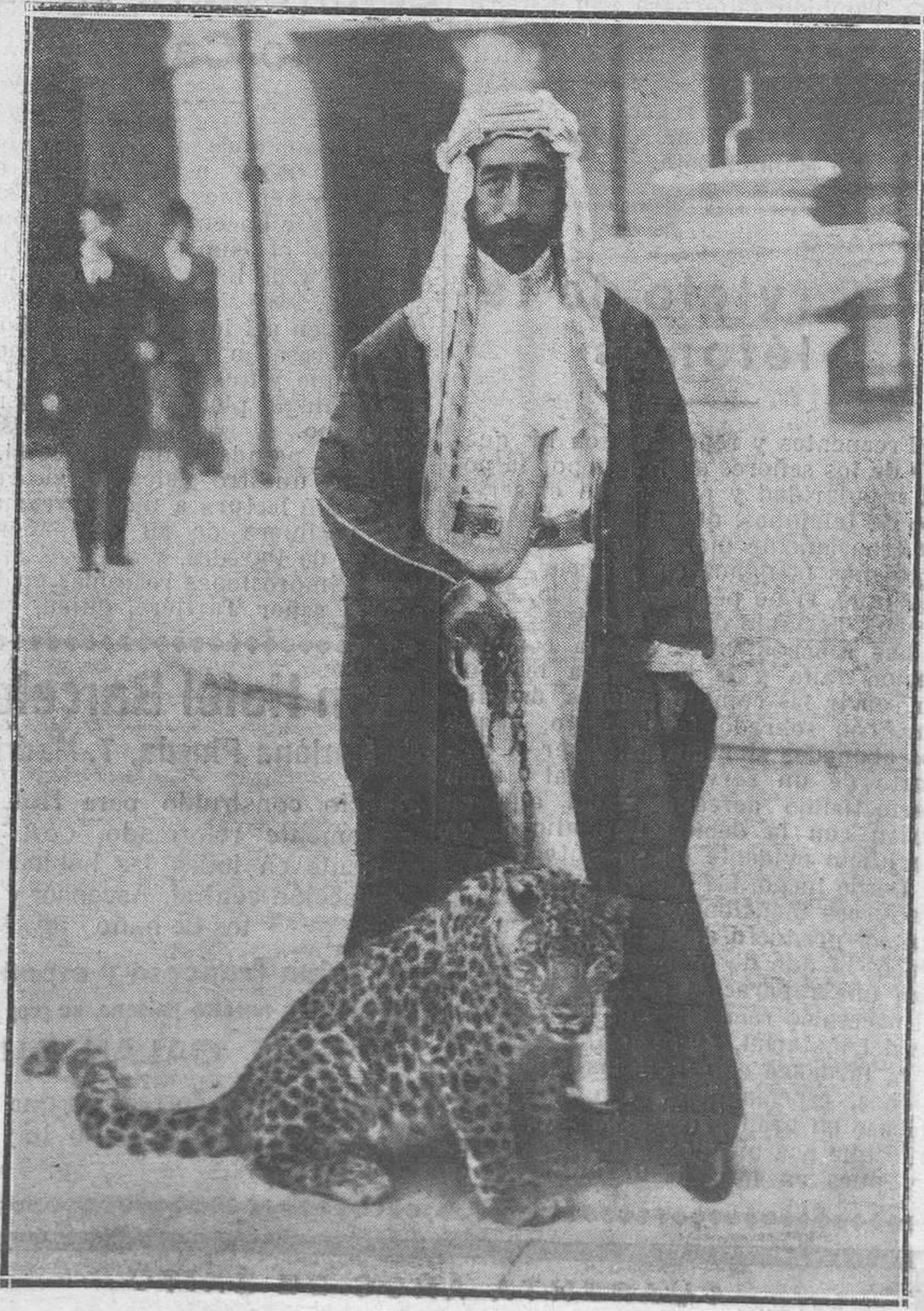
El Rey Feisal, del Irak, que actualmente se encuentra en París, con su pantea favorita. Esta fotografía ha sido obtenida en su palacio de Bagdad.

A los que te persiguieren o calumniaren, no les muestres resentimiento, ni les pagues en la misma moneda. Te pondrás a su altura. ¡Cuánto más vale recibir ingratitudes que fallar a los miserables!