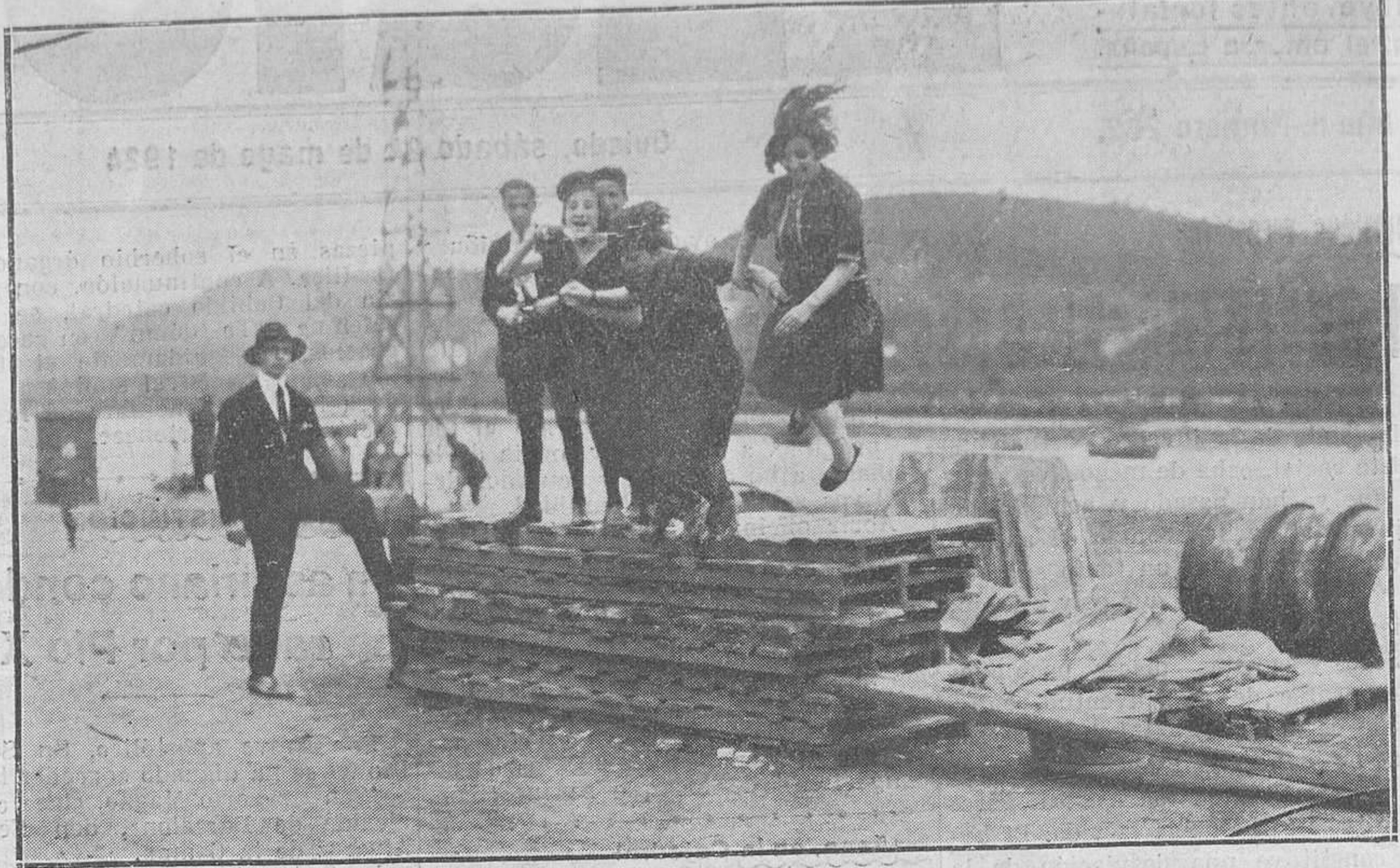
AVILÉS.--Niñas jugando en las cercanías del Muelle local.

La distinguida esposa de nuestro digno juez municipal ha dado a luz un robusto niño. Con tan feliz motivo, las familias de Robés y Campo, a