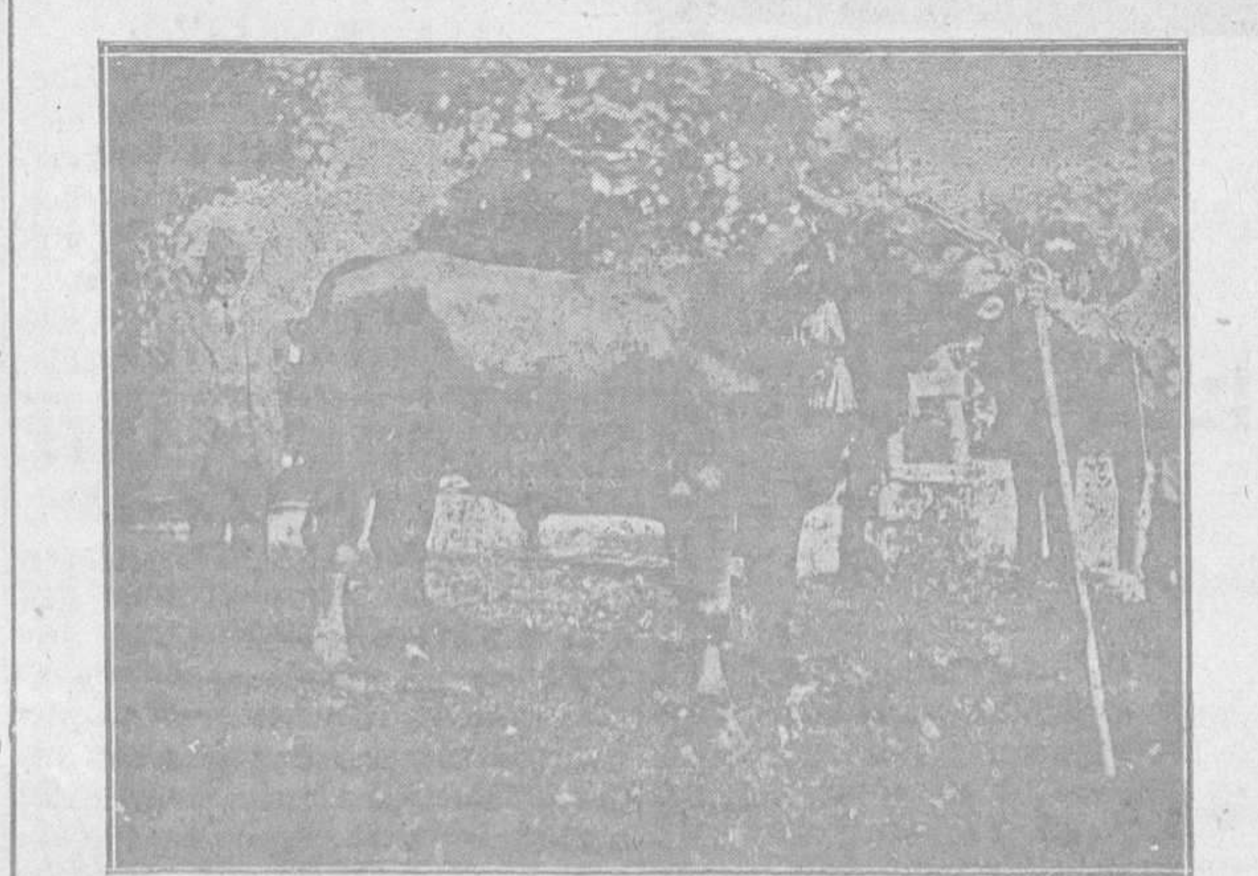
MUROS DEL NALON.—Toro de raza suiza, de 22 meses, llamado «Wirfar», donado por la Diputación provincial y que posee la Asociación de Labradores de esta villa. Como se ve, el animal no está mal cuidado.

Reciban los agraciados nuestra cordial enhorabuena y que la suerte siga "picando".