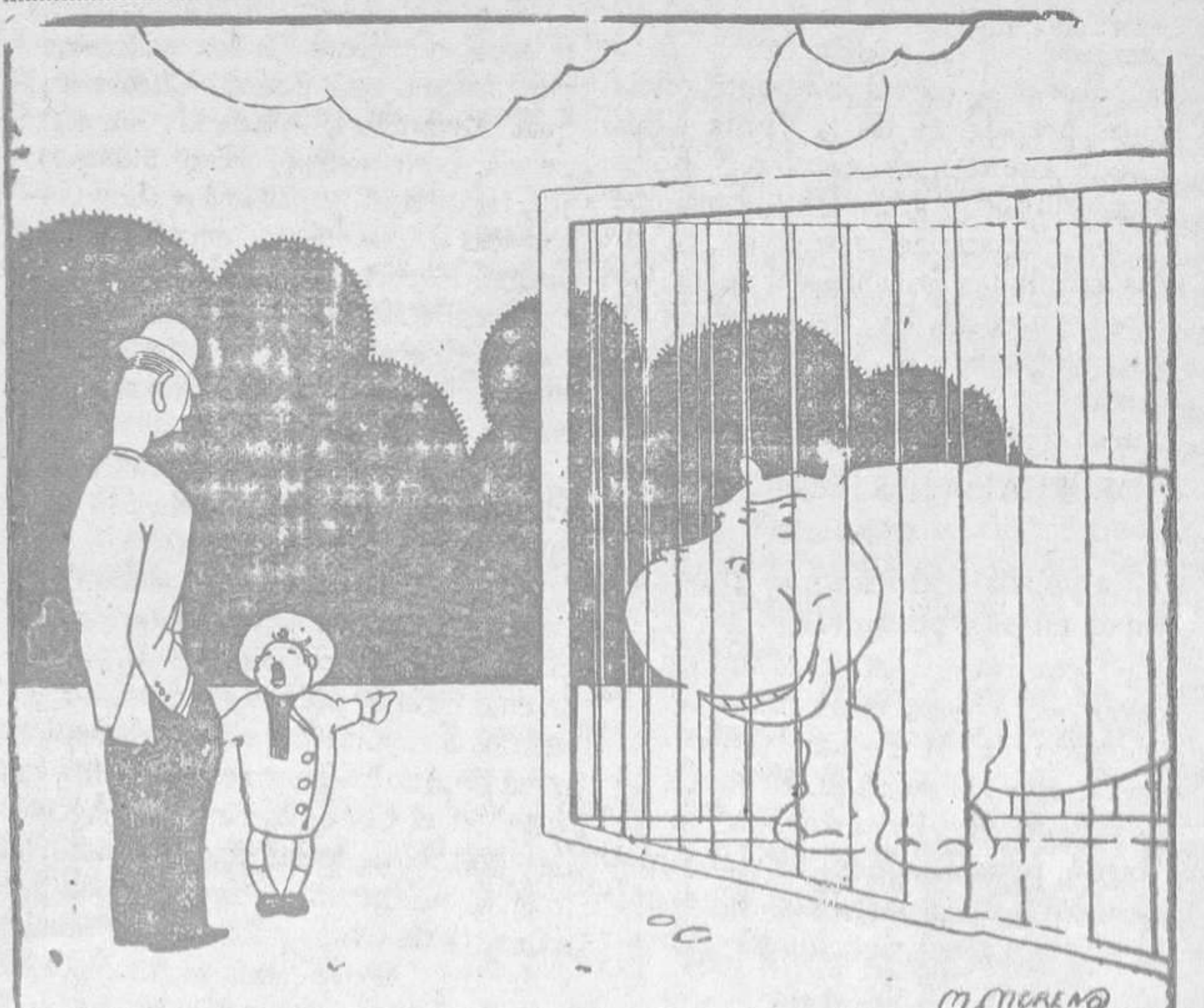
EN LA CASA DE FIERAS

Nueva York.—Anoche se celebró el combate anunciado entre Kid Chocolate y Hermán Silverberg. Chocolate venció al primer round por K.O.