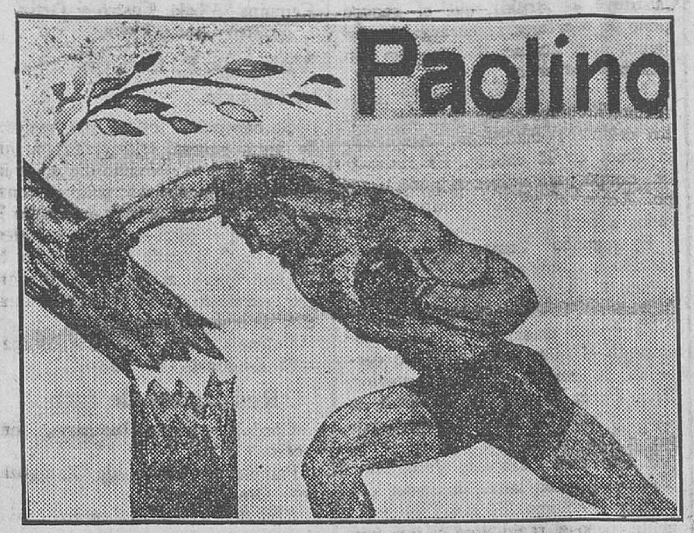
Cómo han anunciado el match Uzcudum en Berlin.