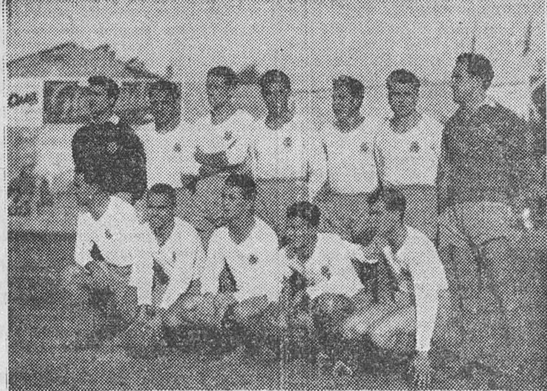
El equipo del C. de F. Girona, que brillantemente se ha clasificado campeón del VI Grupo de III División, y que jugará la ligüilla para su ascenso a Segunda.