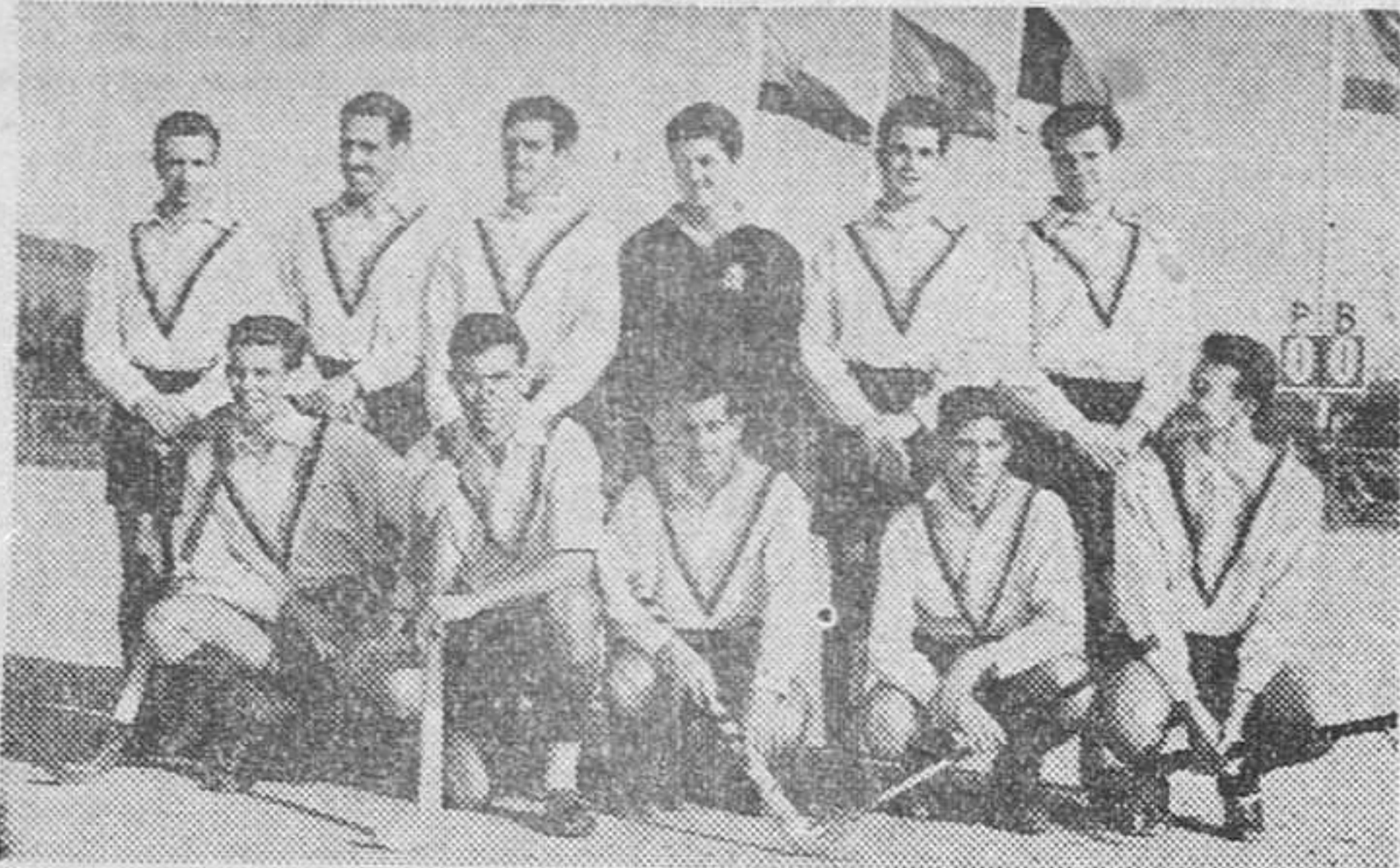
El once del Real Club de Polo, vencedor del Torneo Internacional-VII Copa Barcelona.

El C. D. Tarrasa, ganador de la Competición Juvenil de Reyes