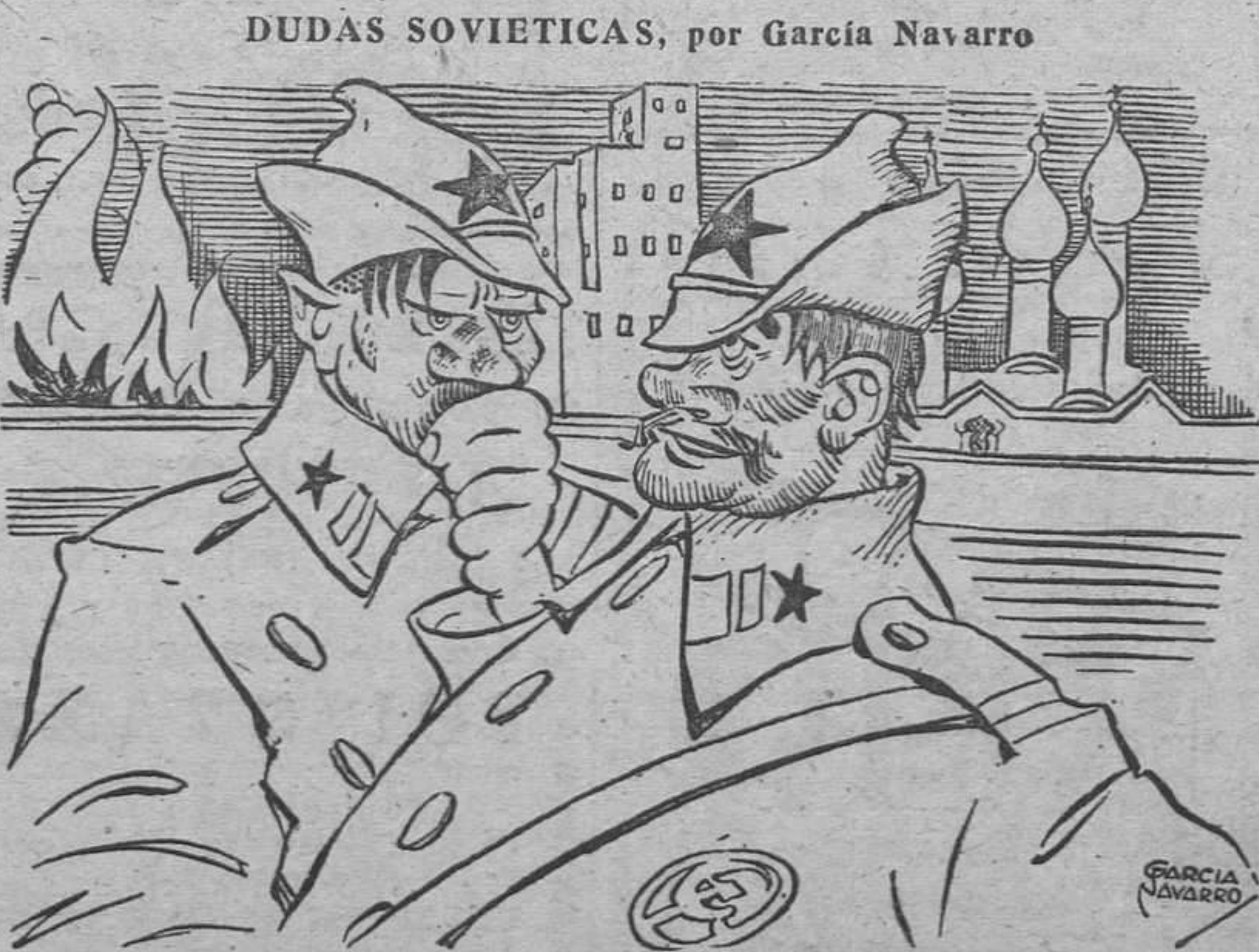
— Oye, Kamelof; a cincuenta aldeas por día, ¿cuántos años tardaríamos en llegar a Berlín?

En Europa y África, actividad local, sin grandes resultados bélicos. Los finlandeses llevan la iniciativa en el sector del Norte, y los rusos en el sector sur, sin conseguir hasta ahora éxitos apreciables de ninguna clase. En cuanto al Norte de África, tampoco la situación ha cambiado en las últimas veinticuatro horas. — Cifra.