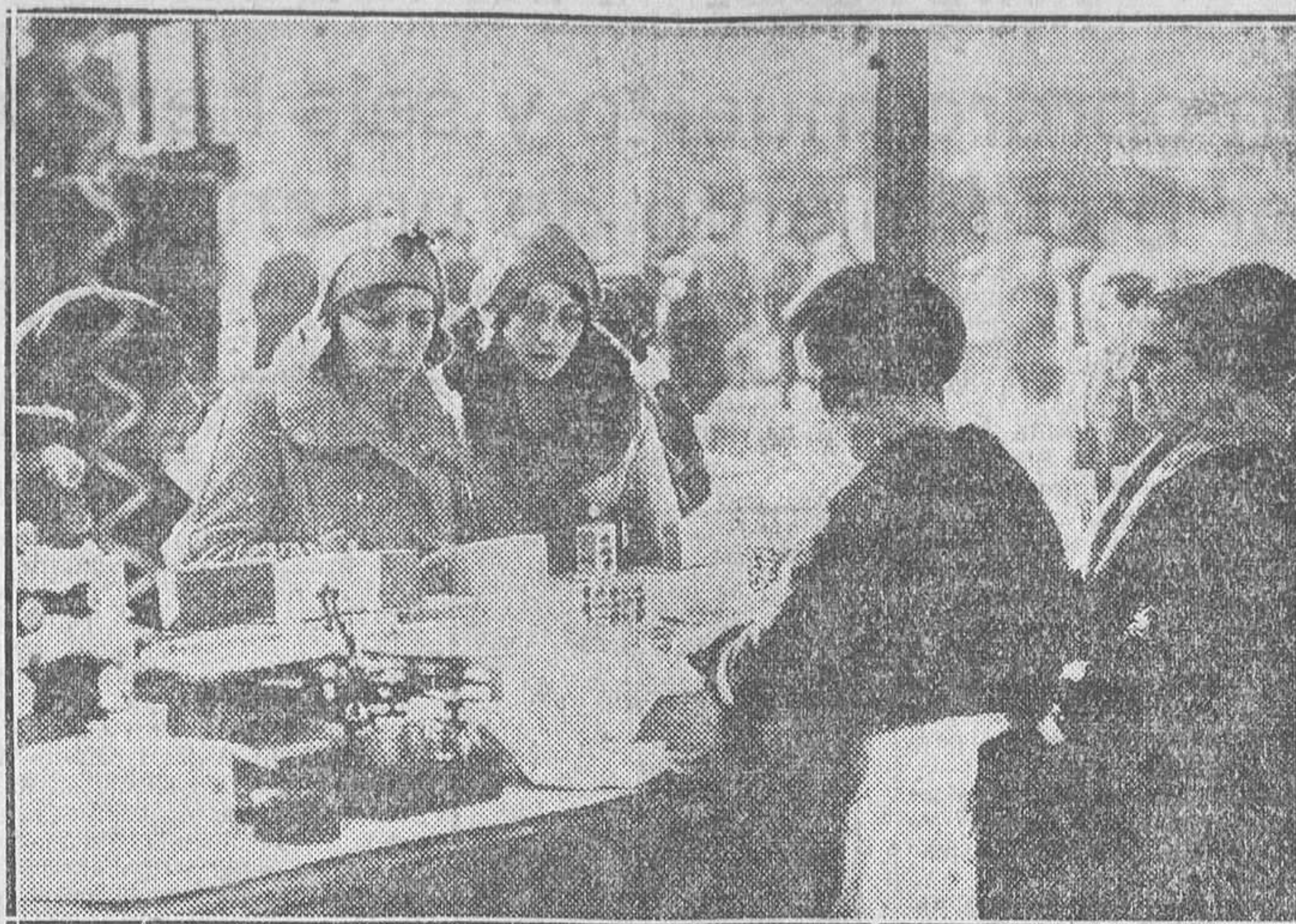
LAS FIESTAS DE NAVIDAD EN MADRID.—Un puesto de turrone en la plaza Mayor

El estribillo de dichas lucubraciones es digno de las mismas.