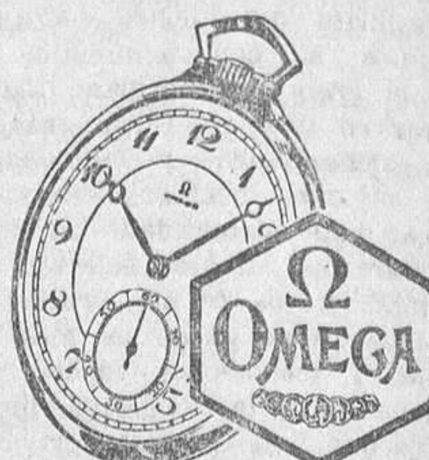
SUPERA A TODOS