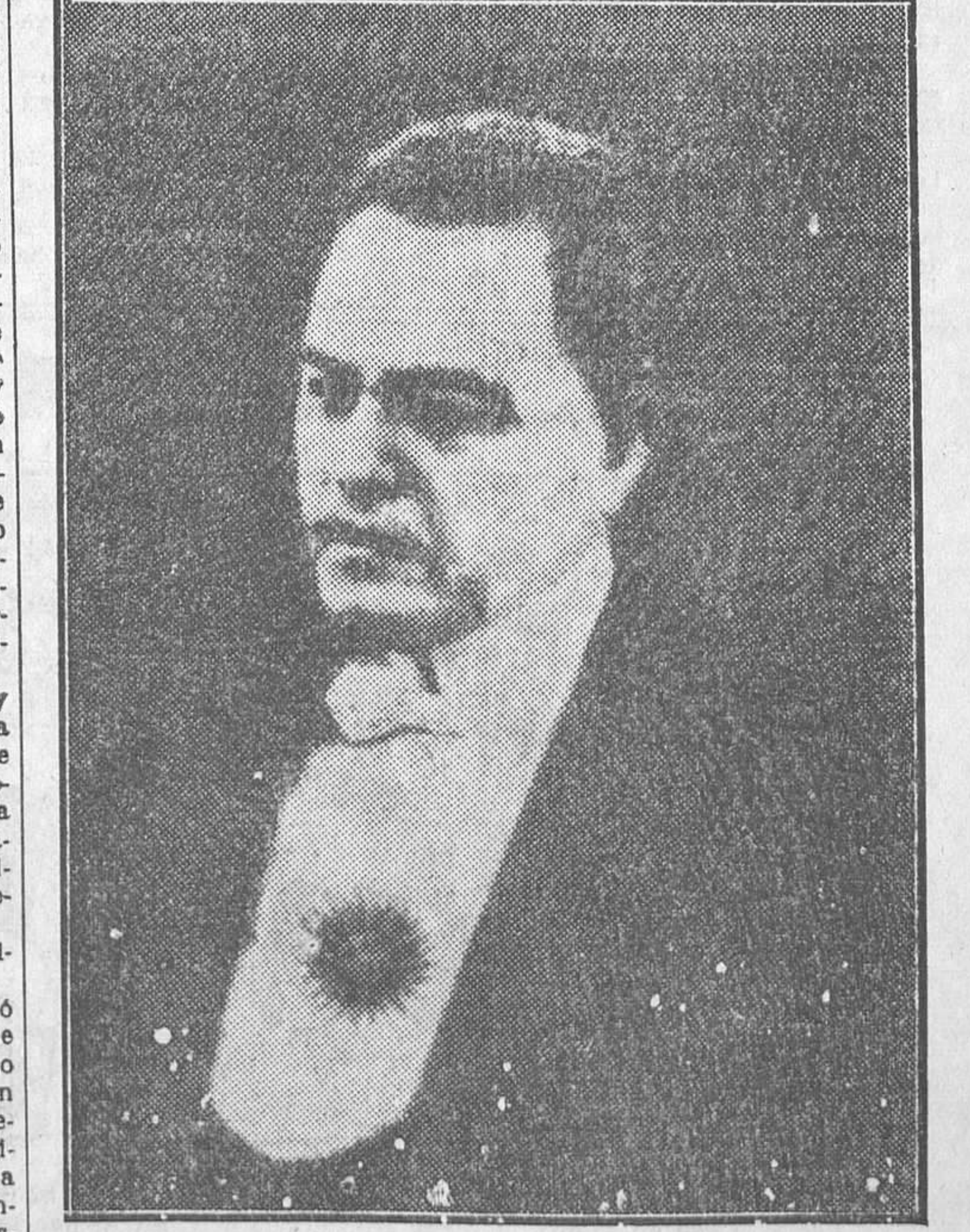
El doctor Hipólito Irigoyen, que ha tomado solemne posesión, en medio del entusiasmo popular, de la presidencia de la República Argentina

Hemos leído en «Les Nouvelles Littéraires» del 6 del corriente las siguientes líneas, insertas en la sección que el crítico francés monsieur Marcel Brion dedica semanalmente a la actualidad literaria en el extranjero: