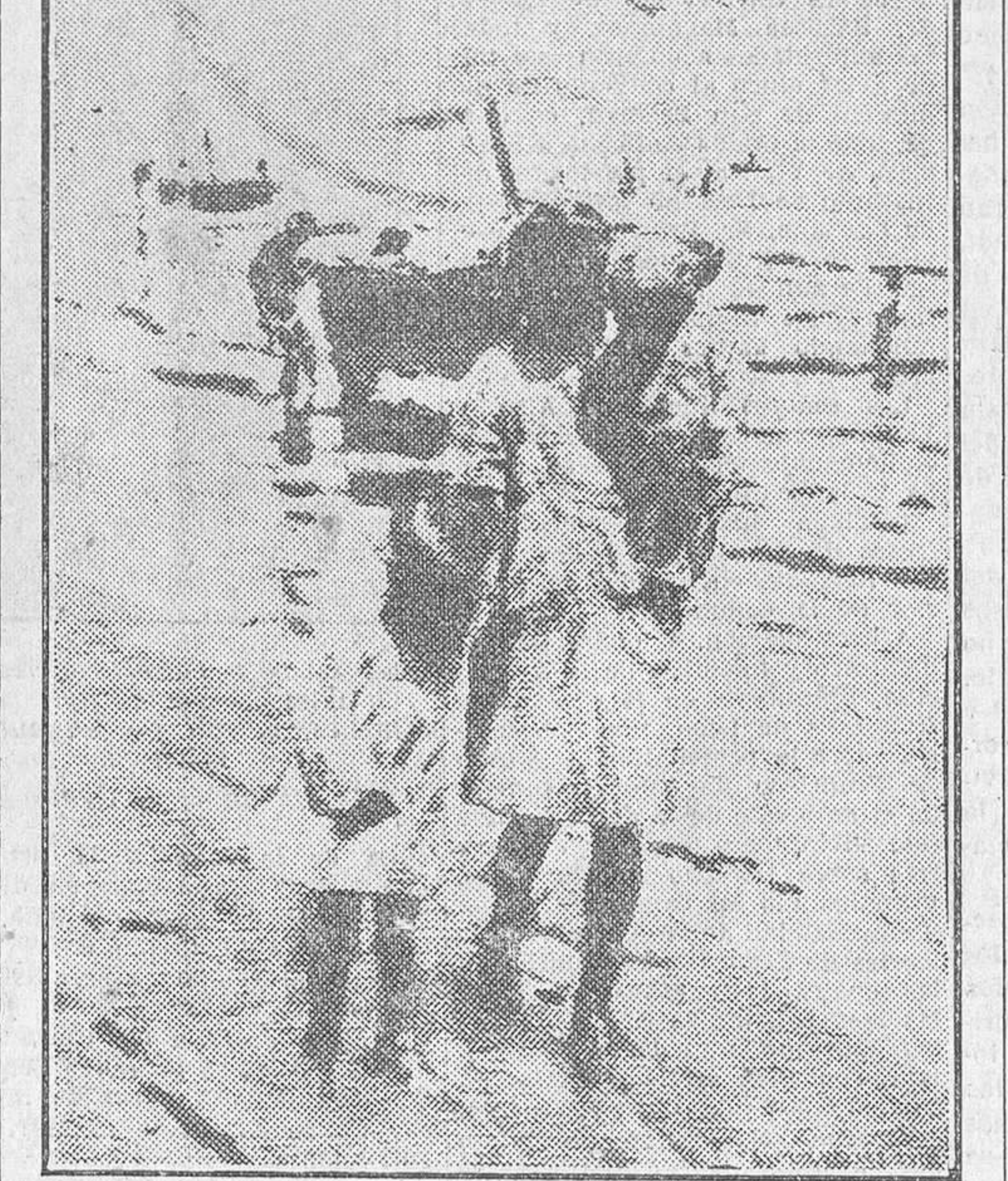
«En la playa», cuadro de Martínez Cubells

Cristóbal Ruiz. Paisajes y retrato. Meritorio esfuerzo por alcanzar la máxima simplificación en el