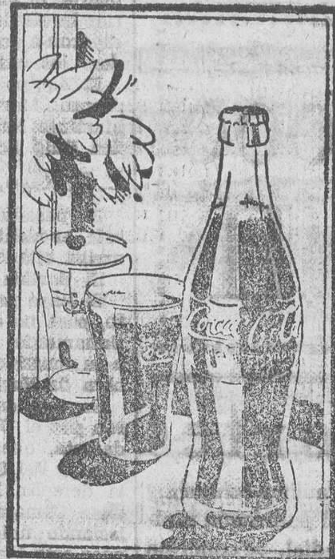
En esta bebida encontrará usted un sabor nuevo y diferente a todos los conocidos.