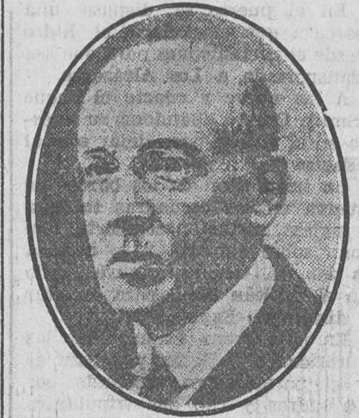
Nuestro ilustre colaborador don Eduardo Gómez de Baquero, «Andrenio»

Don Eduardo López de Baquero, por su labor de publicista, es uno de los más altos valores de la Prensa española. Con un tono mesurado, en un estilo de plena madurez intelectual, ha realizado durante estos últimos años una insuperable tarea de liberalismo. Las crónicas de nuestro ilustre colaborador son verdaderas páginas modeladas, a cuya sugestión difícilmente puede resistirse. Su larga vida, es una constante y ejemplar producción en la crítica, que le ha colocado en