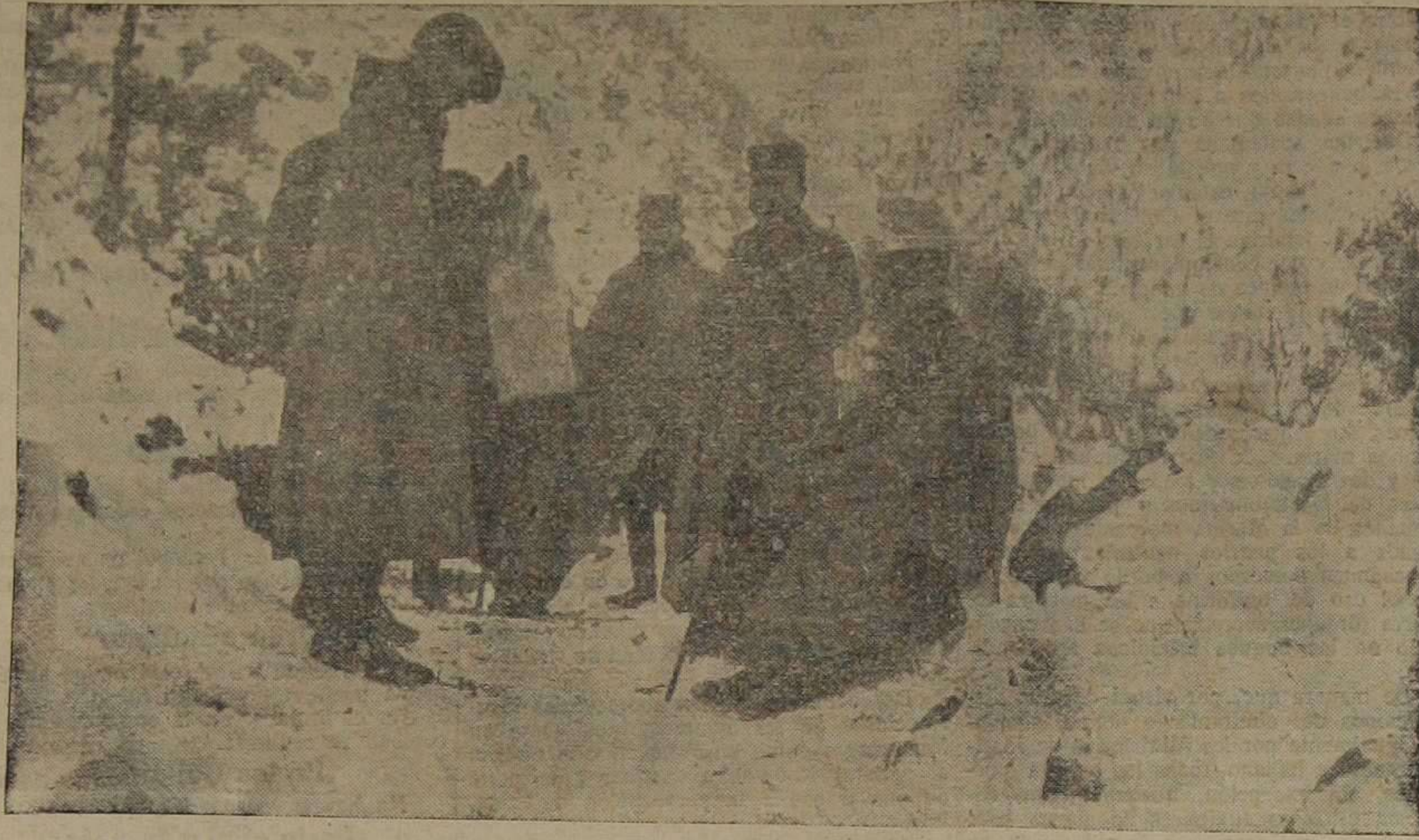
El rey de Servia acompañado por unos oficiales descansando durante su marcha a Albania