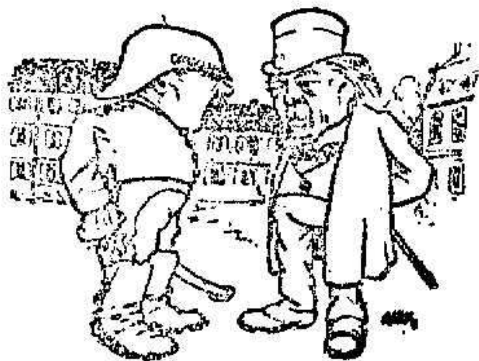
Un poco de cosmografía

(El sabio).—Sí, ¿sabéis quién es Venus? (El artillero).—Ya lo creo; como que somos compañeros. Venus es la yegua de mi capitán; yo la ensillo todos los días.