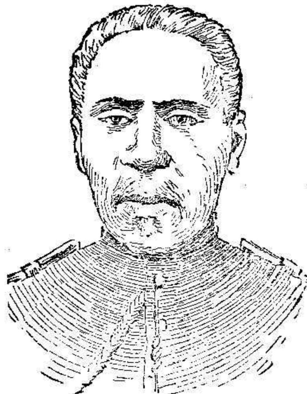
El general Alexis Nord

En los precisos momentos en que sus partidarios, con dinero facilitado por él y sigiloso sus consejos, se disponían nuevamente á ensangrentar las ciudades y los campos de la república haitiana, llevándolo á efecto una revolución para despostrar de la presidencia al general Alexis Nord, ex presidente de aquel diminuto estado.