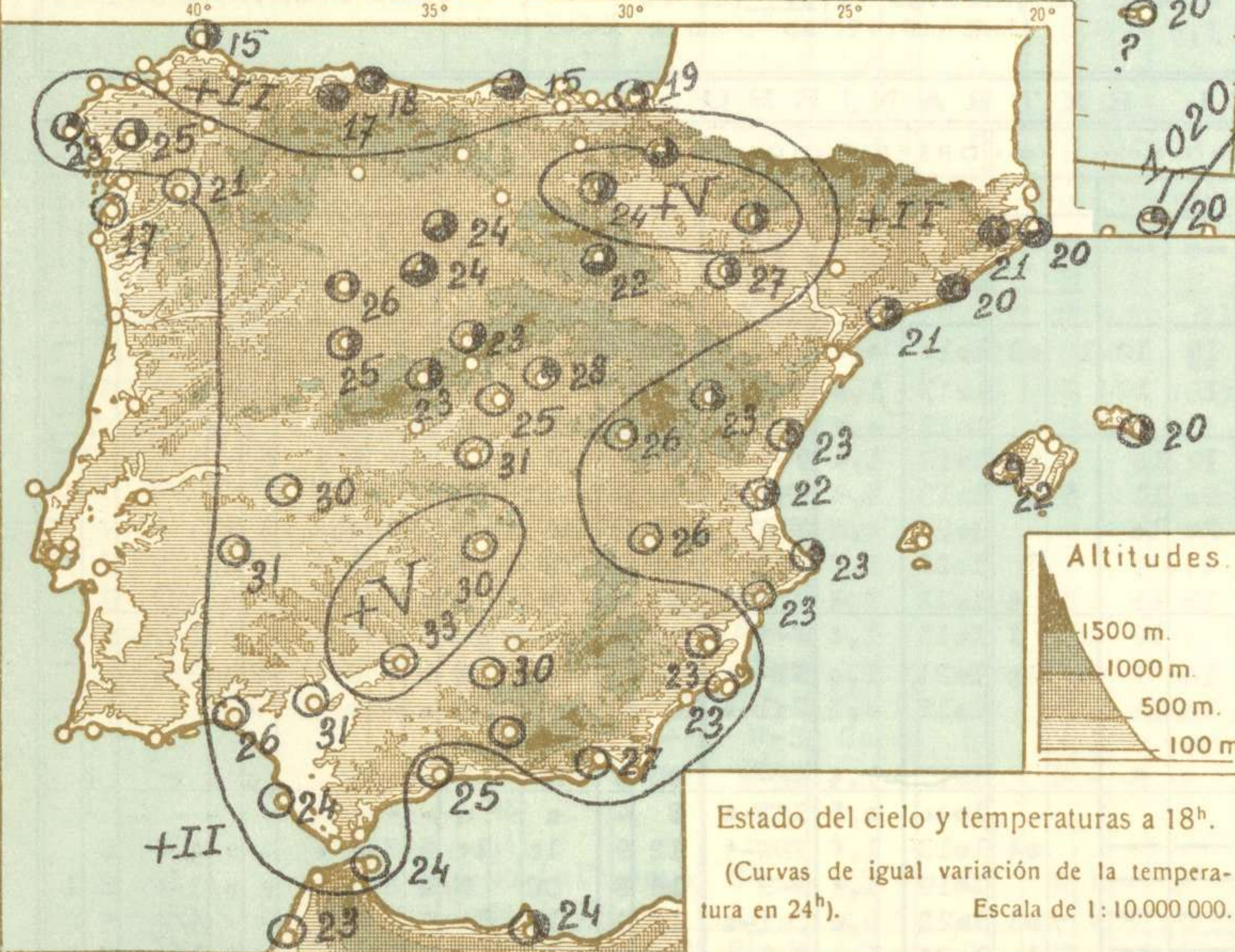
Estado del cielo y temperaturas a 18 h . (Curvas de igual variación de la temperatura en 24 h ). Escala de 1 : 10.000.000.