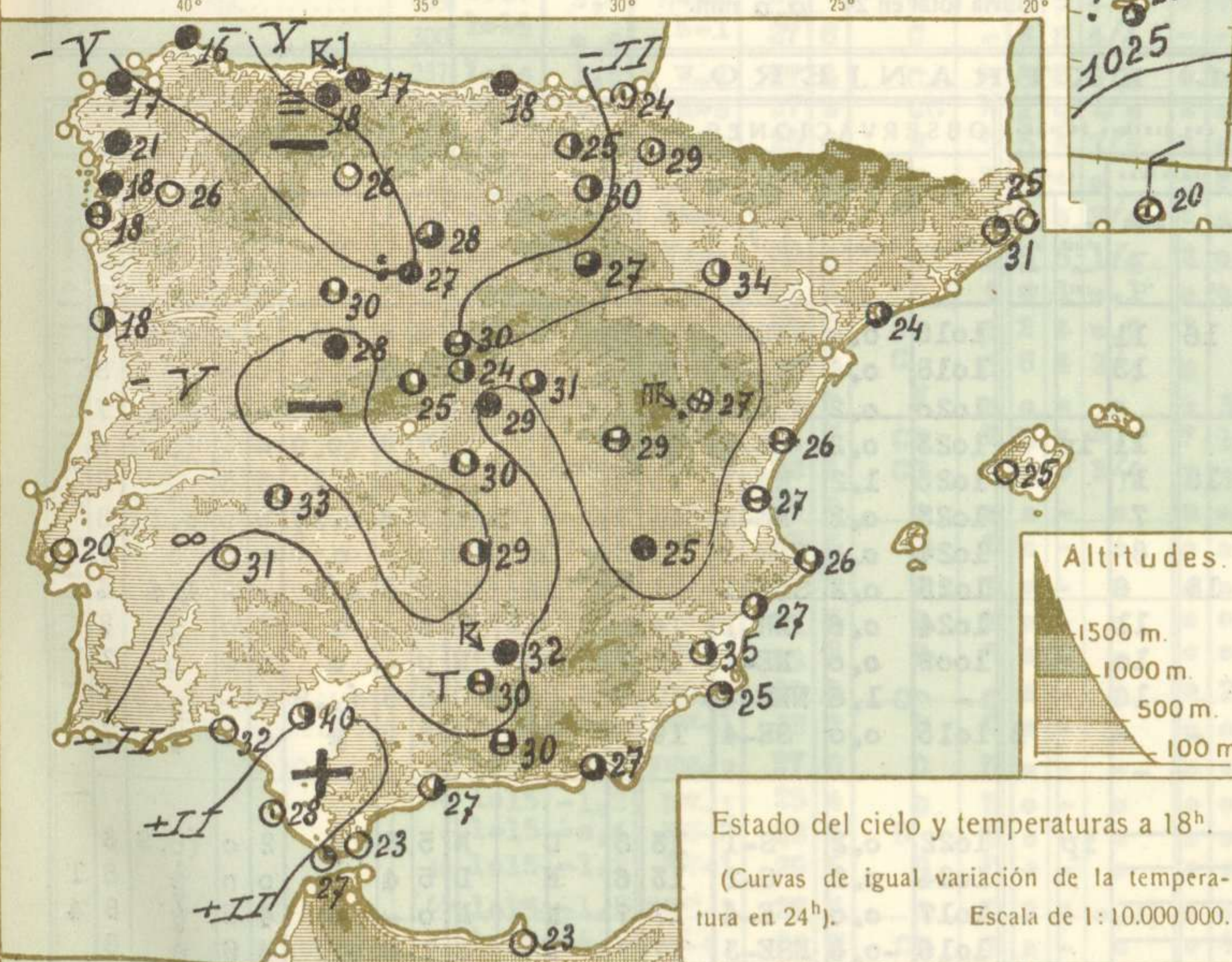
Estado del cielo y temperaturas a 18 h . (Curvas de igual variación de la temperatura en 24 h ). Escala de 1:10.000.000.