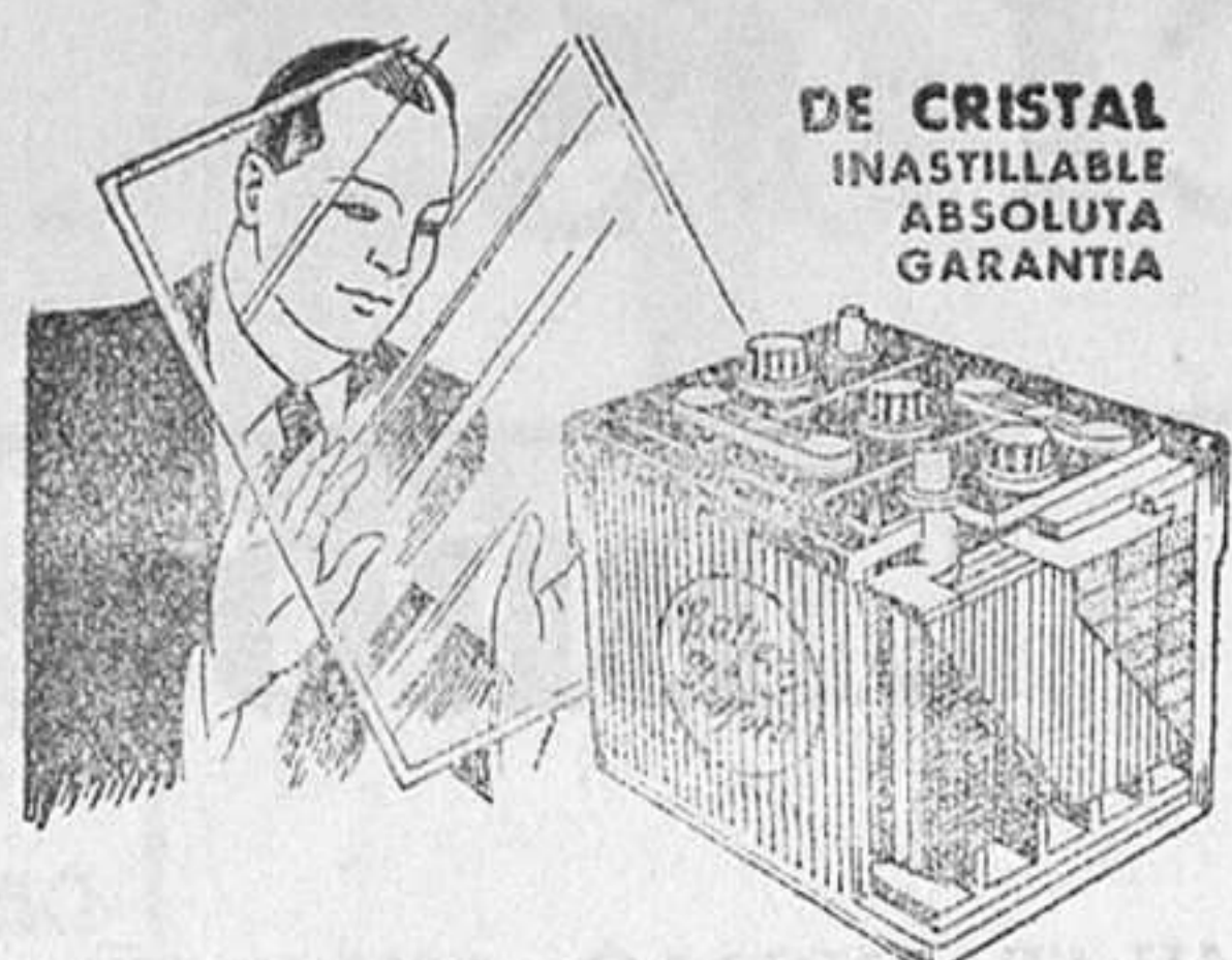
DE CRISTAL INASTILLABLE ABSOLUTA GARANTIA