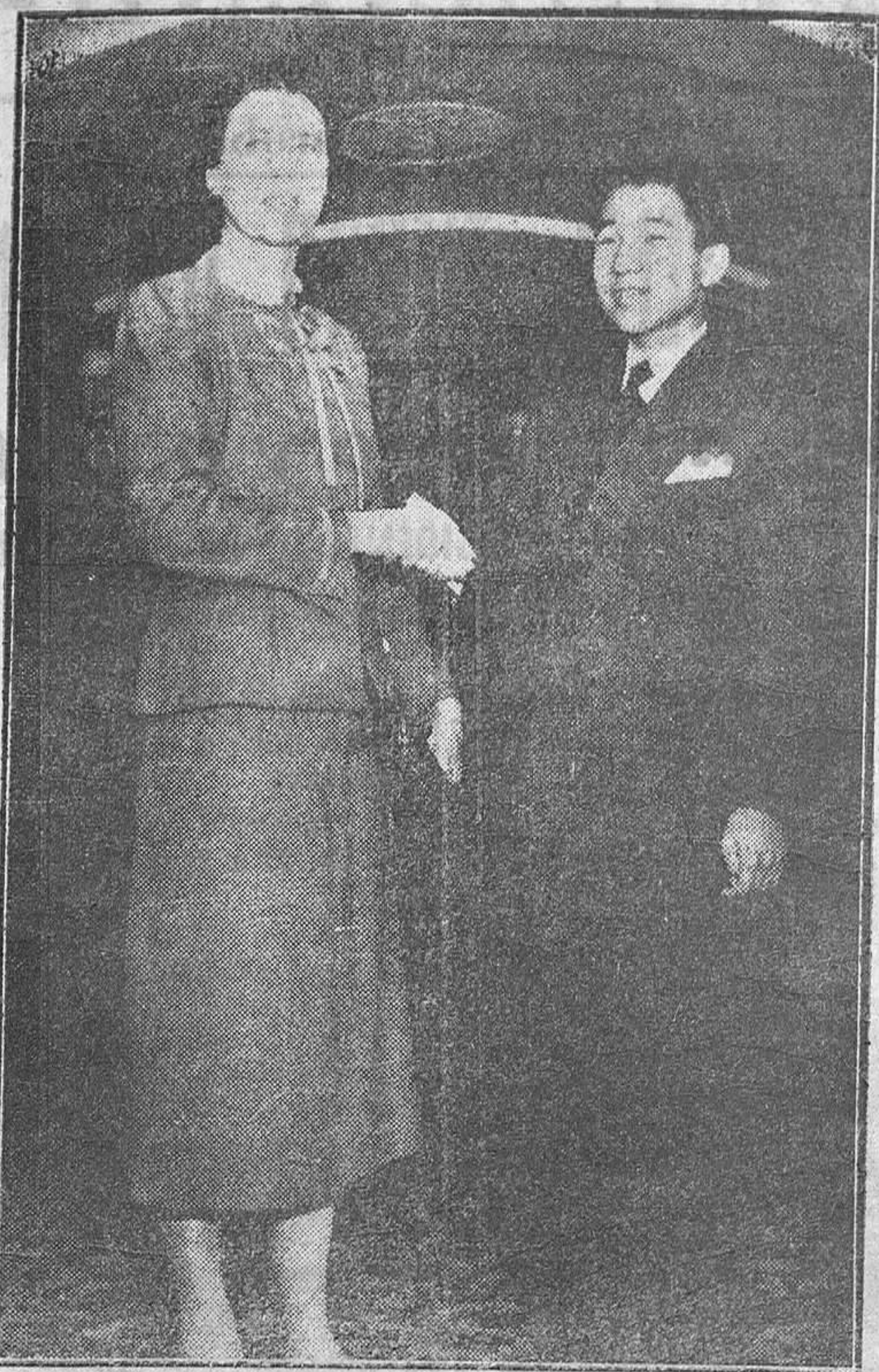
Nueva York.—El príncipe Aki-Hito, acompañado de una de sus profesoras, en el hotel donde se hospedan, durante su visita a esta capital.—El heredero japonés visitará España.