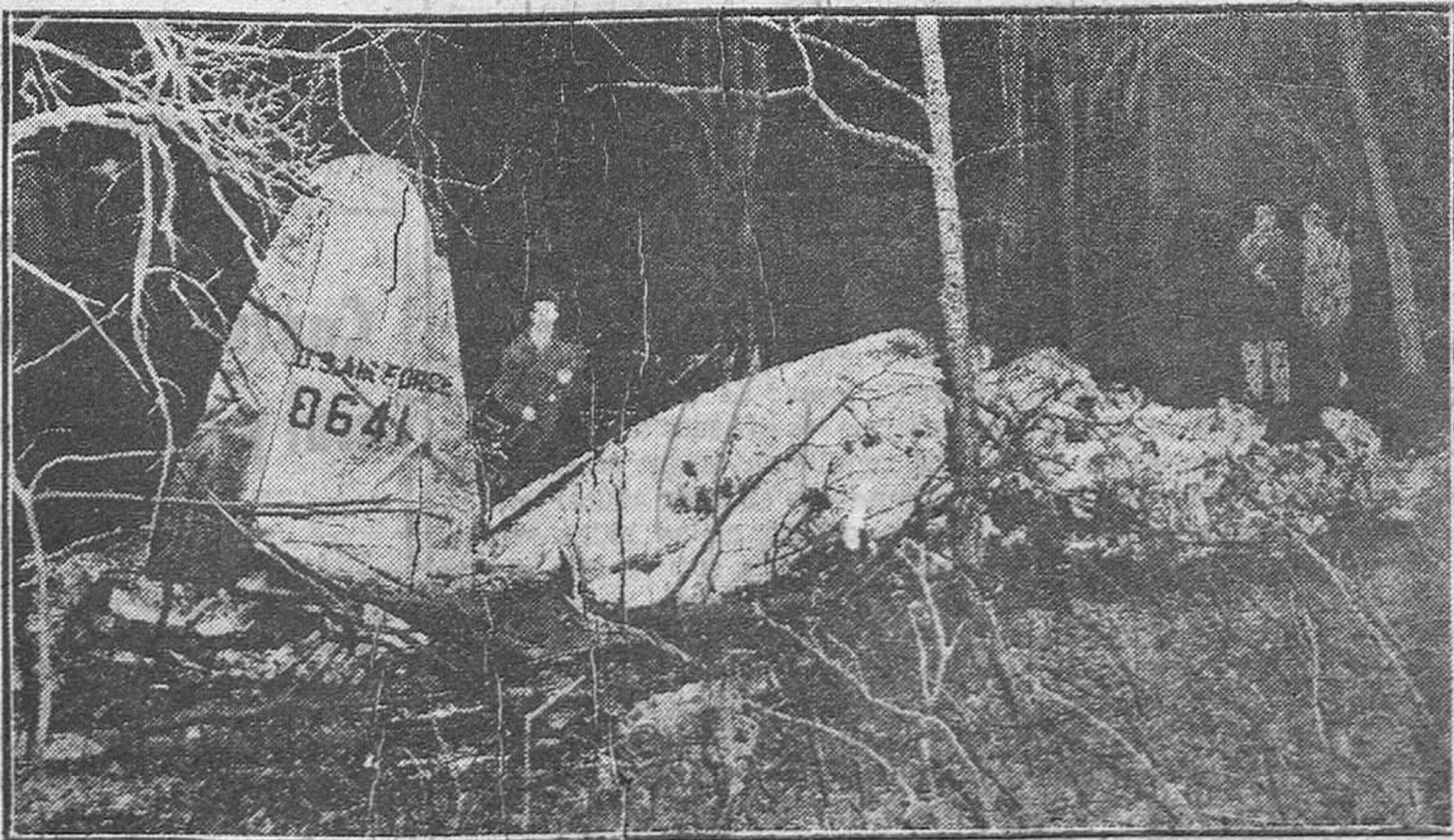
Así quedó el "B-29" que se estrelló en el aire con un bombardero "B-29" sobre la bahía de Peconic (Estados Unidos). El trágico balance fué seis muertos.

Alejado del mundo real español, mejor dicho, sin haber nunca entrado en él, me declaro el menos autorizado para opinar sobre el valor de la obra de los Quintero, ni creo que ello sea obligación necesaria en este artículo. Los Quintero, en todo caso, hicieron un teatro muy suyo y que mueve en el más frívolo de sus aspectos, a simpatía. Lo que es bonito y noblemente enviable es que un grupo de gentes formen una Asociación para honrar a quienes no pueden ya darles nada y que, entre sus atreos y proyectos, esté nada menos que la creación de un pueblo, casi como un escenario perdurable donde actores de la vida, puedan representar la comedia de la existencia.