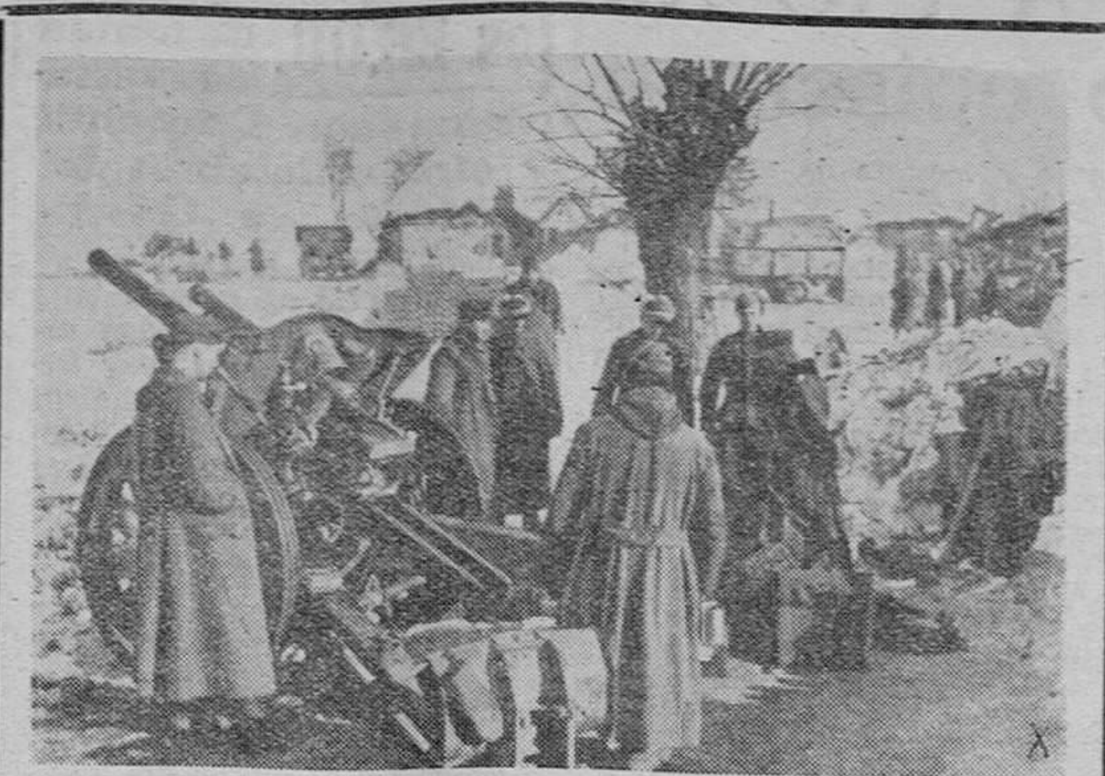
El general de una posición de artillería en visita de inspección. Los soldados alemanes artilleros informan a su general de las novedades de la batería así como de los daños causados al enemigo.

En los círculos políticos norteamericanos se hace constar que el Gobierno de Washington sigue sustentado el mismo criterio ya conocido sobre la vuelta de Laval al poder; pero queda por decidir la política definitiva que se adoptará en vista de las nuevas circunstancias. Unicamente se precisa que las expediciones de viveres con destino a África del Norte francesa, serán suspendidas hasta que se aclare definitivamente la situación.—Efe.