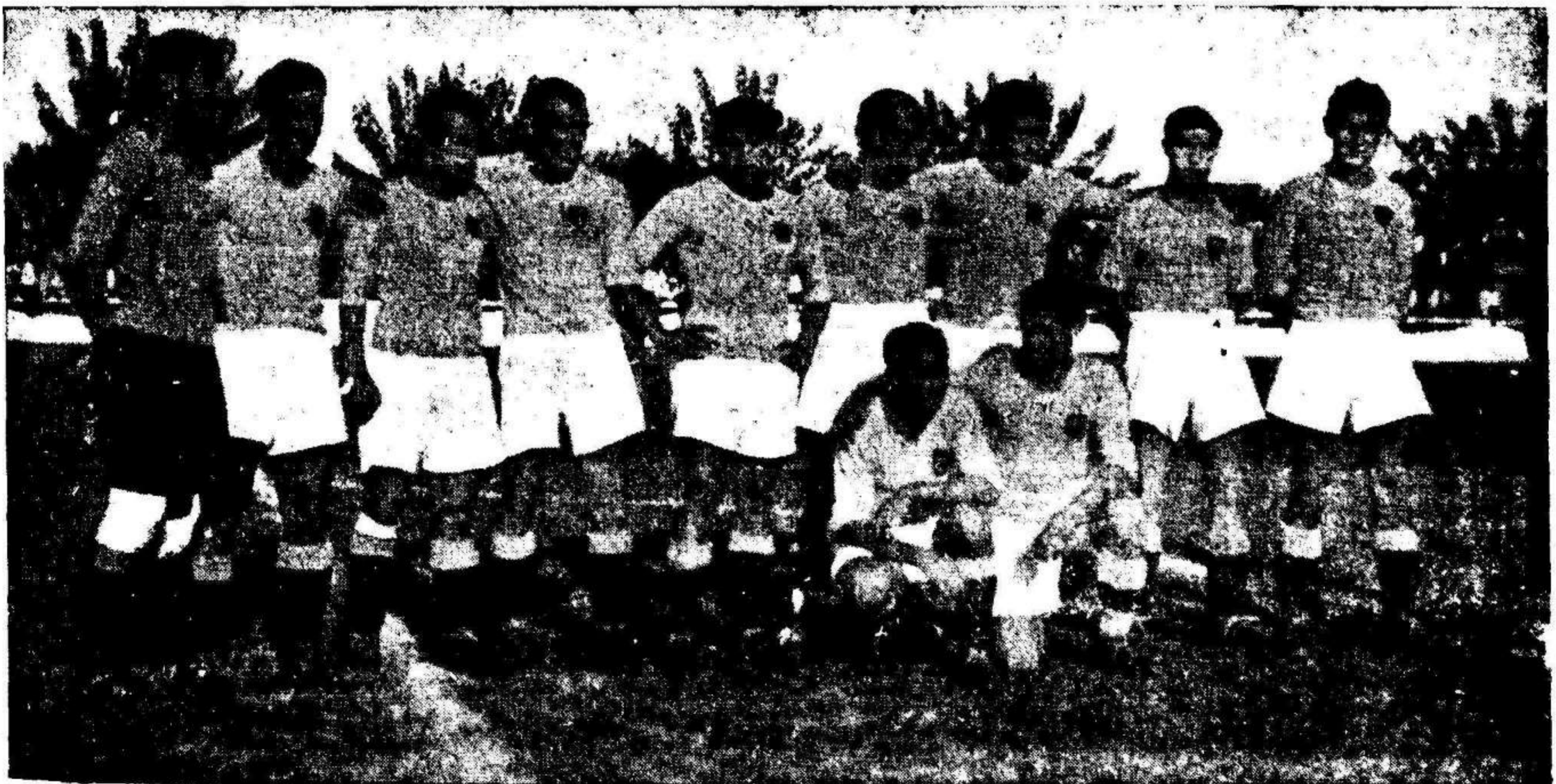
Equipo del Valencia F. C. que, tras un disputado encuentro venció al Murcia, en Mestalla, por la mínima diferencia.