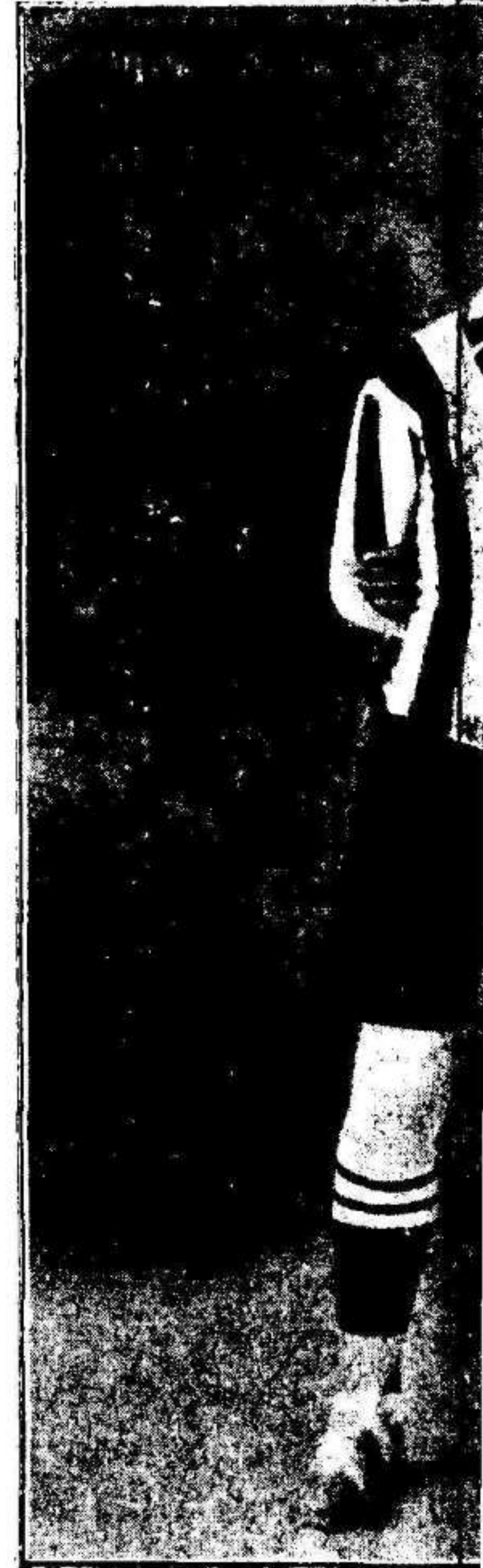
VEN Defensa derecha de la U que actuó brillantemente en lo contra Manze

que han jugado mucho toda la tarde les salvan con su actuación de una mayor derrota; eso y la noche con sus tinieblas, obliga a suspender el partido. Esto favoreció sin duda a los murcianos, pero siempre queda la