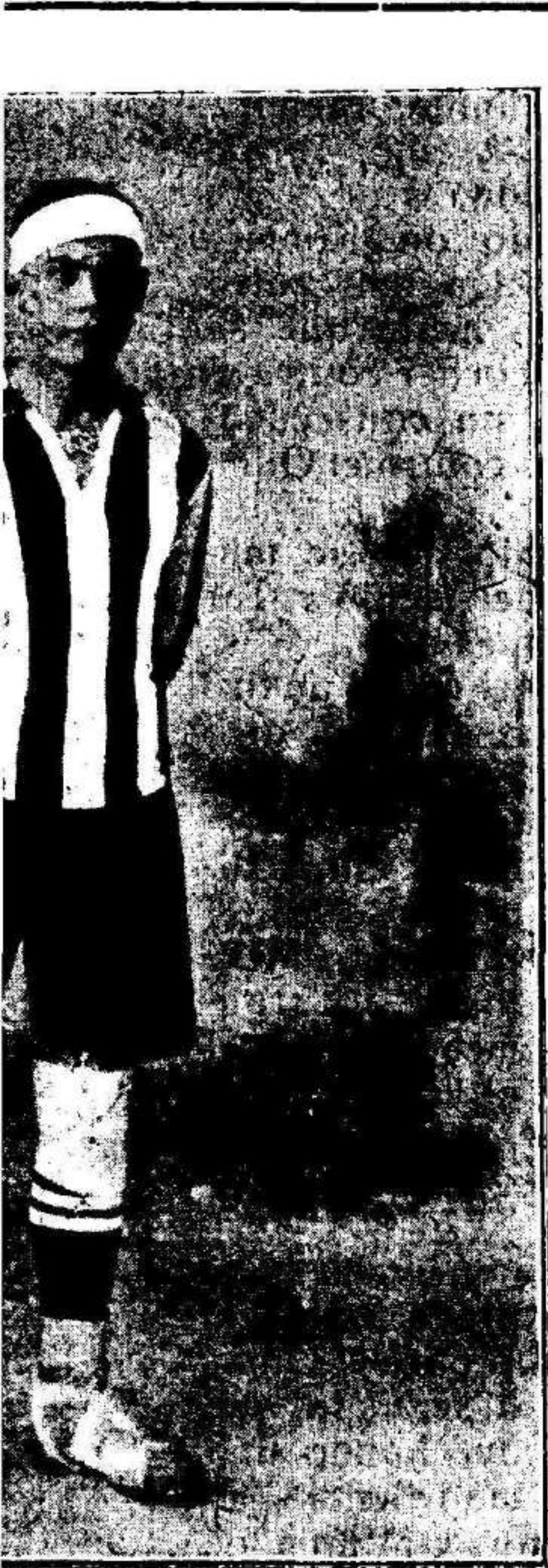
ANCIO nión deportiva de Socuéllamos s partidos celebrados recientemente anares y Criptana.

jearon algo los extremos; Gomariz, por su poca talla y poca edad no puede hacer más en estos partidos; el otro puede más; le hemos visto tardes mejores. En la línea de medios López (V.) como siempre enorme, muy