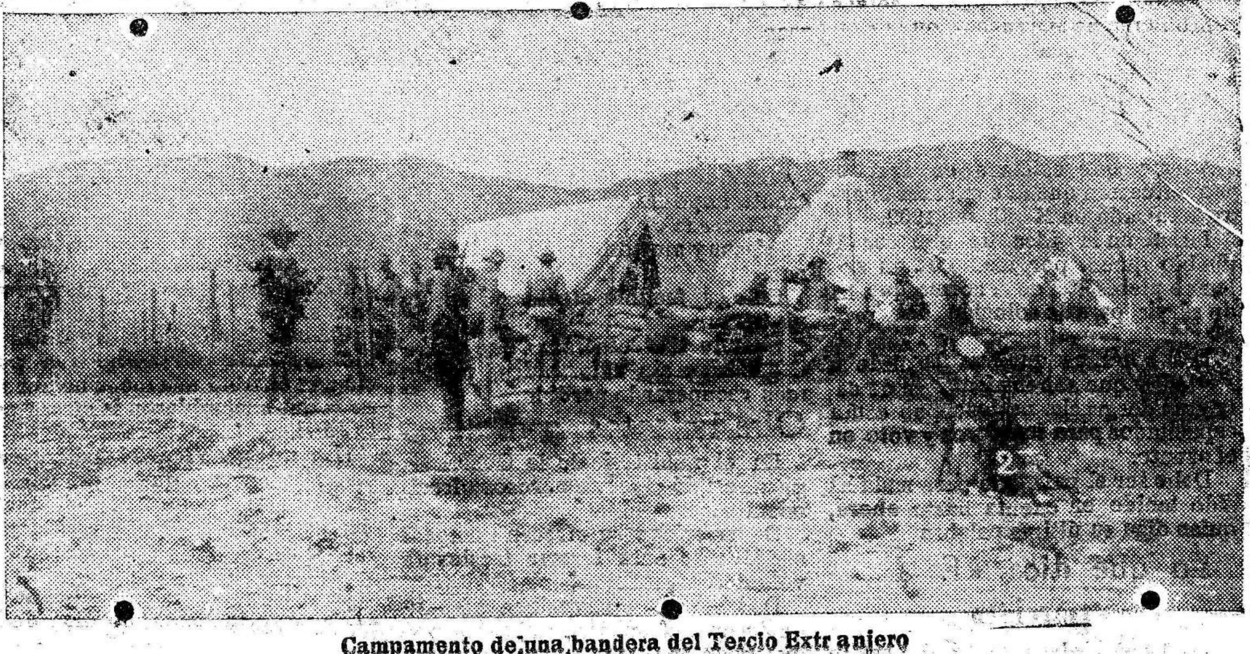
Campamento de una bandera del Tercio Extranjero

En el campamento de Benicarr se han presentado ocho soldados que estaban prisioneros.