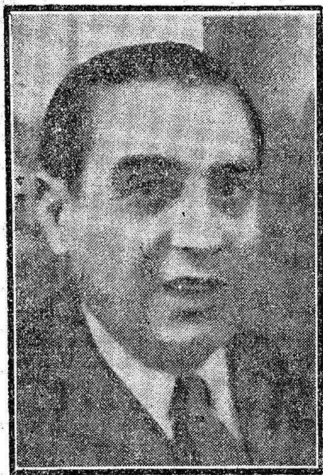
Don Luis Jiménez de Asúa

Desde primera hora de la mañana, se formaron largas colas a las puertas de los colegios, pudiendo observar-