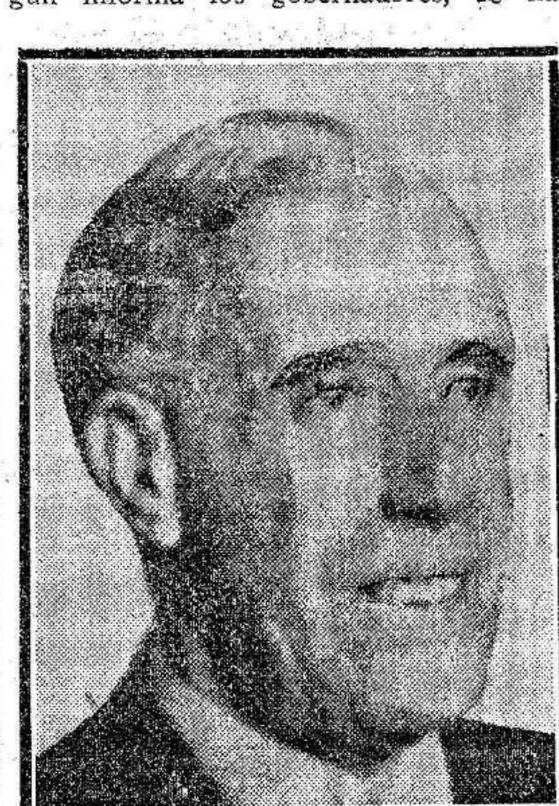
Don Julián Besteiro

En la mayor parte de las provincias, según informa los gobernadores, se han