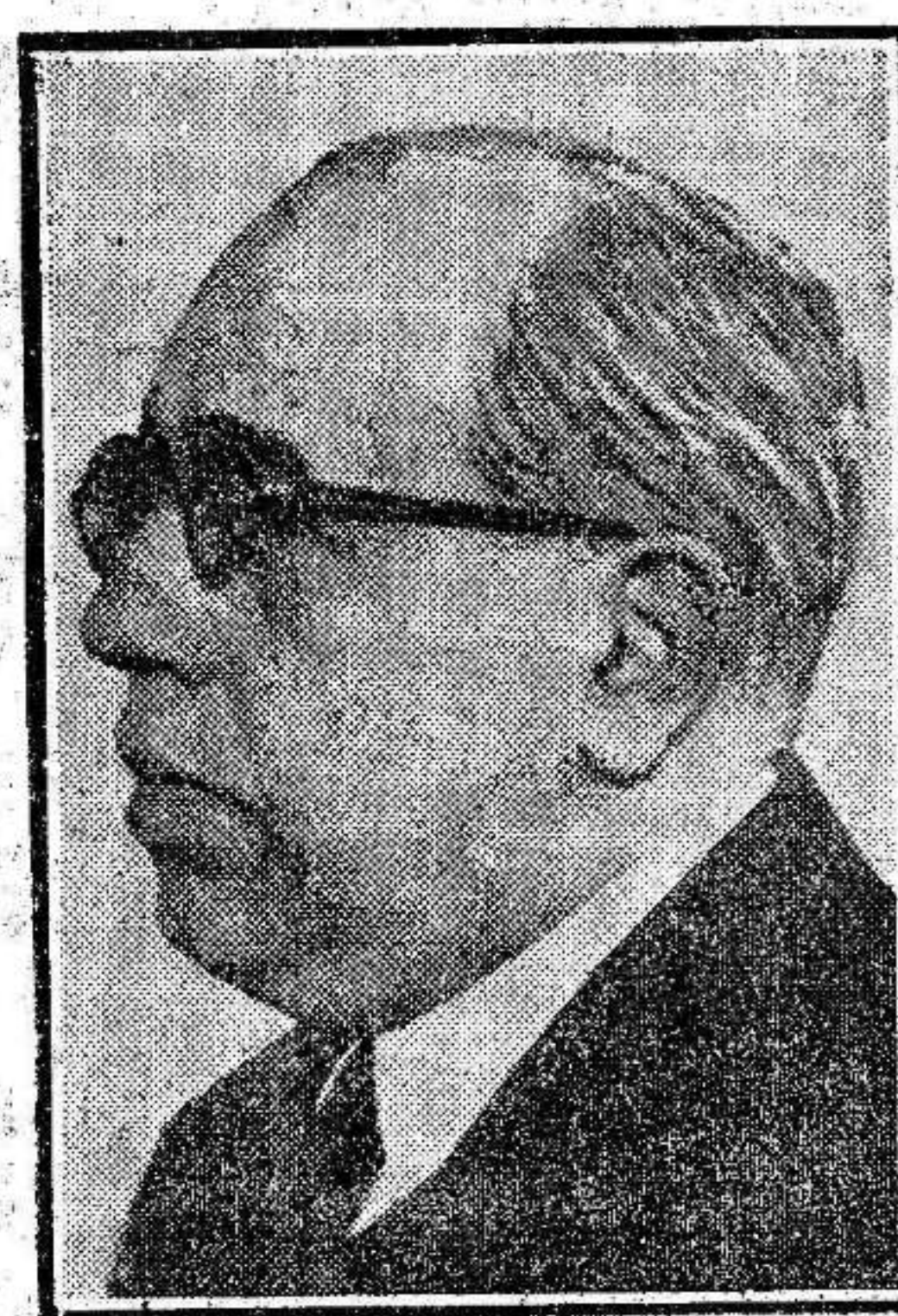
Don Manuel Azaña

to es el triunfo de la Esquerra Catalana sobre la Lliga Regionalista de Barcelona y en casi toda Cataluña. La diferencia de votos es considerable en la capital, y aunque faltan algunas secciones por conocer, puede descontarse que la mayoría es de la Esquerra, y en la provincia, aunque no con tanta precisión, puede creerse en un resultado semejante.