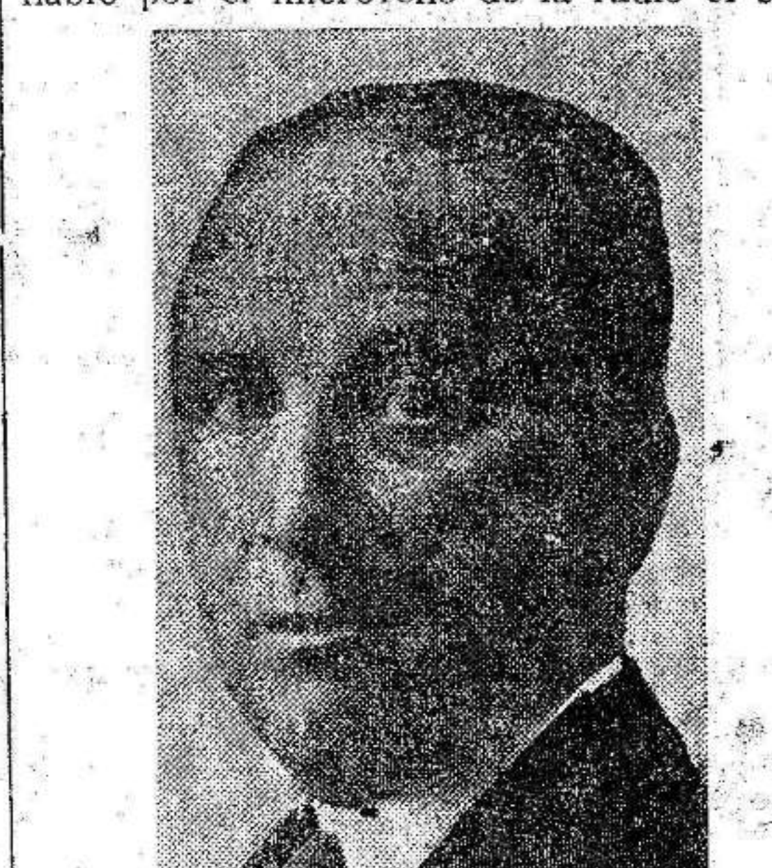
Don Francisco Largo Caballero

MADRID.—A las ocho de la noche habló por el micrófono de la radio el se-