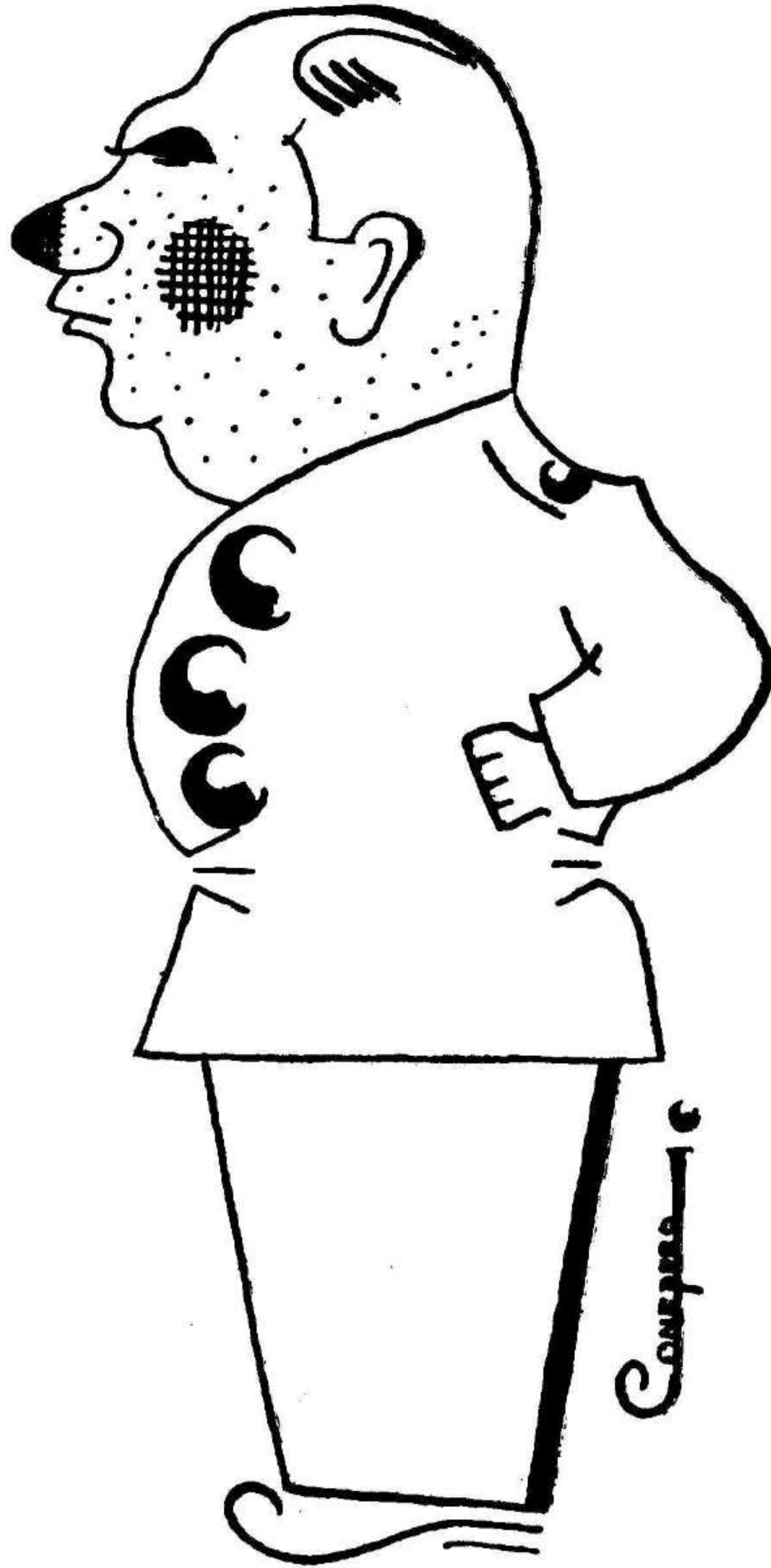
El Jefe de los marciales ulanos municipales